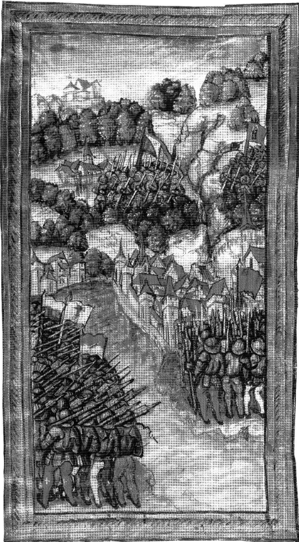
Abb. 2: Zuger Handel 1404: Leute aus Schwyz und dem Zugerland belagern die Stadt Zug. Krieger aus Uri, Unterwalden und Luzern sowie aus Zürich und Glarus sind im Anmarsch, um den Übergriff zu verhindern. Diebold-Schilling-Chronik 1513, ZHB Luzern (Eigentum der Korporation Luzern).