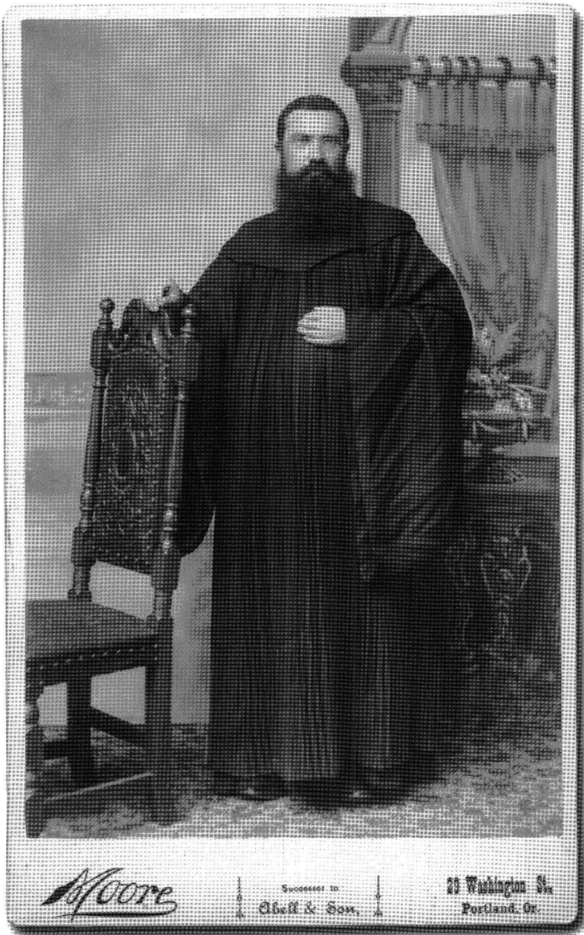
P. Adelhelm Odermatt (1844–1920). Das Foto entstand zwischen 1882 und 1890.