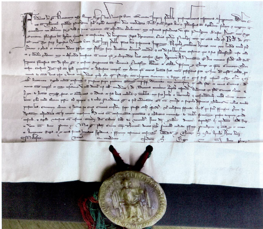
Im Zeichen königlicher Gunst: Friedrich bestätigt und besiegelt am 10. April 1315 der Stadt Zürich das Privileg von König Rudolf von Habsburg.

Da Herzog Leopold noch Anfang September 1315 in der Region Augsburg Krieg führte und bereits im Sommer 1316 wieder vor die Stadt Esslingen zog,