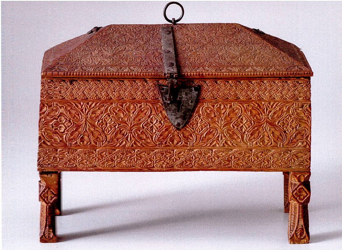
Hochfüssige Brieflade, Kasten und rundplastisch reich geschnitzte Füsse separat gearbeitet. Brieflade aus der Innerschweiz. Ende 13. Jahrhundert (Schweizerisches Nationalmuseum, LM 11942).