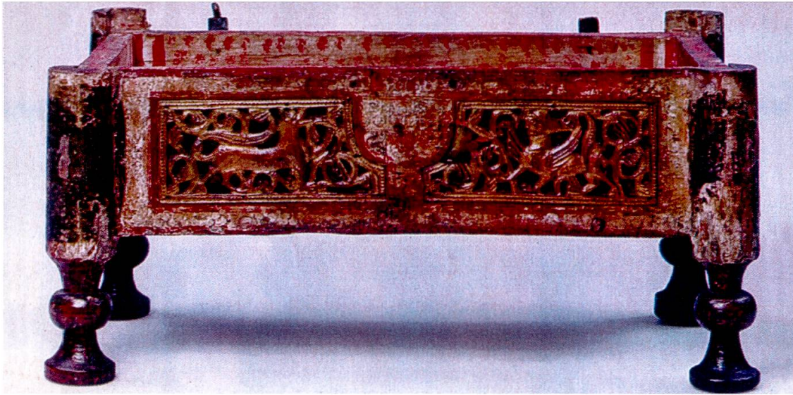
Hochfüssige Brieflade mit Aussenstollen. Um 1250. Aus dem Münster von Freiburg i. Br.

Von diesem aufwendiger gearbeitetem Typ B mit gedrehten Aussenstollen haben sich wiederum zwei Exemplare erhalten: das eine, um 1250, befindet sich im Augustinermuseum Freiburg i. Br., als Eigentum des Erzbischöflichen Diözesanmuseums Freiburg i. Br. Nr. K I I / D. Es stammt aus dem Freiburger Münster. 56 Es ist reich mit Durchbruchschnitzereien (Gitterreliefs) geschmückt. Die zweite Brieflade mit entsprechend gedrehten Aussenstollen stammt aus der Schweiz (heute Art Institute Chicago). 57 Es ist gleichfalls von Gitterreliefs reich überzogen, die jenen der Brieflade in Freiburg i. Br. verwandt sind. Die beiden Objekte werden denn auch von der Forschung als zusammengehörend erachtet. 58