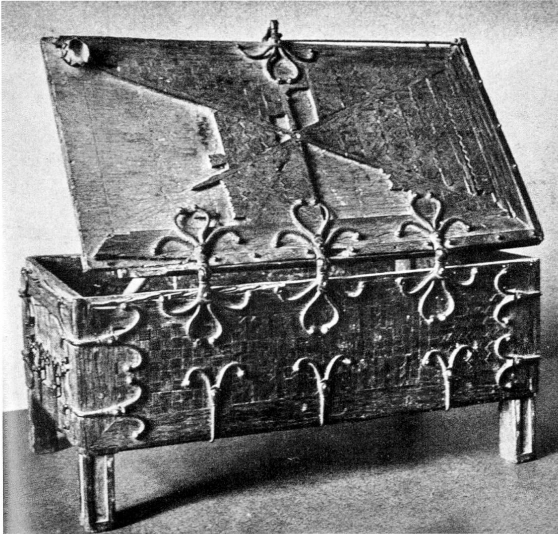
Hochfüssige Briefflade mit Innenstollen. Um 1200. Aus dem Franziskanerkloster St. Andreas in Halberstadt (Abbildung aus: Zeit der Staufer II, Abb. 313).

Typ B, Brieffladen mit äusseren Eckstollen: Beigezogen werden gedrechselte röhrenförmige Stollen. Im Bereich der Kästchenlänge sind sie mit einem rechtwinkligen Einschnitt versehen, der die Kästchenecken verstärkend umklammert und zugleich die Nahtstellen der genutet zusammengesetzten Wände überdeckt. Unterhalb des Kästchenbodens wird die Röhrenform voll belassen, womit zusätzlich der Kästchenboden gestützt und gesichert wird. Fortgeführt als hohe Füße entwickeln sich hier gewisse Zierelemente: die hohen Füße ziehen sich gegen die Mitte leicht ein, sind hier mit einem gequetschten Kugelknauf besetzt, muten wie vergrößerte Kelchfüsse an.