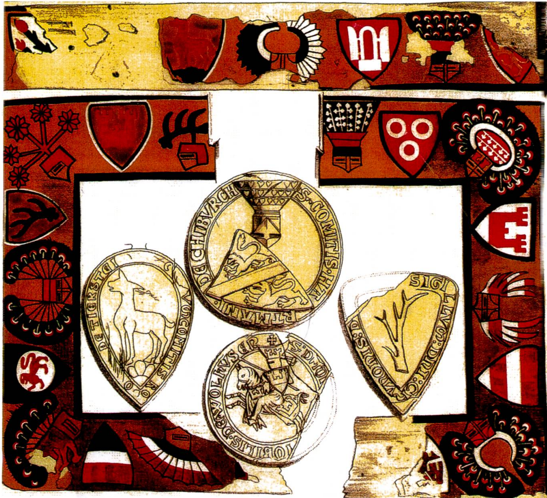
Wappenfolge auf dem Fries des Deckels. Nach Heinrich Zeller-Werdmüller.