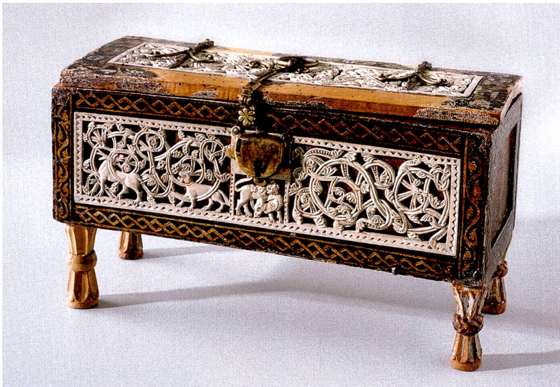
Kästchen von Attinghausen. Vordere Längsseite (Schweizerisches Nationalmuseum, LM 3405.34).