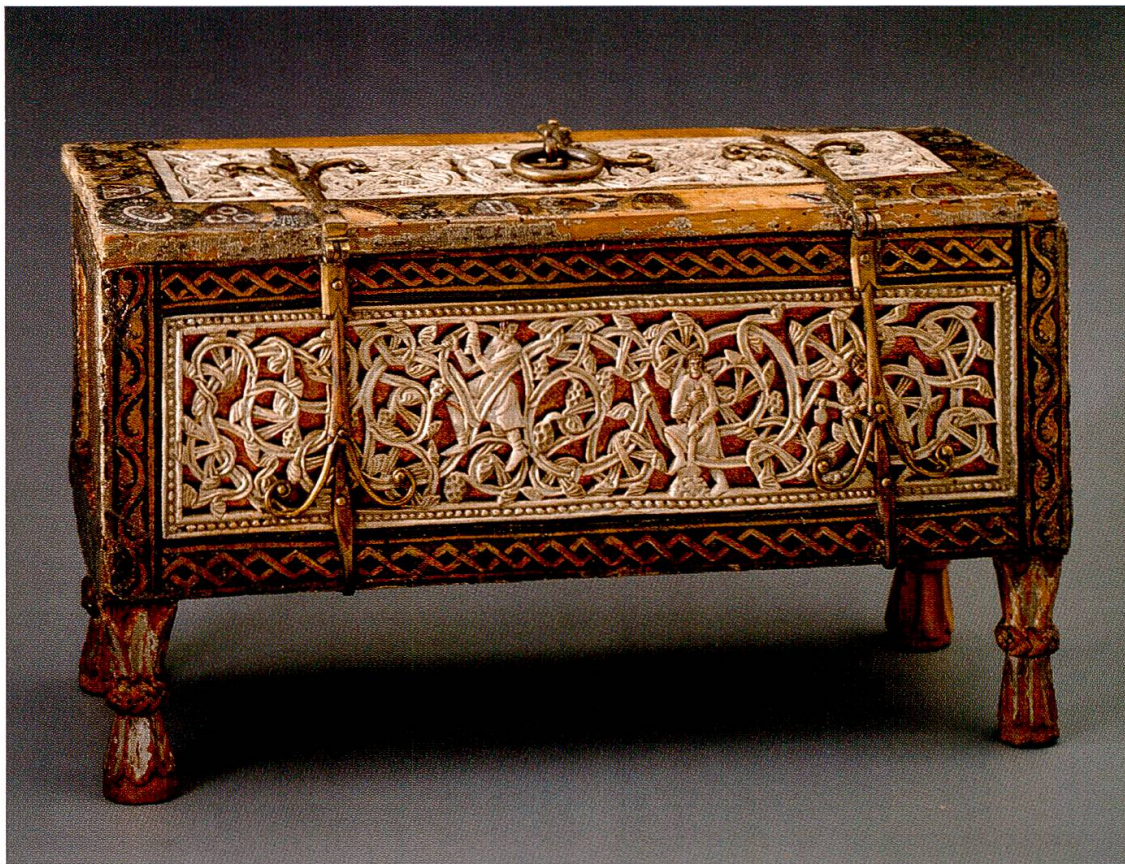
Kästchen von Attinghausen. Rückwärtige Längsseite (Schweizerisches Nationalmuseum, LM 3405.34).

Gitterrelief und Rähmchen sind lasierend weiss bemalt, Elfenbein imitierend. Die Physiognomien werden mit roten und schwarzen Strichen zeichnerisch akzentuiert. Die Untersuchungen von 1991 stellten auch Farbspuren an den Ranken fest, möglicherweise waren deren «Adern» durch unterschiedliche Farben gekennzeichnet, welche den Verlauf der einzelnen Stränge etwas verdeutlichen. Als weiteres Farbelement schimmert in den offen gelassenen Partien der Durchbruchreliefs der goldglänzende Hintergrund hervor (Blattsilber, von Goldlack überzogen).