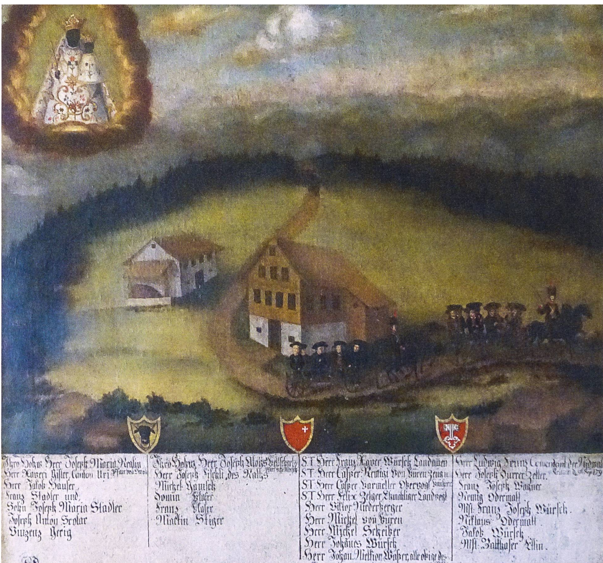
Widerstand gegen die Helvetik wurde streng bestraft, mit Geiselnhaft und Internierung. Die im Februar 1799 nach Basel verbannten Innerschweizer gelobten auf dem Hauenstein, nach glücklicher Heimkehr auf Maria Einsiedeln, Sonnenberg-Seelisberg und Niederrickenbach zu wallfahren. (Kloster Einsiedeln, Kustorei)