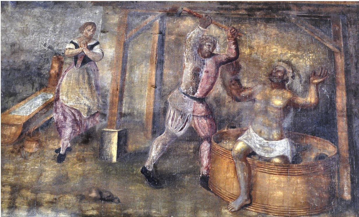
Abb. 3: St.-Joder-Kapelle Altdorf (NW) im Engelbergertal. Darstellung der Befreiungstat des Konrad von Altdorf in der Vorhalle der spätmittelalterlichen Kapelle, mit expressiver Gestik der Figuren. Der Bauer holt mit geschwungener Axt zum Schlag aus, während der aus dem Bad steigende halb nackte Landvogt mit ausgebreiteten Armen um Gnade zu bitten scheint und die herbeieilende Ehefrau vor Schreck die Hände zusammenschlägt.

liche[n] wort[en] als ob si im wilfarn welt (59). Und hier begegnen dem Leser dann noch zwei weitere von Tschudi erfundene Figuren, die beiden Diener des Vogts. Die Frau will nämlich nicht in deren Anwesenheit zu ihm ins Bad steigen. Ab hier übernimmt sie dann endgültig die weitere Planung des Geschehens und heisst den Vogt schon einmal ins Bad steigen, sie wolle sich noch in ir kamer schnell abziehen (65) und dann sich zu ihm hineinsetzen. 78 Bei diesem Ablenkungsmanöver, vom Erzähler herunterspielend ein list (58) genannt, handelt es sich wiederum um eine glatte Lüge, wenn auch wiederum um eine Notlüge. Ihre wahre Absicht ist es nämlich – worüber uns der Erzähler umgehend aufklärt – das Haus durch die Hintertür zu verlassen und zu fliehen. Doch in diesem Moment kommt gerade ihr Ehemann aus dem Wald zurück. Auch hier greift Tschudi wiederum in einem präriteritalen Kontext zum Stilmittel des «szenischen» Präsens: kumpt (68) – gegenüber kam (68) bei Etterlin.