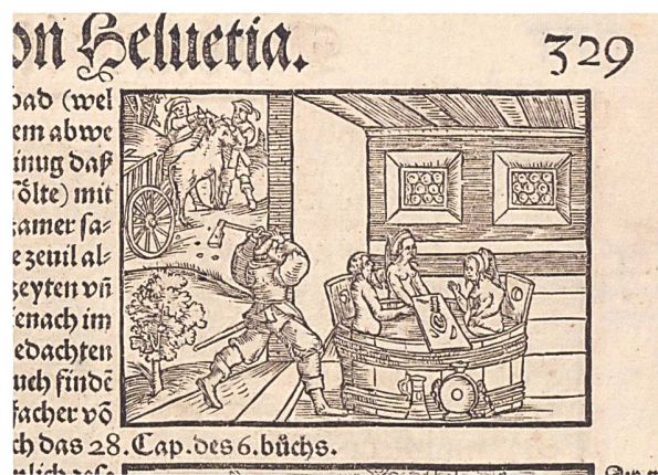
Abb. 5: Johannes Stumpf: Schweizerchronik (1548). Im Gegensatz zu andern bildlichen Darstellungen sitzt hier die Frau mit dem Vogt im Badezuber, und eine Magd trägt auf einem Brett Speise und Trank auf. Oben links die Ochsenraub-Episode, die von Stumpf dem gleichen Landvogt zugeschrieben wird.

Auch wenn wir über den Bearbeiter oder Abschreiber nichts wissen, so zeigt die Handschrift doch eindeutig einen «Nidwaldner Einschlag». Das Interesse für Nidwaldner Belange und die entsprechenden genauen topographischen Kenntnisse des Bearbeiters zeigen sich in mehreren Textpassagen, insbesondere bei den Teilnehmern an der Schwurszene zur Begründung der Eidgenossenschaft, bei