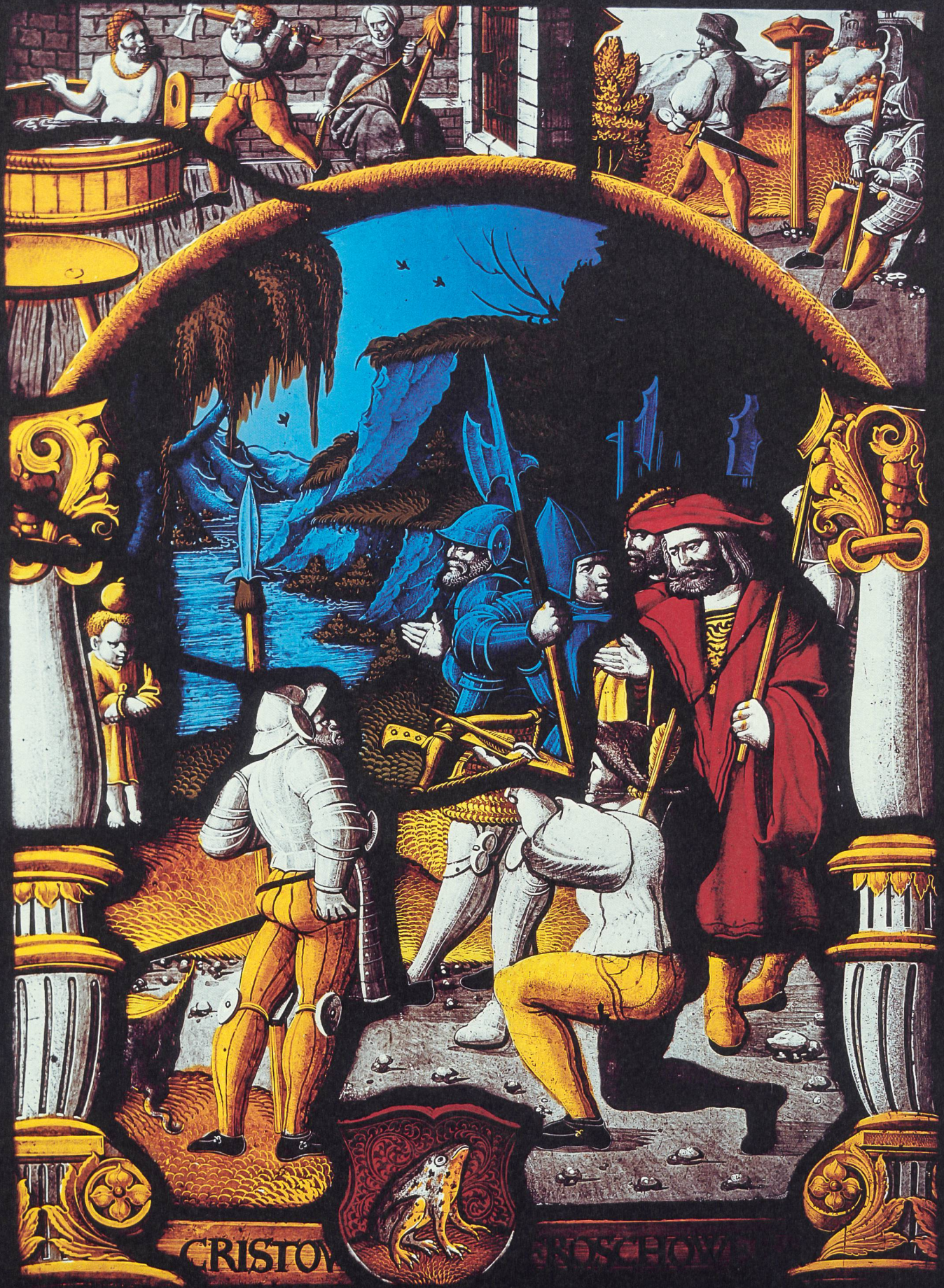
Abb. 1: Wappenscheibe aus dem Besitz des Druckers Christoffel Froschauer, um 1530 (Schweizerisches Landesmuseum Zürich, LM 13255) mit Darstellung von Tells Apfelschuss. In den Spickeln oben sind die beiden Tyrannenmörder abgebildet. Erste bildliche Darstellung von Konrad von Altzellen.