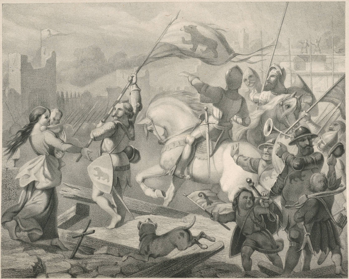
A. Leighton sculp.