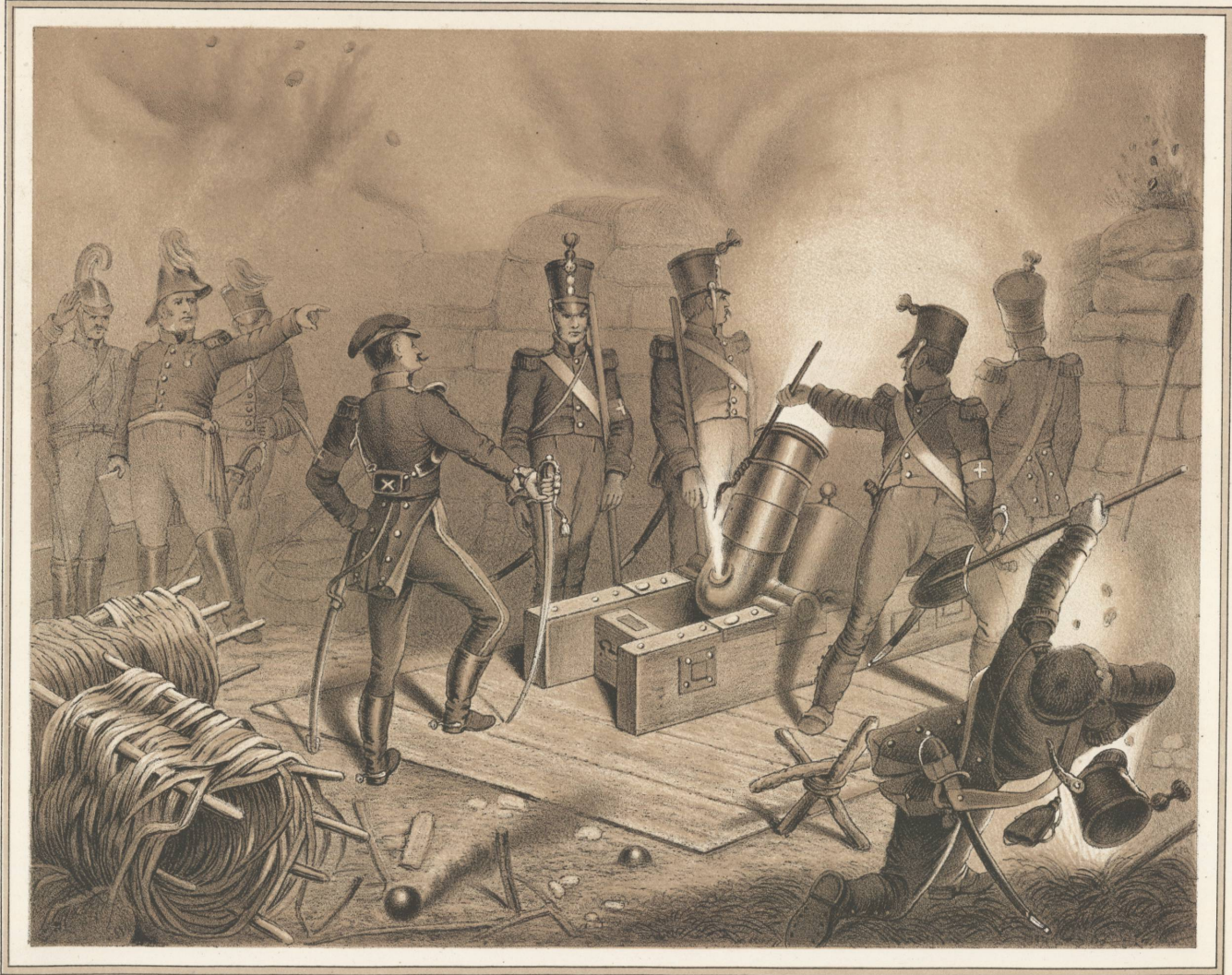
Alb. Landerer del.