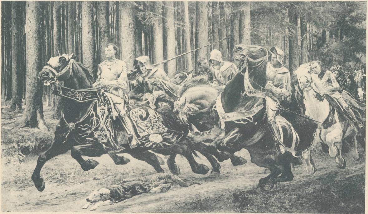
E. Burnand, peintre