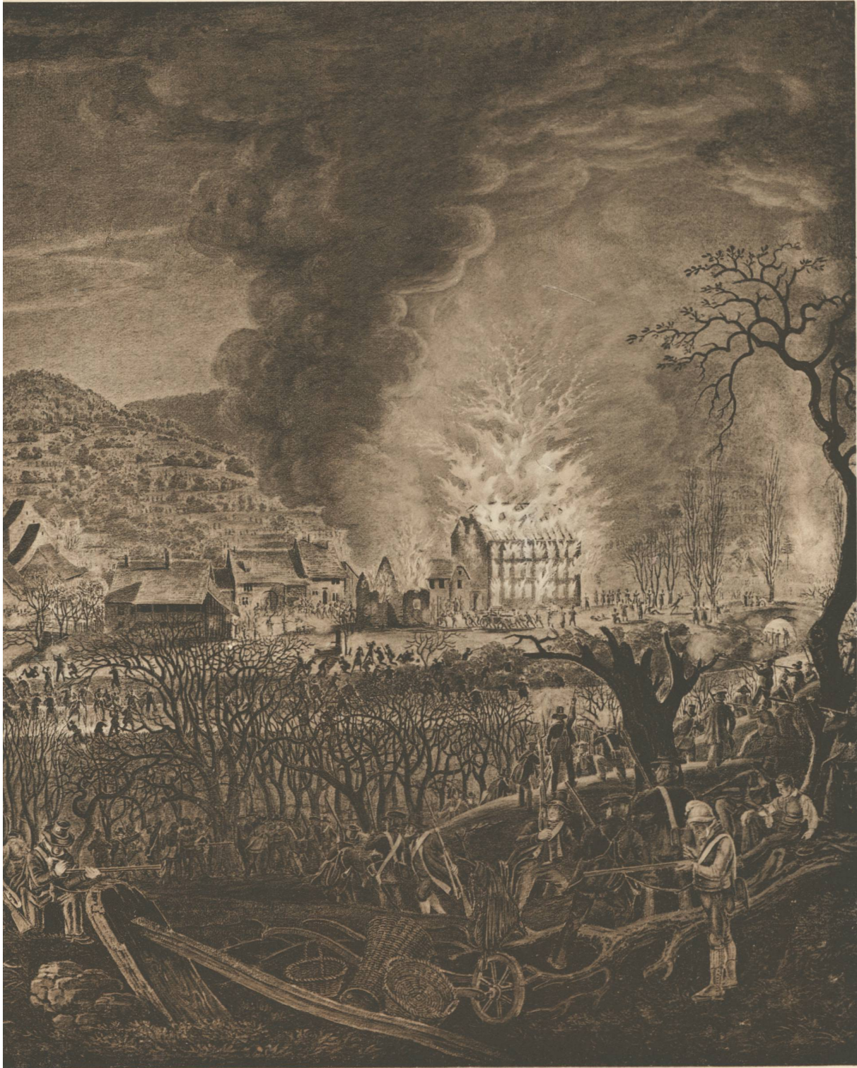
Aquarell v. J. Senn.