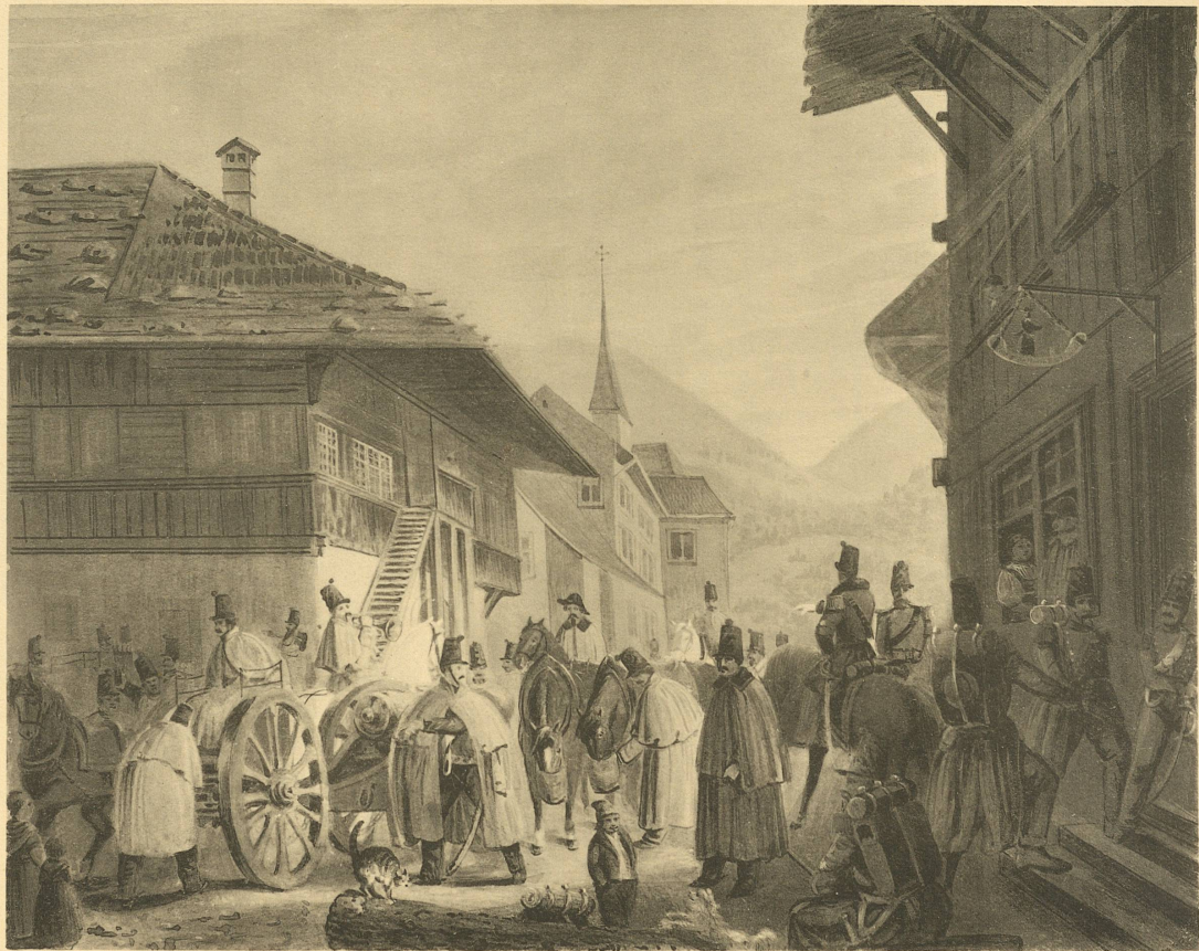
Bivouak der Basler Batterie in Kallnach am 10. November 1847. (Aus dem Besitz von Herrn Otto Stuckert in Basel.)

Lichtdruckanstalt Alfred Dittshelm, Basel.