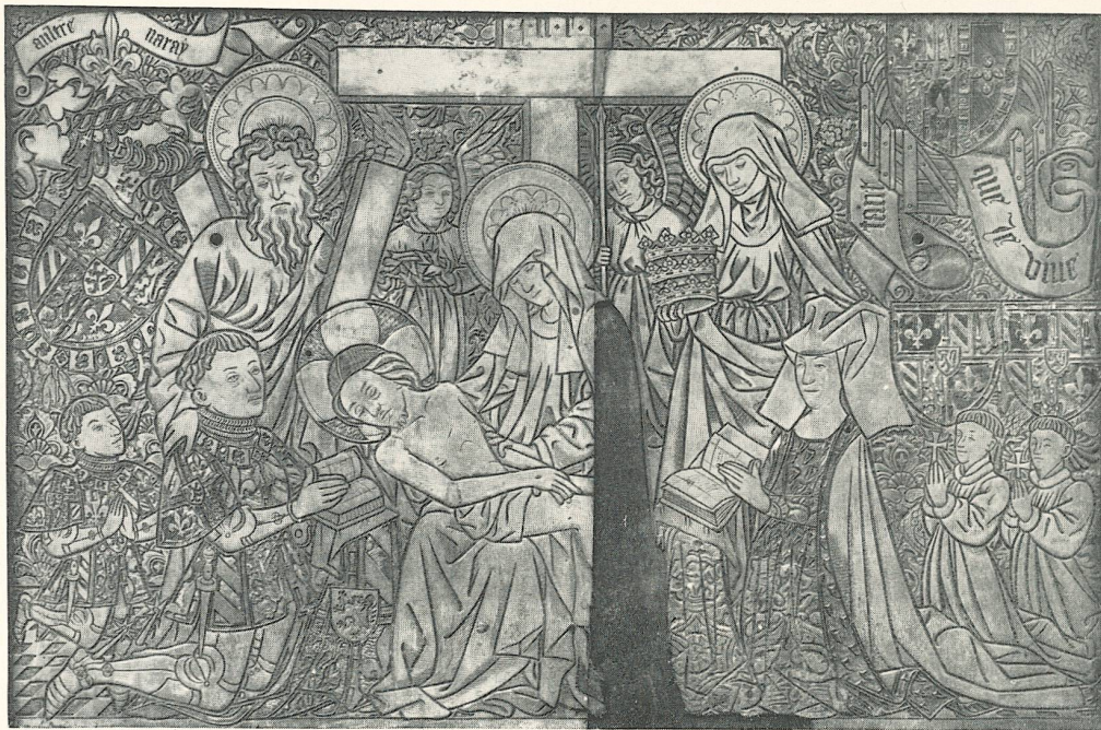
Gedenktafel der Herzogin Isabella von Burgund, 1438.