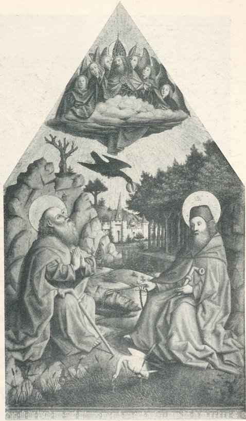
Basler Meister, Die Einsiedler Antonius und Paulus, 1445, Basel, Oeffentliche Kunstsammlung.