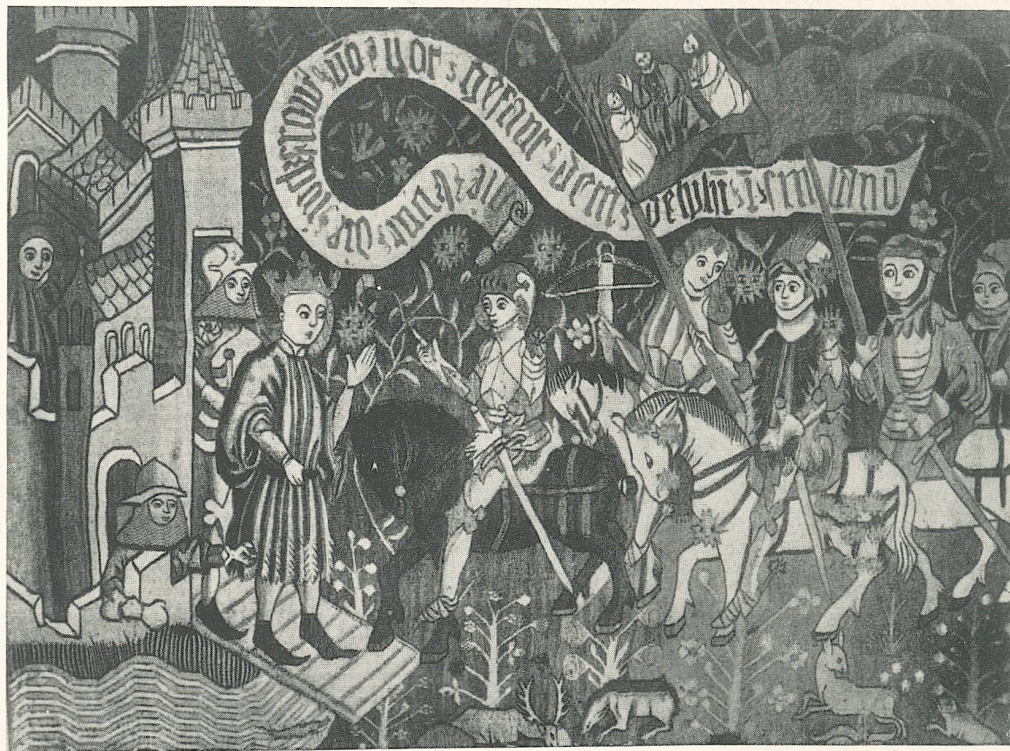
Die Ankunft der Jungfrau von Orléans beim Dauphin. Basler oder oberelsässischer Wirkteppich, um 1430. Orléans, Museum.