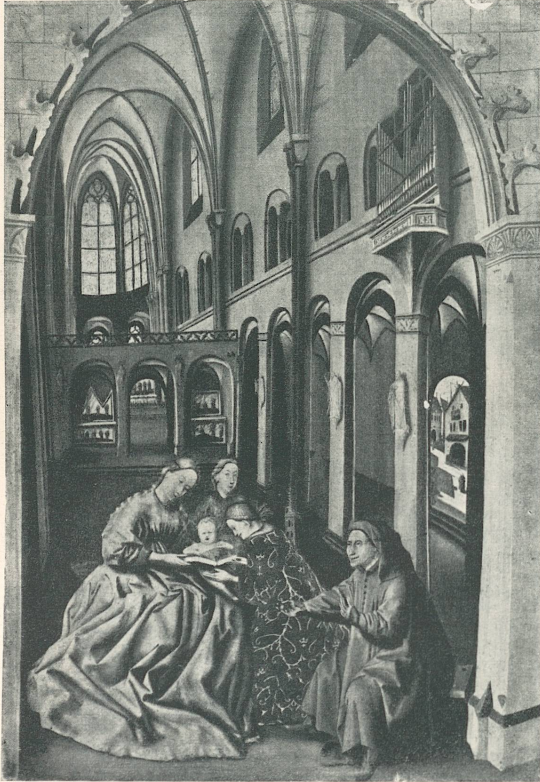
Werkstattgehilfe des Konrad Witz, Die hl. Familie im Basler Münster, Neapel, Museum.