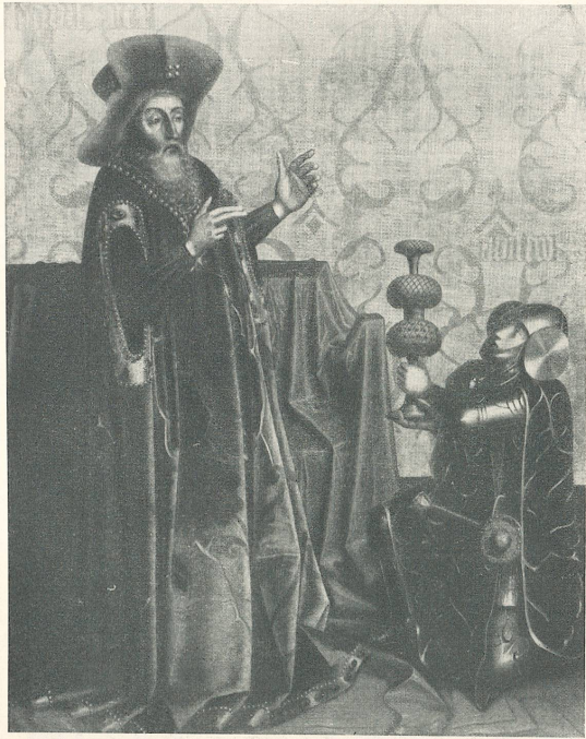
Konrad Witz, König David und die drei Helden.