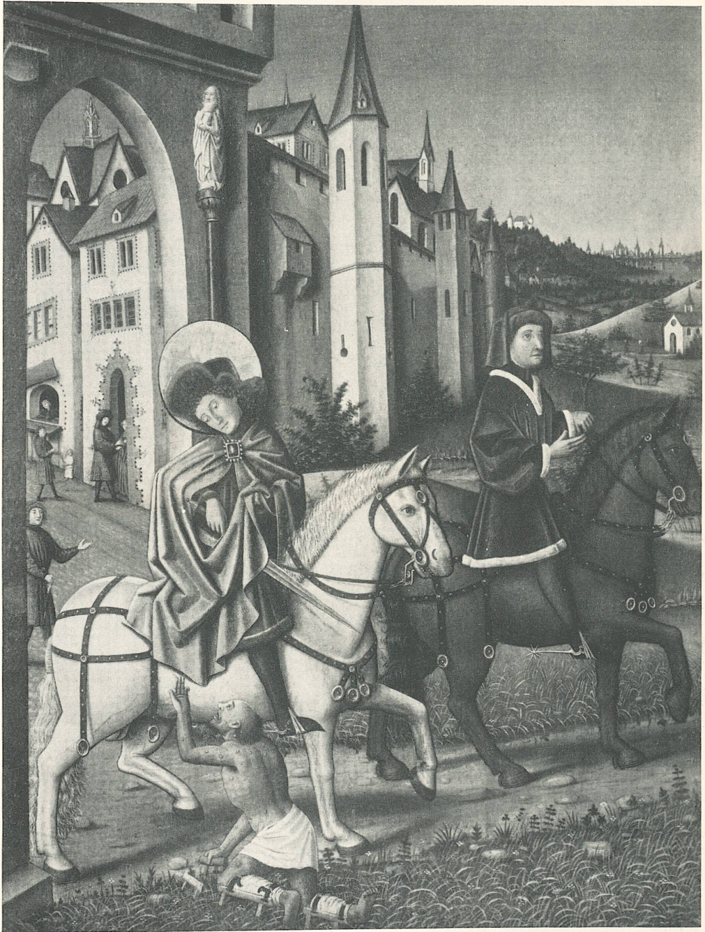
Nachfolger des Konrad Witz, Der hl. Martin.