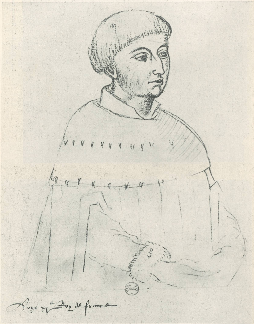
Bildnis des Dauphins, des spätern Königs Ludwig XI. Zeichnung eines niederländischen Künstlers. Paris, Nationalbibliothek.