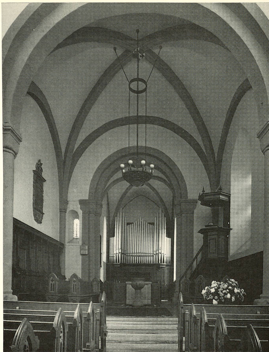
1 Chor der Kirche von Muttentz