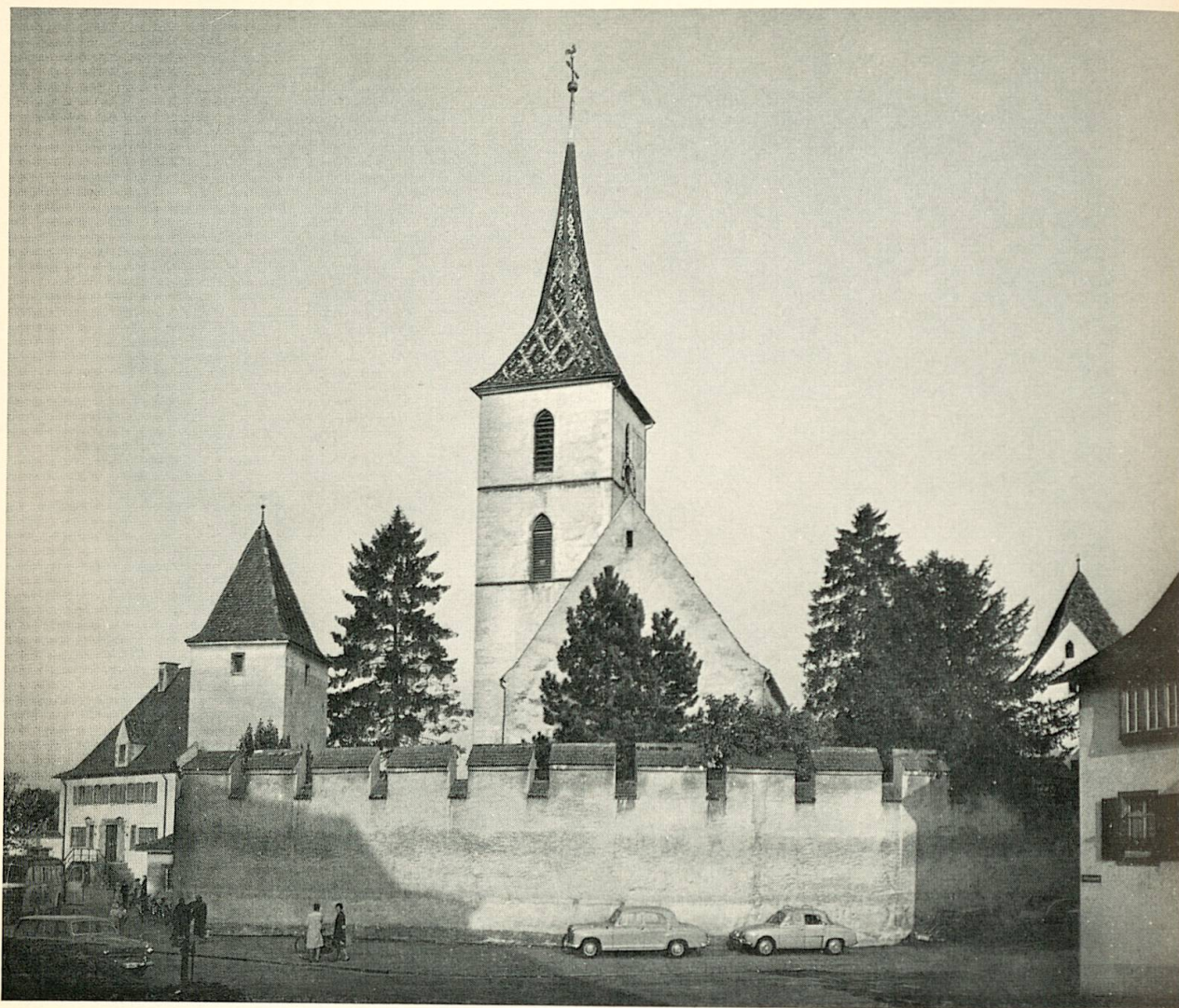
2 Kirche in MuttENZ