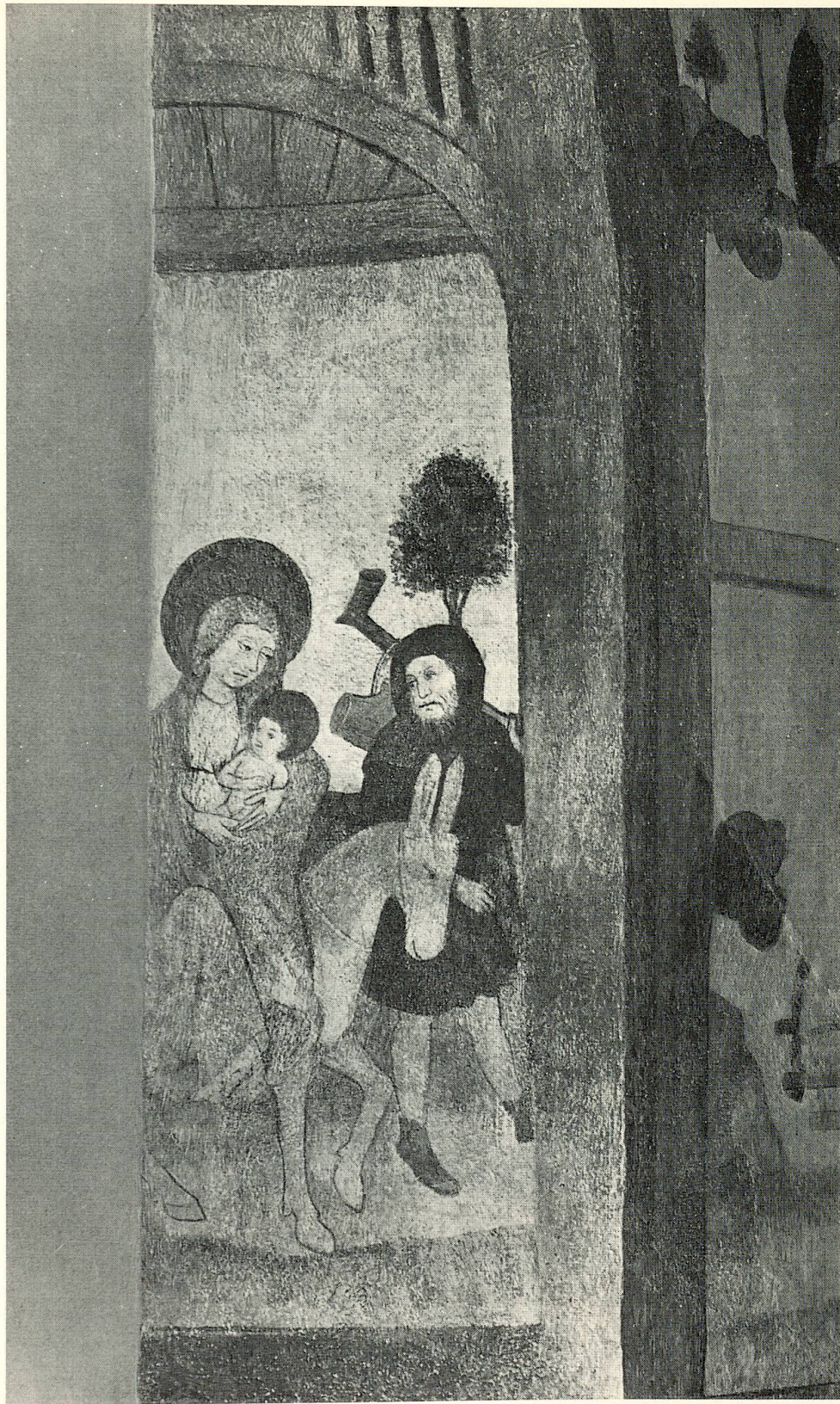
12 Wandbild in der Kirche von Oltingen