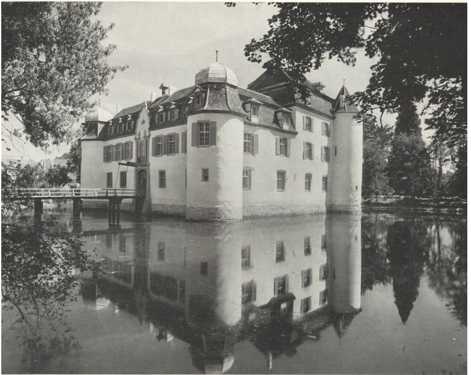
9 Schloß Bottmingen von Nordwesten