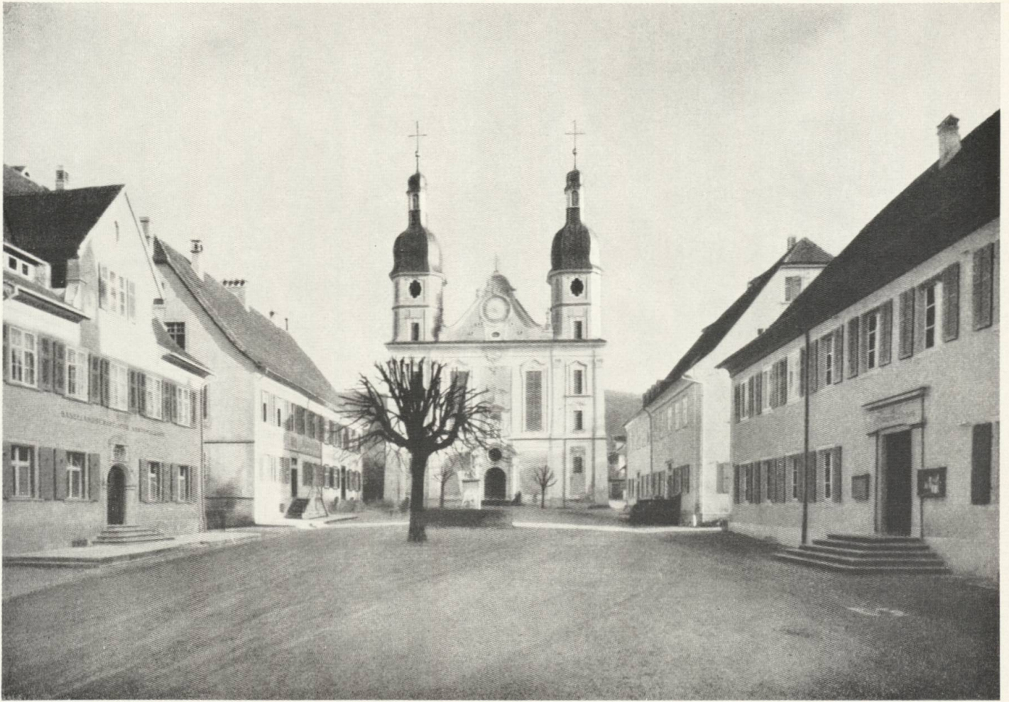
7 Domplatz in Arlesheim