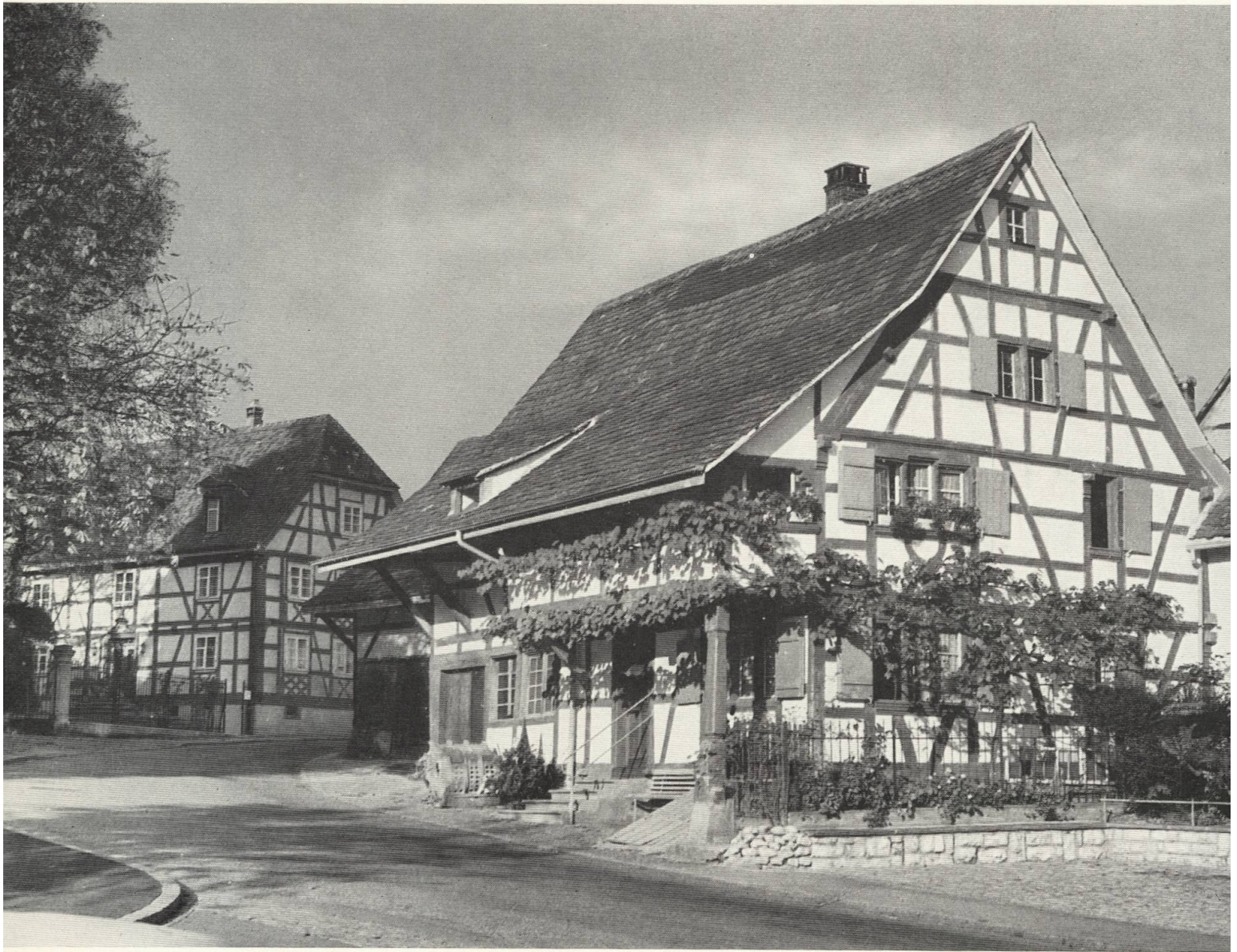
8 Alte Schmiede in Allschwil