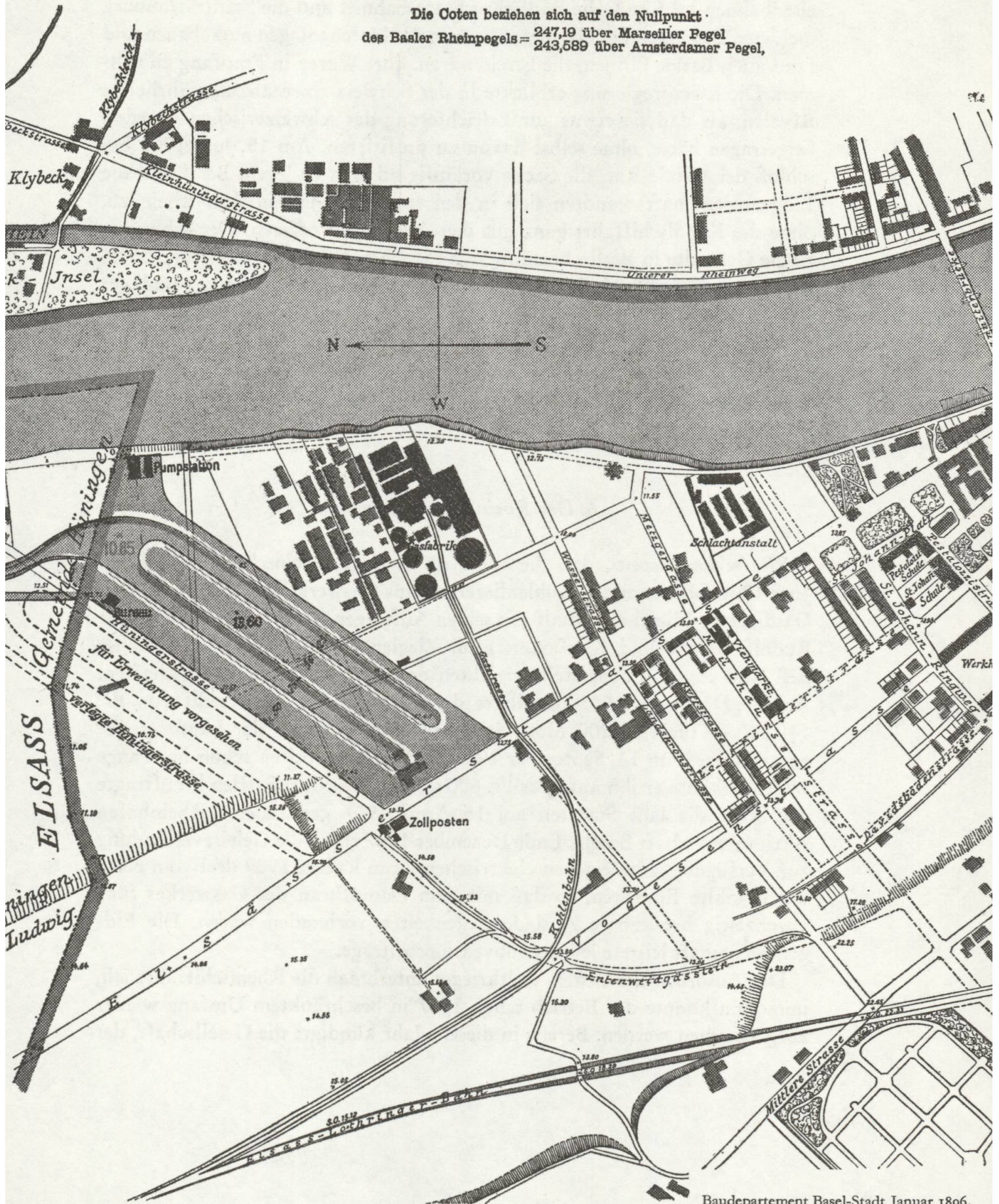
Eines der beiden Kanalhafenprojekte

Die Coten beziehen sich auf den Nullpunkt des Basler Rheinpegels = 247,19 über Marseiller Pegel 243,589 über Amsterdamer Pegel,