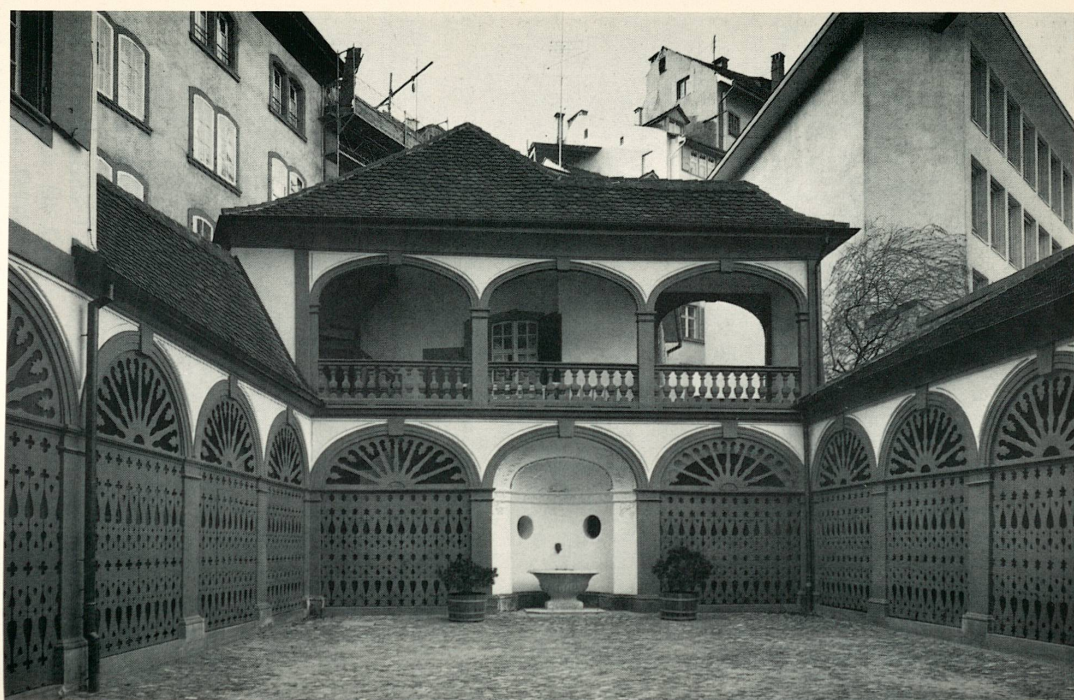
Stadthaus: Hof mit Laubengang und Brunnennische