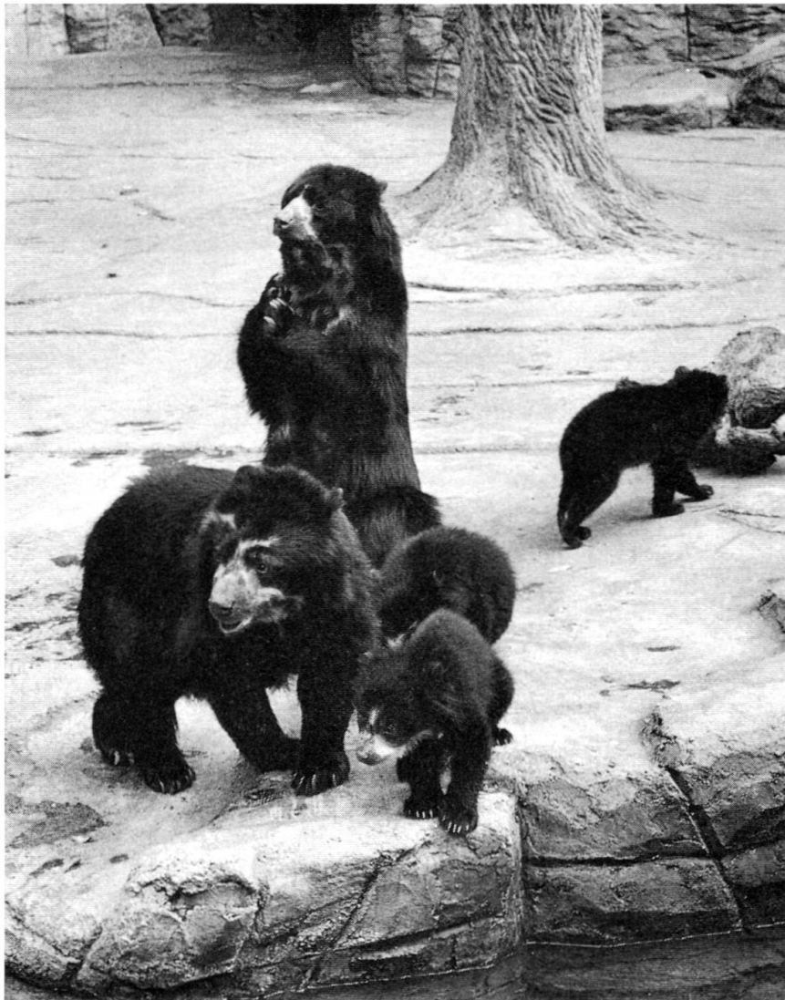
Erfolgreiche Brillenbären- Zucht: 15 Junge wurden bisher aufgezogen.

werden sollte; denn glücklicherweise konnte schon im nächsten Jahre ein Weibchen, auch aus dem Kaziranga-Reservat, Assam, bezogen werden. Zuerst wurden die beiden Tiere im alten Elefantenhaus untergebracht und sorgfältig aneinander gewöhnt. Als das neue Elefantenhaus 1953 erstellt war, zogen die beiden Tiere zunächst in dieses ein. Sie konnten regelmäßig auf der Elefantenfreianlage sein, da die 1952 importierten jungen Afrikanischen Elefanten sich sehr viel im Garten, ja sogar im nahen Allschwilerwald tummelten. Noch im Elefantenhaus kam 1956 das erste in Gefangenschaft gezeugte Panzernashorn zur Welt, das unter dem Namen «Rudra» später im Zoologischen Garten von Milwaukee erstmals für Nachzucht dieser aus-