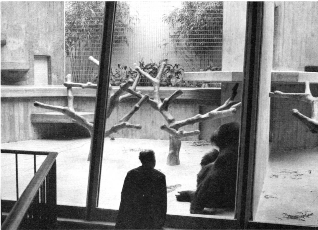
Blick in einen Gorillakäfig im neuen Affenhaus

an einer Wurmanämie und -intoxikation ein. Die gleichen Erfahrungen wurden ungefähr gleichzeitig in anderen Tiergärten gemacht. Seitdem man über wirksame Wurmmittel verfügt und durch regelmäßige Untersuchungen den Befall unter Kontrolle hält, gelingt die Aufzucht. Dies haben unsere Orang-Utans mit schöner Regelmäßigkeit bewiesen. Allerdings hatten wir nicht so viele Geburten, wie andere Tiergärten, in denen die Menschenaffenkinder meistens abgenommen und von Menschenhand aufgezogen werden. Dadurch wird die Mutter viel rascher wieder brünstig und gedeckt, als wenn sie ihr Kind säugt. Wenn eine Orang-Utan-Mutter ihr Kind selbst aufzieht, geht es in der Regel 3–4 Jahre, bis sie wieder brünstig wird.