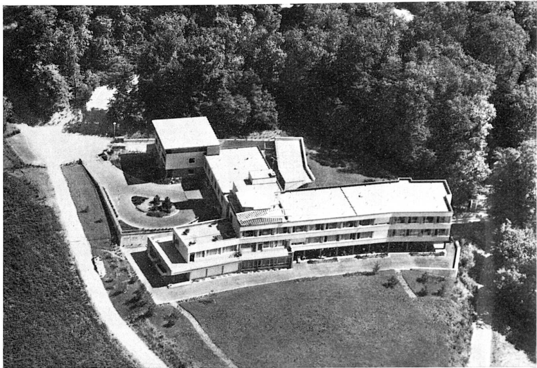
Abb. 3: Die Klinik des Bürgerspitals an prächtiger Lage auf St. Chrischona