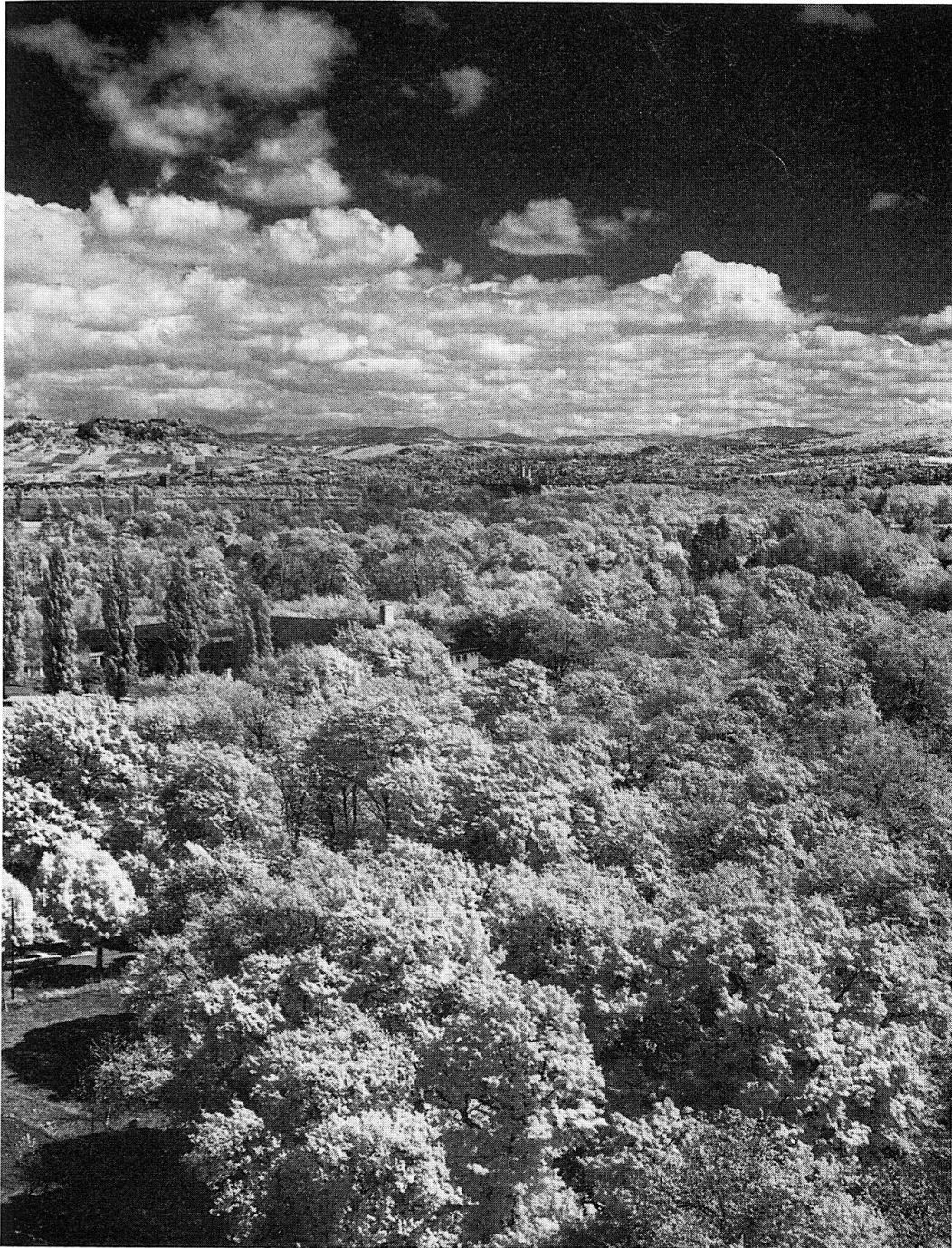
Abb. 2: Die Forstverwaltung pflegt den stadtnahen Erholungswald