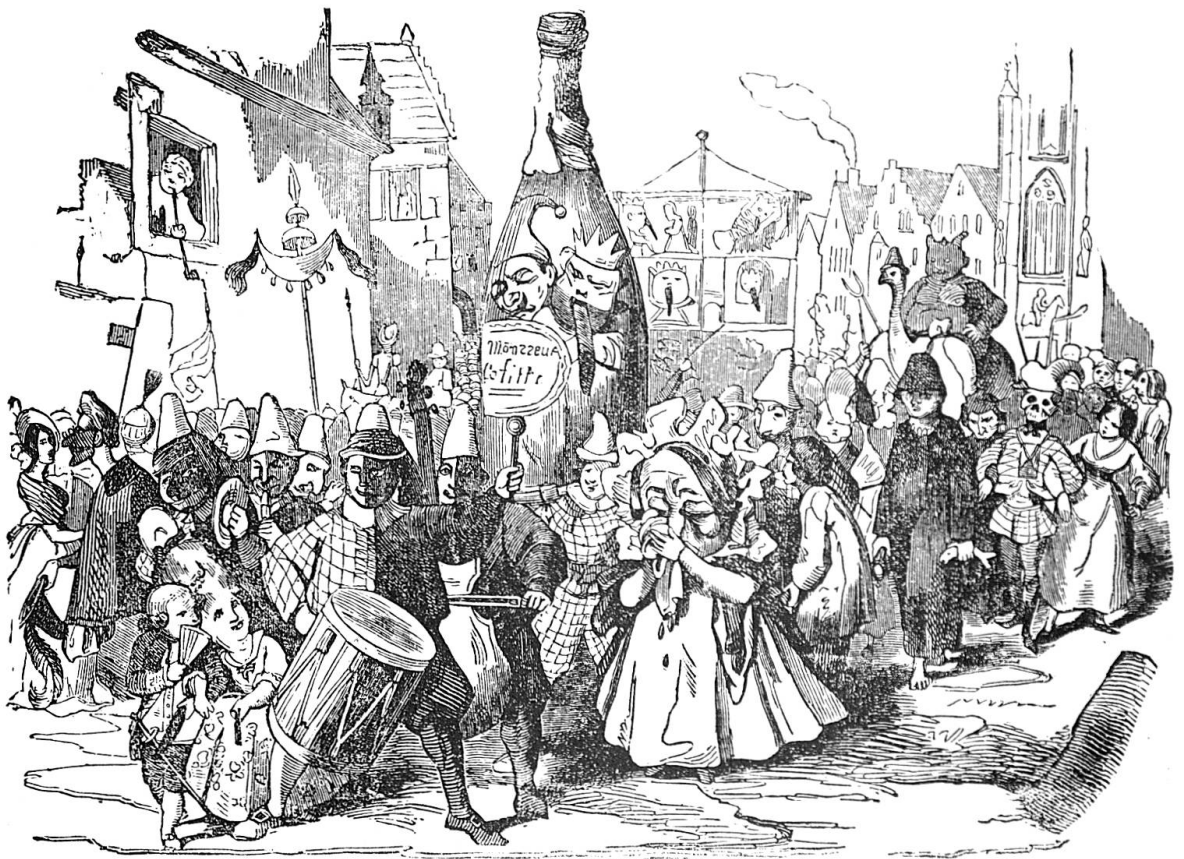
Abb. 8 Beerdigung des Lällenkönigs. Fasnachtsujet um 1840. Illustration im «Zürcher Hinkenden Bott» auf das Jahr 1845.

«Der kalte Nachtwind trieb mir ein Gemisch von Regen und Schnee entgegen. Von allen Seiten erscholl aus der Stadt ein unerhörter Lärm von Trommeln, Pfeifen und jubelnden Menschenstimmen. «Das helle Glöckchen», erläuterte mein Wirth, «ist die Faschingsglocke, sie hat seit zwei Uhr schon eingeläutet.» Jetzt liess sich von der Seite der Eisengasse ein geregelter Marsch aus dem allgemeinen Lärm heraushören. Viele starke Tritte im Sturmschritt nahten sich rasch. Der Thurm wurde an der innern Seite von hellem Fackelschein beleuchtet – das war der erste Faschingszug. Im Ganzen ein unaufhörliches Gewirre von Menschen, die sich, Grosse und Kleine, mit Stücken von Maskenanzügen, oder auch nur mit weissen Hemden und bunten Tüchern phantastisch ausstaffirt hatten. Jeder bis zu den Kindern hatte entweder eine Trommel, eine Pfeife, oder eine Fackel. Den Zug führte ein baumlanger Kerl in der Uniform eines Tambour-Majors der französischen Schweizergarde, hinter ihm kamen sechs Thiermasken mit Blasinstrumenten.