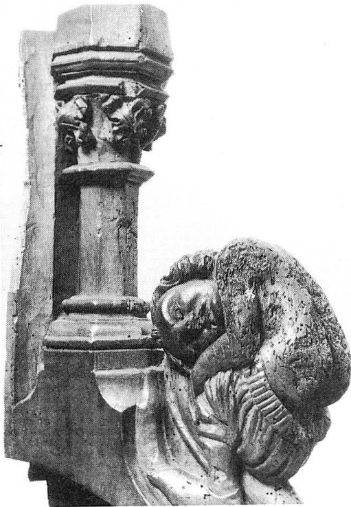
Abb. 52 Auch er zierte einst das gotische Hauptergestühl des Basler Münsters (Stadt- und Münstermuseum, Kleines Klingental).