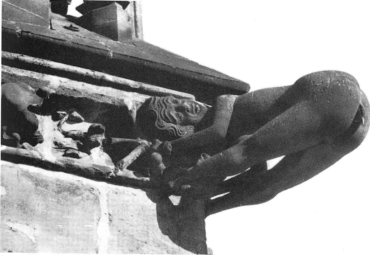
Abb. 51 Gotischer Wasserspeier am Münster zu Freiburg i.Br.

seiner Schulzeit. «Dinge-Dinge», der bereits erwähnte unvergessliche Denkmalpfleger Dr. Rudolf Riggensch, zeigte der Klasse im Stadt- und Münstermuseum eine kleine, vom Holzwurm arg zerfressene Statuette aus dem mittelalterlichen Münster-Chorgestühl. Jene, die ihre Nase zuvorst hatten, erkannten bald, dass die Figur einen jungen Mann in unmissverständlicher Hocke darstellt. Das Grinsen der Bubenschar verwandelte sich in helles Gelächter, als sich Riggensch vernehmen liess: «Dinge-Dinge, hehe, y glaub, dä schysst!» (Abb. 52).