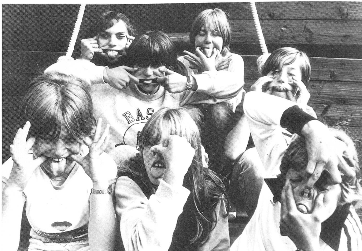
Abb. 54 Nicht nur die Surseer, auch Basler Kinder verstehen sich aufs «Zännen».

dere verspotten und beschimpfen kann, etwas, das man nicht tun darf, und das von den Grossen möglichst schnell wegezogen wird – es sei denn, man sei ein Surseer Kind beim fasnächtlichen «Chäs-zännen», wo man fürs Grimassenschneiden noch prämiert wird (Abb. 54). Die andern können sich mit Ansteckknöpfen behelfen. Bei einigen Teenagern ist eine Art Marilyn Monroe-Mund mit üppiger roter Zunge Trumpf, das Signet der «Rolling Stones». Dass dieses Symbol die besagte Gebärde ersetzen könnte, ist den wenigsten bewusst, nicht einmal den Knopf-Verkäufern.