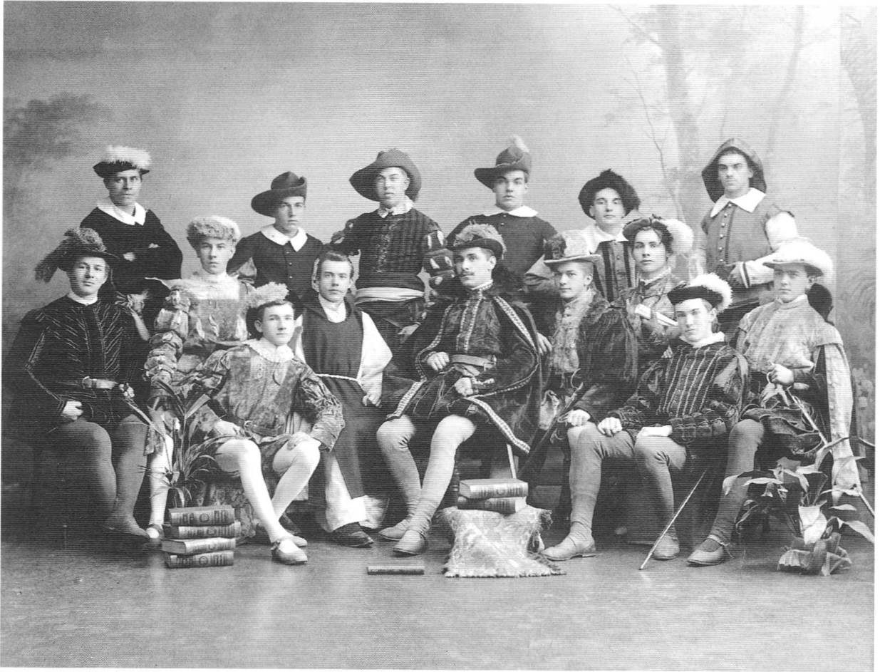
Die Sektionen des Jünglingsvereins St. Clara deckten wohl fast den ganzen Freizeitbereich eines jungen Katholiken ab. Auf der vermutlich um 1907 gemachten Aufnahme ist die Theatersektion zu sehen.