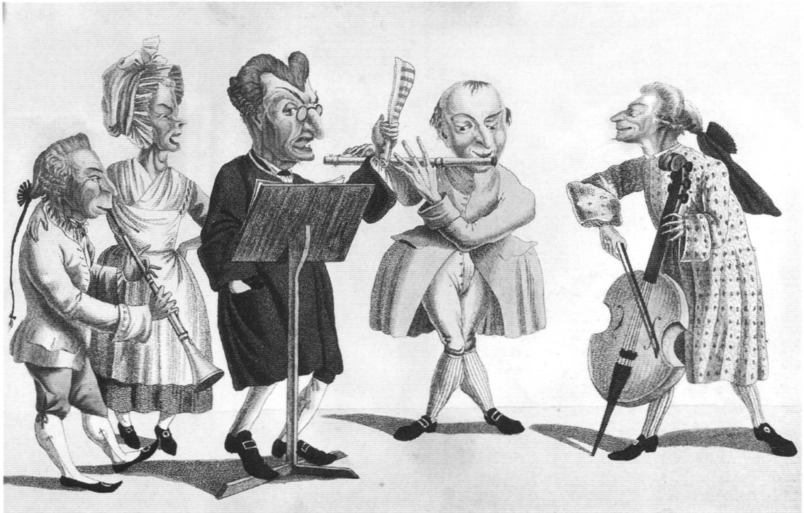
Abb. 10. Franz Feyerabend: Gruppe von Musikerfiguren aus dem Blauen Haus [?]; Aquatinta; vgl. Kap. IV. 9. mit Anm. 54.