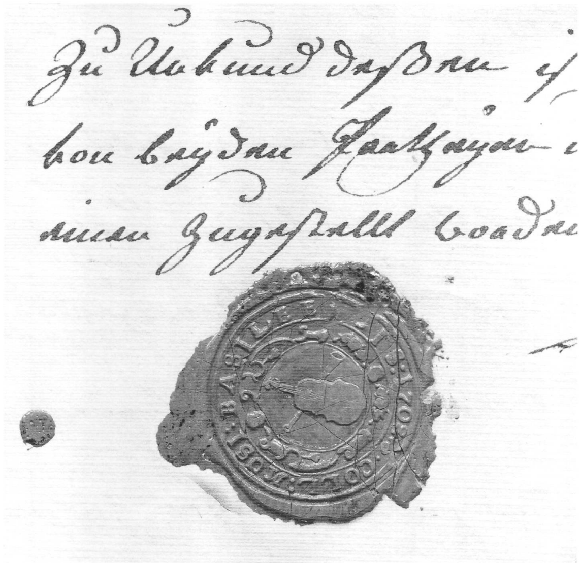
Abb. 8. Abdruck des Siegels des Basler Collegium Musicum; vgl. Kap. IV. 2. mit Anm. 13.

sich Dilettanten und, im Laufe des 18. Jahrhunderts zur Regel werdend, auch einige wenige Berufsmusiker zusammen. Das musikalische Repertoire dürfte häufig, wenn auch keineswegs ausschließlich, Instrumentalmusik gebildet haben; leider werden in den Akten nur im Jahre 1711 die L'estro armonico betitelten Konzerte Antonio Vivaldis genannt 14 .