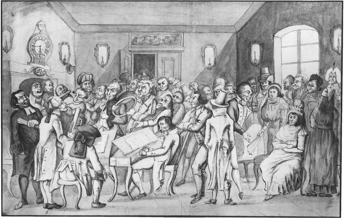
Abb. 12. Emanuel Burckhardt-Sarasin: Konzert des Basler Collegium Musicum; lavierte Tuschezeichnung.