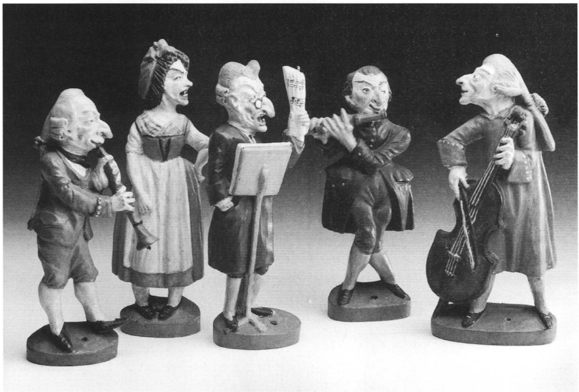
Abb. 11. Anton Sohn: Musikerfiguren aus dem «Kleinen Orchester» (Zizenhauser Figuren), nach der Vorlage Feyerabends, vgl. Abb. 10.