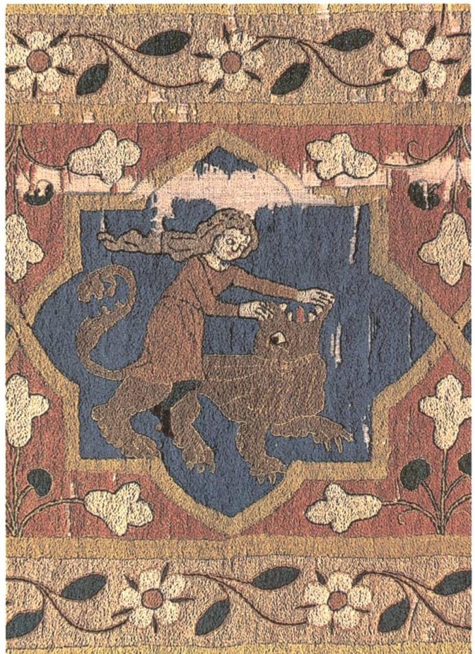
Abb. 85 Daneben kommt es auch zum Kampf zwischen Mensch und Tier (4-w-8).

Abb. 89 Ein stilistisch ähnlich ausgeführtes Motiv vom Kampf Samsons mit dem Löwen findet sich auf dem Malterer Teppich, wo Samson ebenfalls mit wehendem Haar und knielanger Bekleidung dem Löwen von hinten an den Rachen greift. Malterer Teppich, Augustinermuseum, Freiburg i. Br., Wollstickerei auf Leinen, 67,5 × 491 cm.