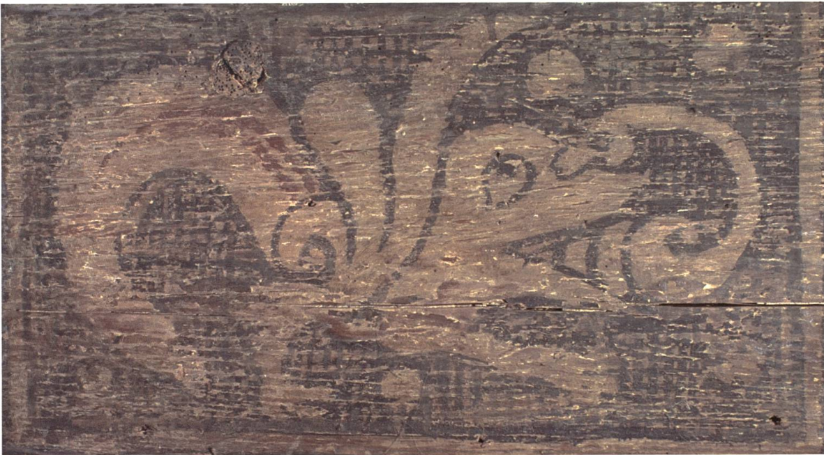
Amphisbaene (4-o-14). Bei der Amphisbaene im «Schönen Haus» sitzt der zweite Kopf auf dem gewundenen Hals, schnell aus dem Maul des Tieres hervor und beisst es in die Nase. Wie es der griechische Name verrät, ist die Amphisbaene imstande, vorwärts und rückwärts zu kriechen, was als doppelte Bosheit oder auch als Klugheit gedeutet wurde.