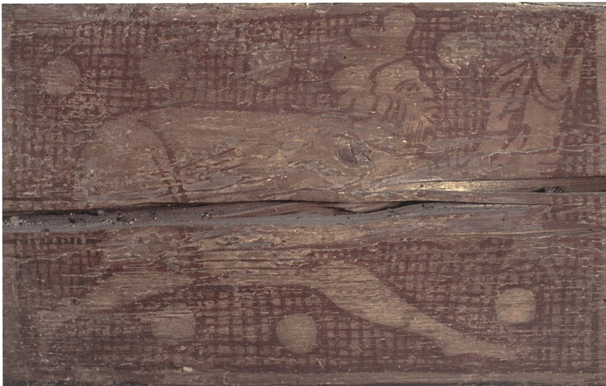
Fischesser (4-w-1). Die Fischesser ähneln den Menschen schon eher. Dargestellt werden sie meist mit einem Fisch in der Hand.