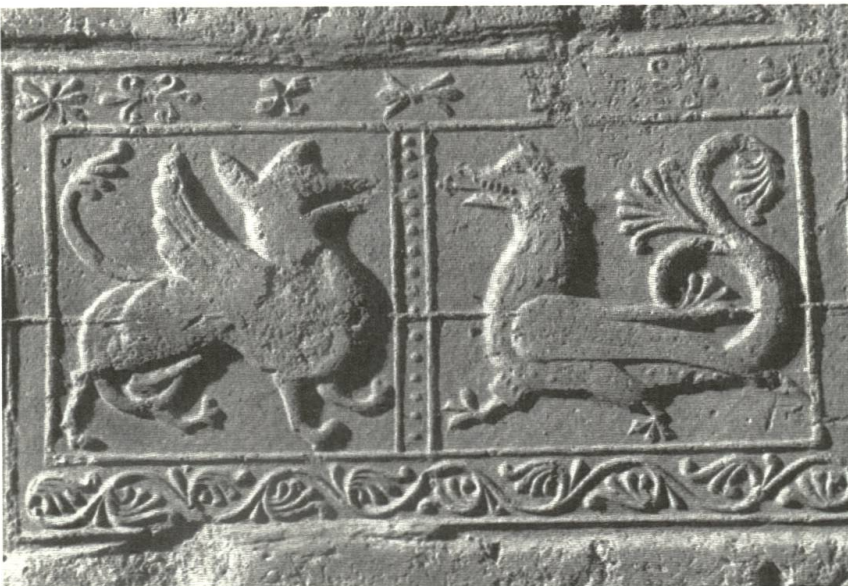
Ritter, Adler und Sirenen waren besonders beliebte Motive – auch in der Baukeramik. Dies belegen Beispiele, welche zwischen 1250 und 1280 in der Backsteinfabrik von St. Urban (LU) produziert wurden und den figürlichen Pendants im «Schönen Haus» stilistisch ähneln.