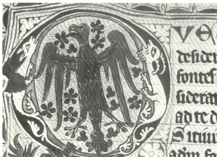
Abb. 92/93 Motivische Bezüge ergeben sich durch die Drolerien, die meist als Marginalien und Initialen in der Buchmalerei auftauchen. Ein figürliches Initialornament aus einem Engelberger Nonnenpsalter aus dem 2. Viertel des 14. Jahrhunderts illustriert ein ähnliches Nebeneinander von grotesken und heraldischen Tiermotiven. Nebst der Hintergrundschraffur und den sich darauf befindenden Blumen entspricht der Adler auch stilistisch demjenigen der Balkenmalereien (9-w-11). Initiale des Engelberger Nonnenpsalters. Engelberg, Stiftsbibliothek, Cod. 60, fol. 60.