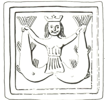
Abb. 94/95 In der Ruine Bischofstein in Sissach wurden Ofenkacheln gefunden, deren Motive denjenigen der Balkenmalereien im «Schönen Haus» entsprechen.