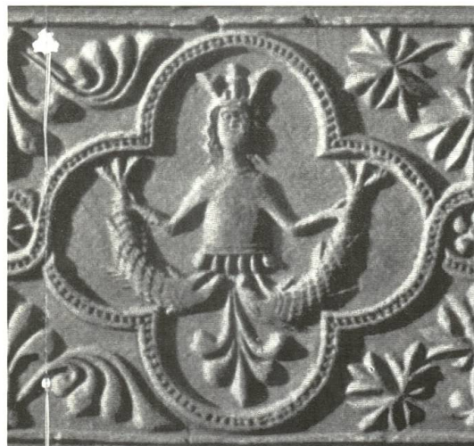
Abb. 103 Sirene in Vierpass. Als weiteres Vergleichsbeispiel vereint dieses Exemplar aus St. Urban alle genannten Elemente miteinander: Fischschwänze, Krone und langes, gewelltes Haar.