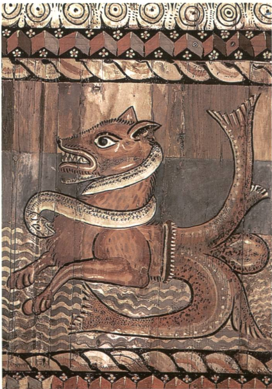
Abb. 90 «... denn die, die aussen sind, wird Gott richten» (1. Kor 5,12). Die Monster an der Holzdecke in St. Martin in Zillis folgen einem Leitmotiv, und zwar erscheinen diese sich in der Randzone befindlichen Wesen als äusserst bedrohlich, so dass es für jeden, der das sichere Innere (Heilsgeschichte) verlässt, zu schlimmen Folgen führen könnte.