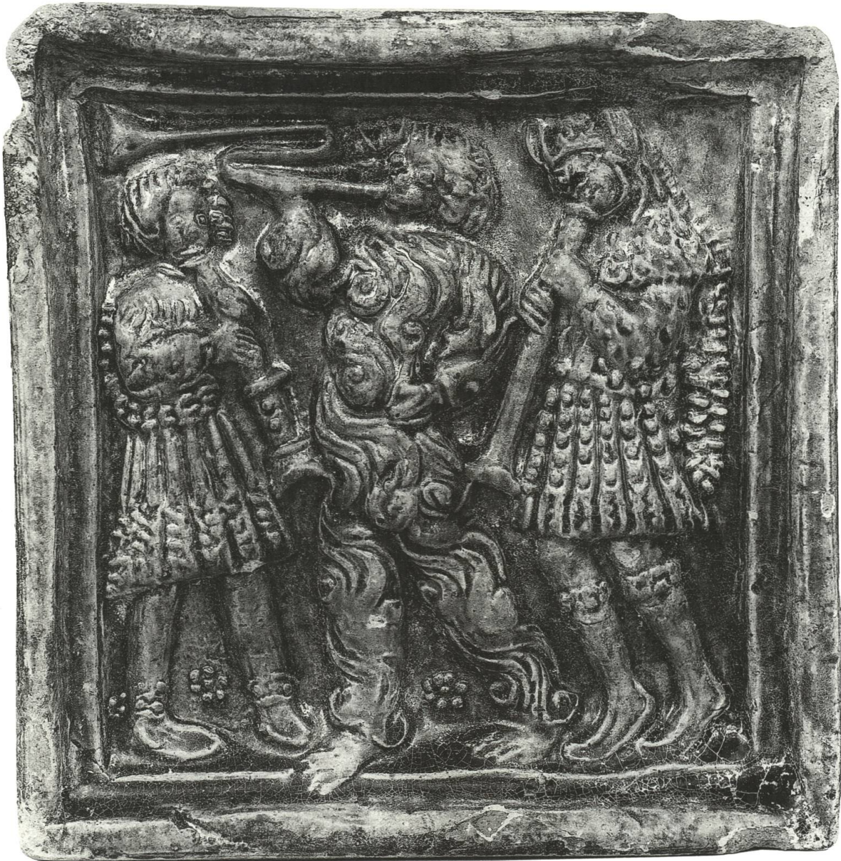
Abb. 11 Grün glasierte Ofenkachel mit fasnächtlich anmutenden Figuren (Basel, Mitte 15. Jh.). Es handelt sich um die früheste bekannte Bilddarstellung fasnächtlicher Maskengestalten aus dem Basler Raum.

Der Ausdruck « in Göler wise » kommt in den Quellen, und auch dann nur in denen vor der Reformation, immer im Zusammenhang mit anderen Ausdrücken des Verkleidens vor: «dz niemand jn Böcken wise noch in Göler wise oder in tufels hüten louffen sölle noch sich verendere jn dhein wise noch wege mit den kleidern» («dass niemand in Bocks- oder Narrenweise, oder in Teufelhäuten, herumlaufen oder sich in einer anderen Weise verkleiden soll») 71 , «daz niemand in tufelß hütten noch in gölers wise louffen solle noch in Böcken wise gan oder sich jn dehein andere wise mit kleidern verenderen» («dass niemand in Teufelhäuten, in Narren- oder Bocksweise herumgehen oder sich in einer anderen Weise verkleiden soll») 72 , «dz nyemand weder tages noch nachtes in Bocken wise in Goler oder tufels hutten gan oder uber und uber louffen solle» («dass niemand, weder tags noch nachts, in Bocks-