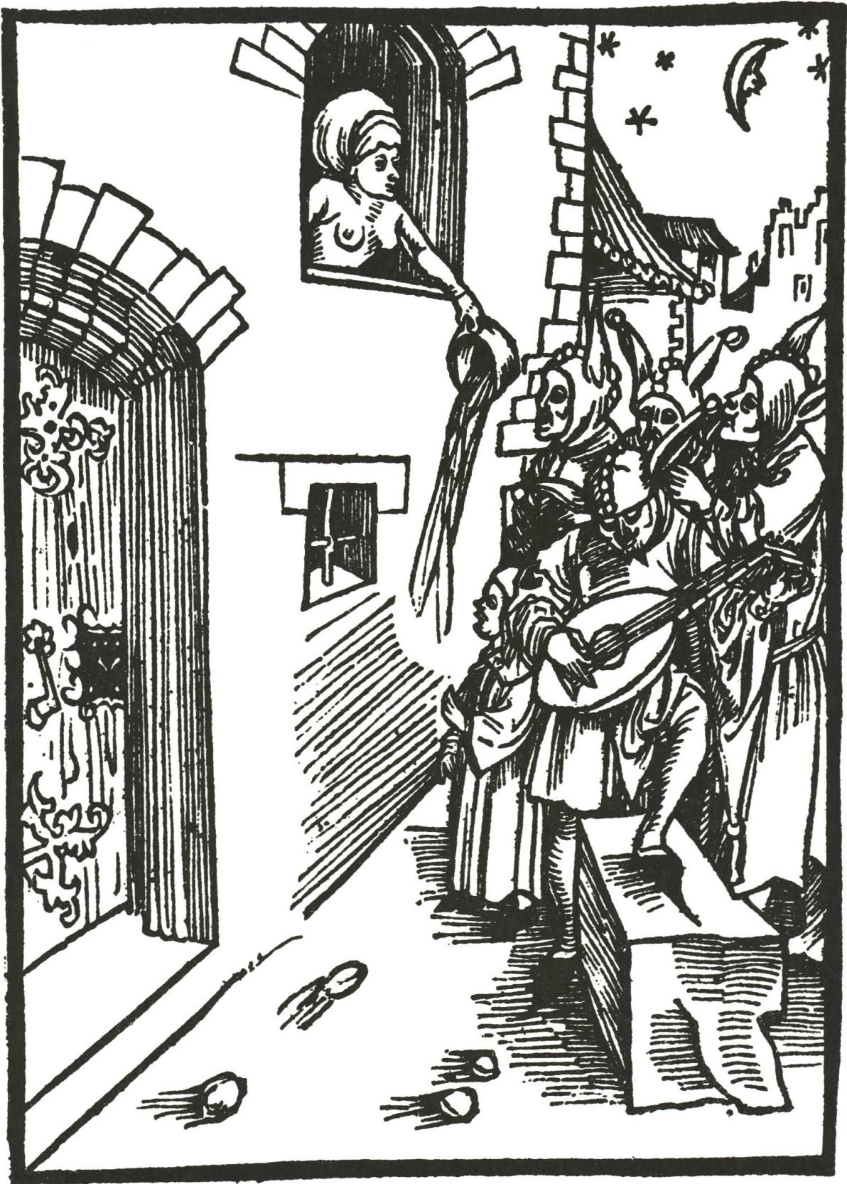
Abb. 19 Eine Anwohnerin setzt sich gegen die Lärmbelästigung durch fasnächtliche Narren zur Wehr.