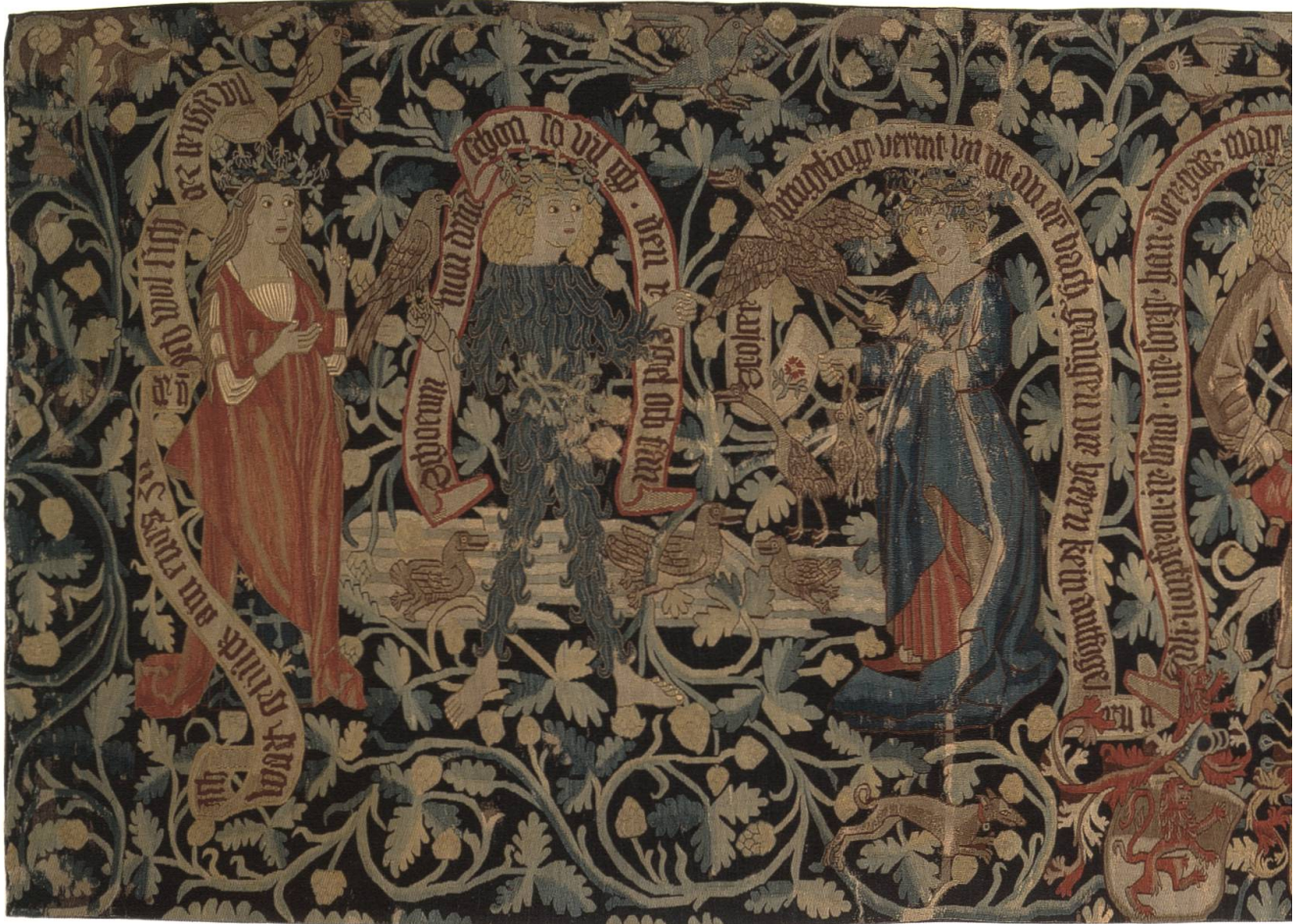
Abb. 9 Wirkteppich mit Edelleuten und Wildleuten auf der Falkenjagd, Basel 15. Jh. Schön zu erkennen sind die zum grossen Teil von Pelz bedeckten Körper der Wildleute.

kleidung gehandelt haben muss. Wenn wir uns über das « Idiotikon » dem Ausdruck nähern, stellen wir fest, dass damit ein Ziegenbock gemeint war: « Bock », bzw. « Bogg », Pl. « Böck ». 62 Dies macht durchaus Sinn, denn Tiermasken spielten bei Maskentreiben schon immer eine Rolle. 63 Wie man weiss, wurde der Teufel in Bildquellen oft mit den Hörnern und dem Bart eines Ziegenbocks dargestellt, was sich aus der mittelalterlichen Theorie der Tierallegorien ergab. Der Ziegenbock wurde dabei mit Unkeuschheit, Geilheit in Verbindung gebracht, einer Eigenschaft, welche sich auch auf den Teufel übertragen lässt. 64 Also könnte « in Bökenwise » wohl eine Teufelsmaske meinen, die vielleicht ursprünglich aus einer reinen Bocksmaske entstanden war.