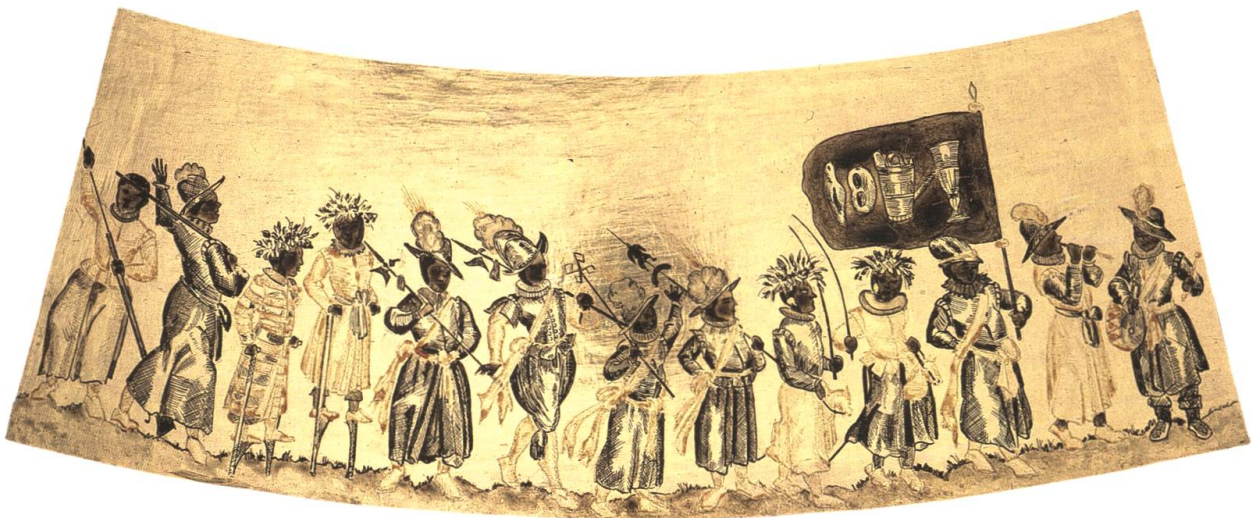
Abb. 18 Heischezug aus dem 17. Jh. im Innern eines Bierhumpens.