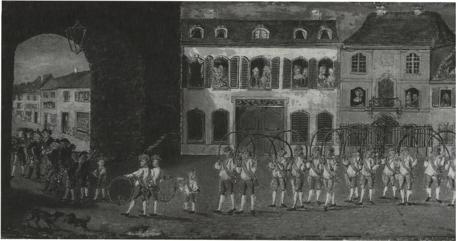
Abb. 27 Küferumzug.