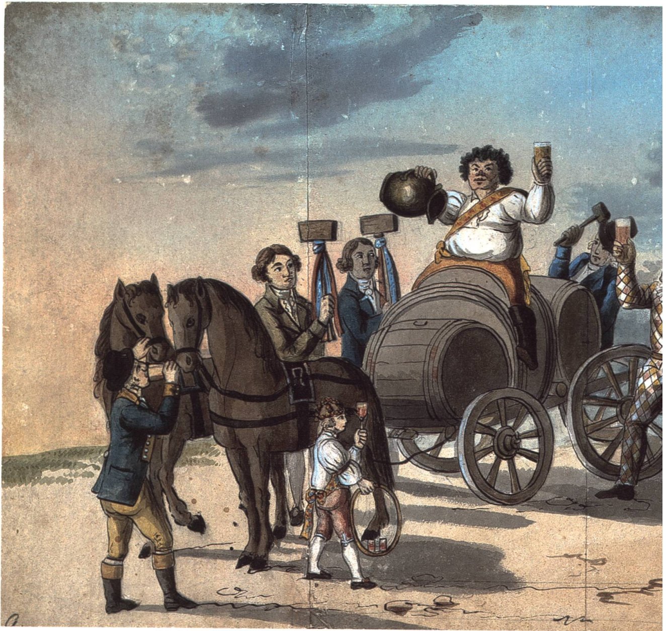
Abb. 20 Küfertanz.

allegorischem Charakter (Schlitten, Fass), die durch die Strassen geschleppt oder gestossen werden. Wie wir oben schon gesehen haben, war der Schlitten eines der typischen Fahrzeuge des Narren; was es aber mit dem Fass auf sich hat, muss hier näher erklärt werden. Im Zusammenhang mit dem Ursprung der Fasnacht werden die römischen Bacchanalien, ein Fest zu Ehren des römischen Weingottes Bacchus, fälschlicherweise auch immer wieder angeführt. Der Grund dafür liegt wohl darin, dass an der Fasnacht der exzessive Weinkonsum eine grosse Rolle spielte und man daraus auf den Zusammenhang zu den Bacchanalien schloss. 139 Jedenfalls hielt sich diese Annahme lange, was dazu führte, dass man auf Bildern die als Person dargestellte Fasnacht oft auf einem Weinfass reitend abbildete. 140