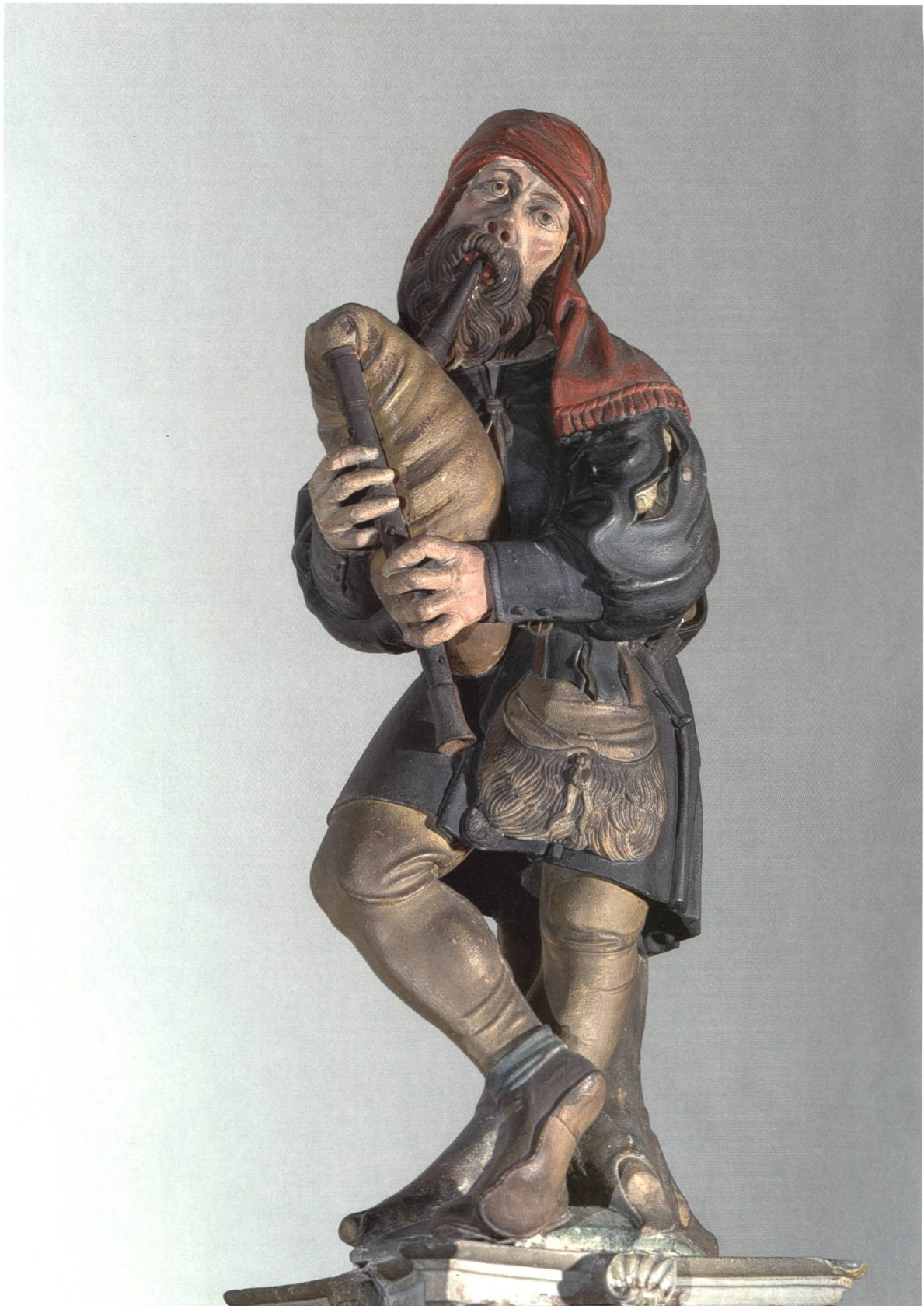
Abb. 32 Dudelsackpfeifer vom Brunnenstock des Holbeinbrunnens – auch Sackpfeiferbrunnen genannt (16. Jh.).