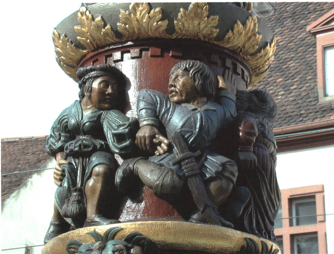
Abb. 26 Bauerntanz. Detail vom Holbeinbrunnen in der Spalenvorstadt (16. Jh.).