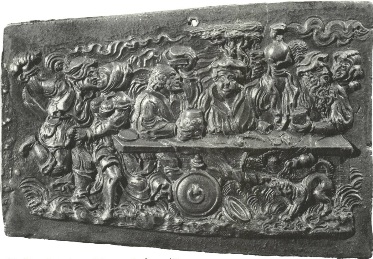
Abb. 25 Festgelage mit Fressen, Saufen und Tanzen. Fasnächtliches Detail: Narr am rechten Bildrand.