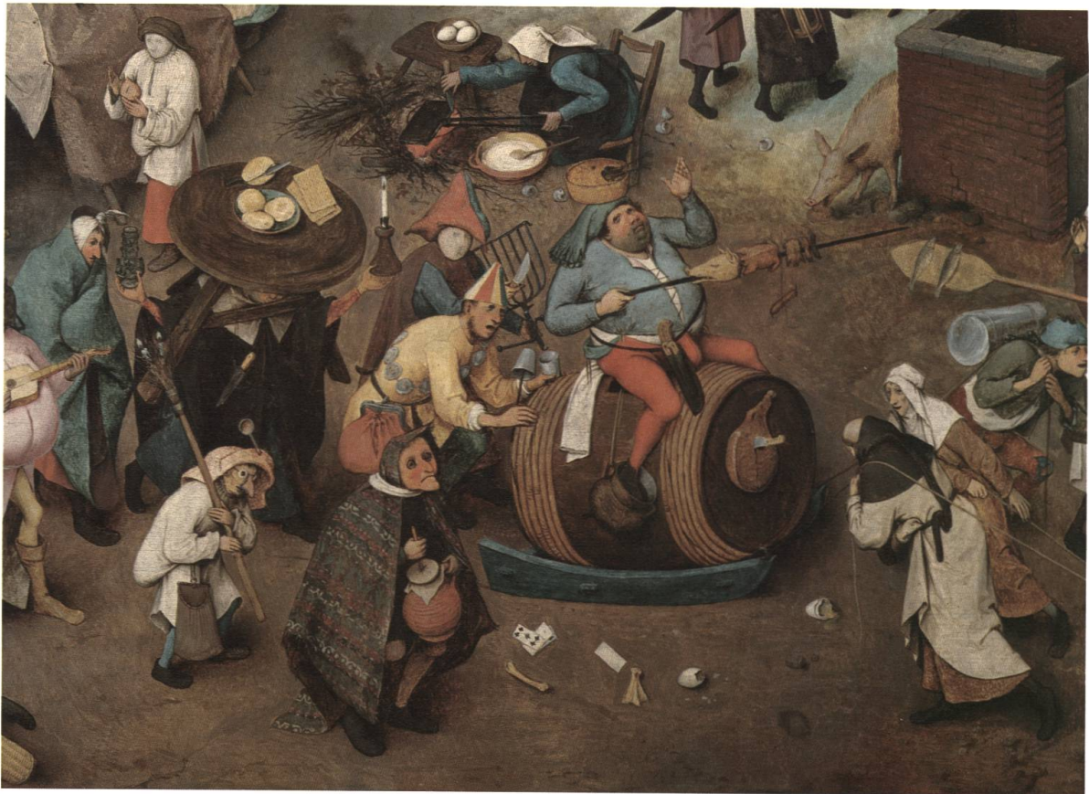
Abb. 29 Ausschnitt aus Der Streit des Karnevals mit den Fasten – Prinz Karneval wird von Vermummten begleitet.

An der Fasnacht sind Turniere in Basel seit dem 14. Jahrhundert belegt, wie auch die Böse Fasnacht von 1376 bestätigt. Nach der Reformation finden wir in den Quellen keine Einträge zu Turnieren mehr.