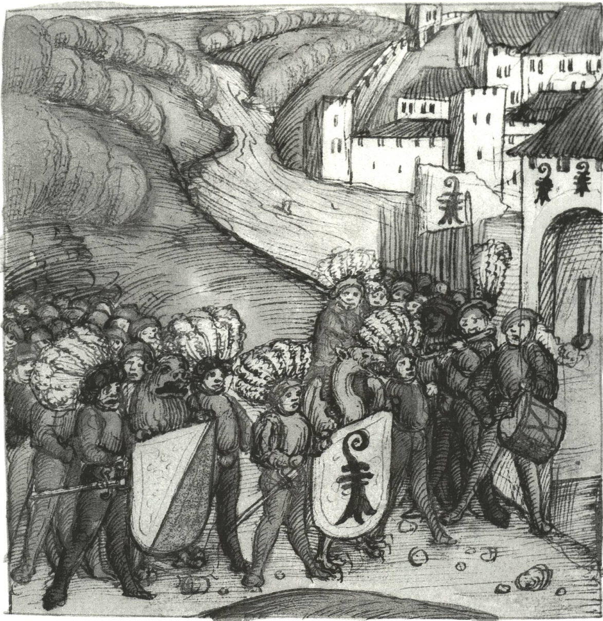
Abb. 17 Besuch der Zürcher an der Basler Fasnacht 1504. Empfang vor dem Stadttor. Die Schildhalter treten als Maskenfiguren (Löwe und Basilisk) auf.

Im Laufe der Zeit entwickelte sich das Küechliholen, besonders im städtischen Raum, zu geselligen Einladungen und Festen, bei welchen auch andere Lecke-