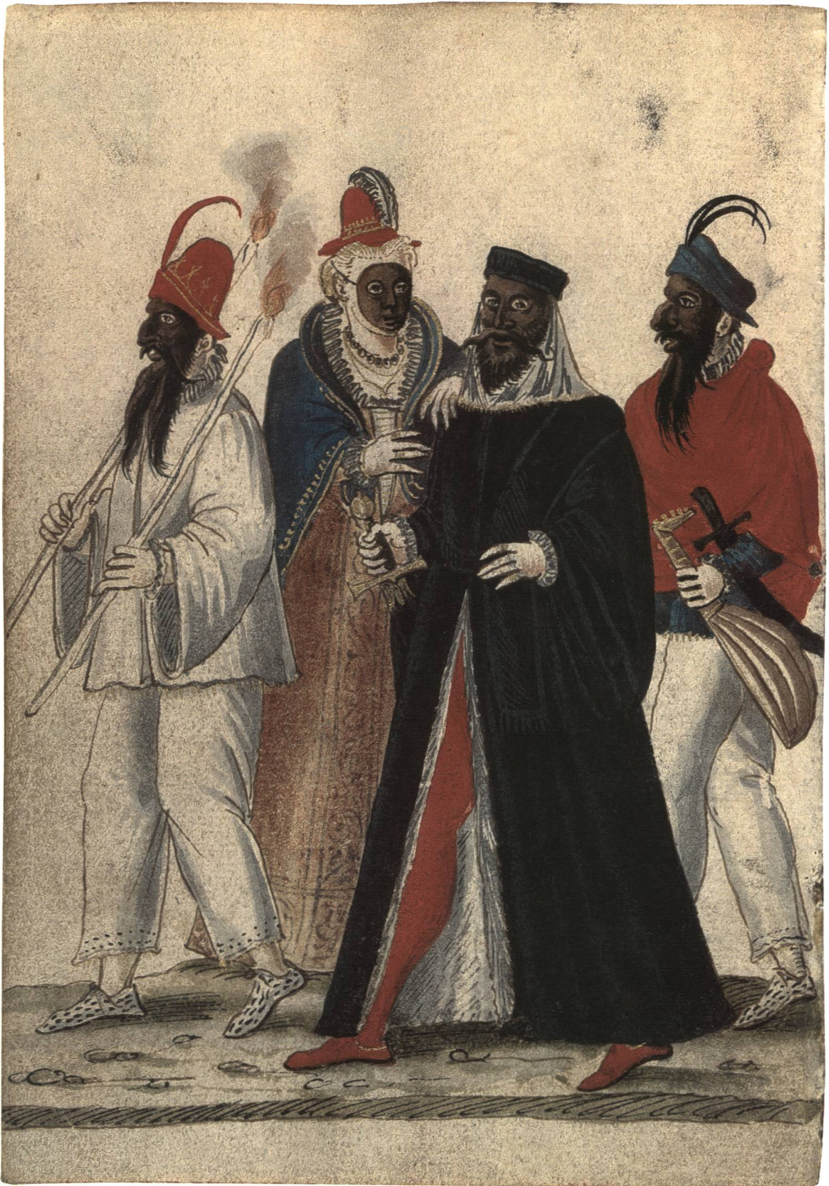
Abb. 15 Basler Maskentreiben im 16. Jh. Deutlich zu sehen sind die aufgesetzten Gesichtsmasken.