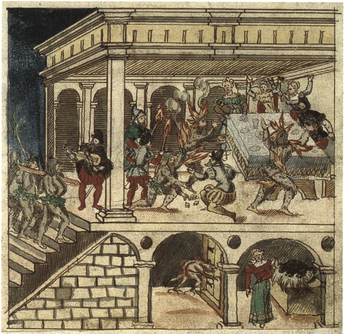
Abb. 10 Fasnächtlich verummte Wildleute suchen eine Gesellschaft heim und geraten wegen einer Fackel in Brand.

Im 15. Jahrhundert wurde in Basel eine Ofenkachel hergestellt, worauf drei verkleidete Gestalten, die auf Blasinstrumenten spielen, zu erkennen sind. 69 Aus der Darstellung geht eindeutig hervor, dass der ganze Körper der mittleren der drei Figuren von einem zottigen Tierfell bedeckt ist. Die Füße hingegen sind nackt oder als tatzenartige Pfoten ausgebildet, was, wie Bildbelege zeigen, beides möglich wäre. 70 Es ist nicht eindeutig zu erkennen, ob diese Gestalt auf der Ofenkachel eine Maske trägt, obwohl die fratzenähnlichen Züge eher diesen Eindruck erwecken. Ob es sich bei dieser Darstellung um eine fasnächtliche Szene handelt, ist nicht mit Sicherheit zu sagen, doch durchaus wahrscheinlich.