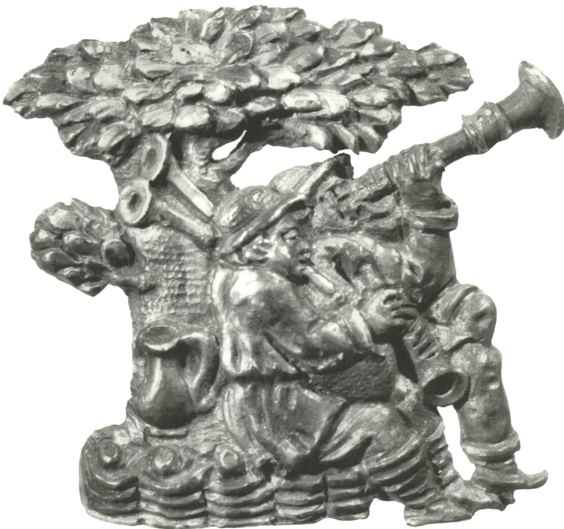
Abb. 22 Dudelsack- und Schalmeyspieler.

Auf der bereits erwähnten Ofenkachel, die in der Mitte des 15. Jahrhunderts in Basel hergestellt wurde, sehen wir drei verkleidete Gestalten, die auf Blasinstrumenten Musik machen. 146 Die Vermutung liegt nahe, dass es sich bei den drei Gestalten um fasnächtliche Figuren handelte, da die Kopfbedeckung des einen Kostümierten verdächtig nach etwas Narrenkappenähnlichem aussieht, worauf wir im weiteren aber noch zurückkommen werden. Bei den Instrumenten, welche die drei spielen, handelt es sich definitiv um Blasinstrumente. Man kannte im Mittelalter eine Reihe lauter Instrumente, wie zum Beispiel Posaunen, Fanfaren, Zinken, Schalmeyen und Flöten. Welche Instrumente hier genau dargestellt worden sind, ist für unsere Betrachtung nicht von Bedeutung, denn nur dass sie laut und lärmend waren, spielte eine Rolle.