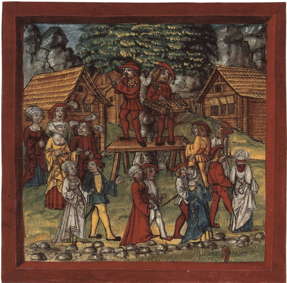
Abb. 24 Fasnachtstanz auf der Landmatte zu Schwyz.

die fröud so gar schalklich und wüstlich daz wirdig herren und frowen uff ir stuben nit getantzen noch kein rüwe vor üch gehabent mögent» («An der letzten Bekanntmachung hat man euch erlaubt, an der Fasnacht in Bocksweise umherzugehen. Ihr habt das aber so übertrieben, dass würdige Herren und Frauen auf ihren Stuben nicht haben tanzen können und keine Ruhe vor euch gehabt haben») 194 Ein sehr interessantes Verbot im Zusammenhang mit diesen Fasnachtsvergnügen der Zünfte ist folgendes: «Item gedenkent den hantwergknechten ze verbieten an der Eschermitwochen nit eynander ze trengen ze zeren und in die Brunnen ze werffen» («Denkt auch daran, den Handwerksgesellen zu verbieten, sich an Aschermittwoch gegenseitig zu bedrängen, zu zerren und in die Brunnen zu werfen») 195 Obwohl diese Fasnachtszunftessen freiwillig waren, sahen das die Gesellen oftmals nicht so und zwangen ihre Zunftkameraden zum Mitmachen, was Verbote zur Folge hatte, wie z.B.