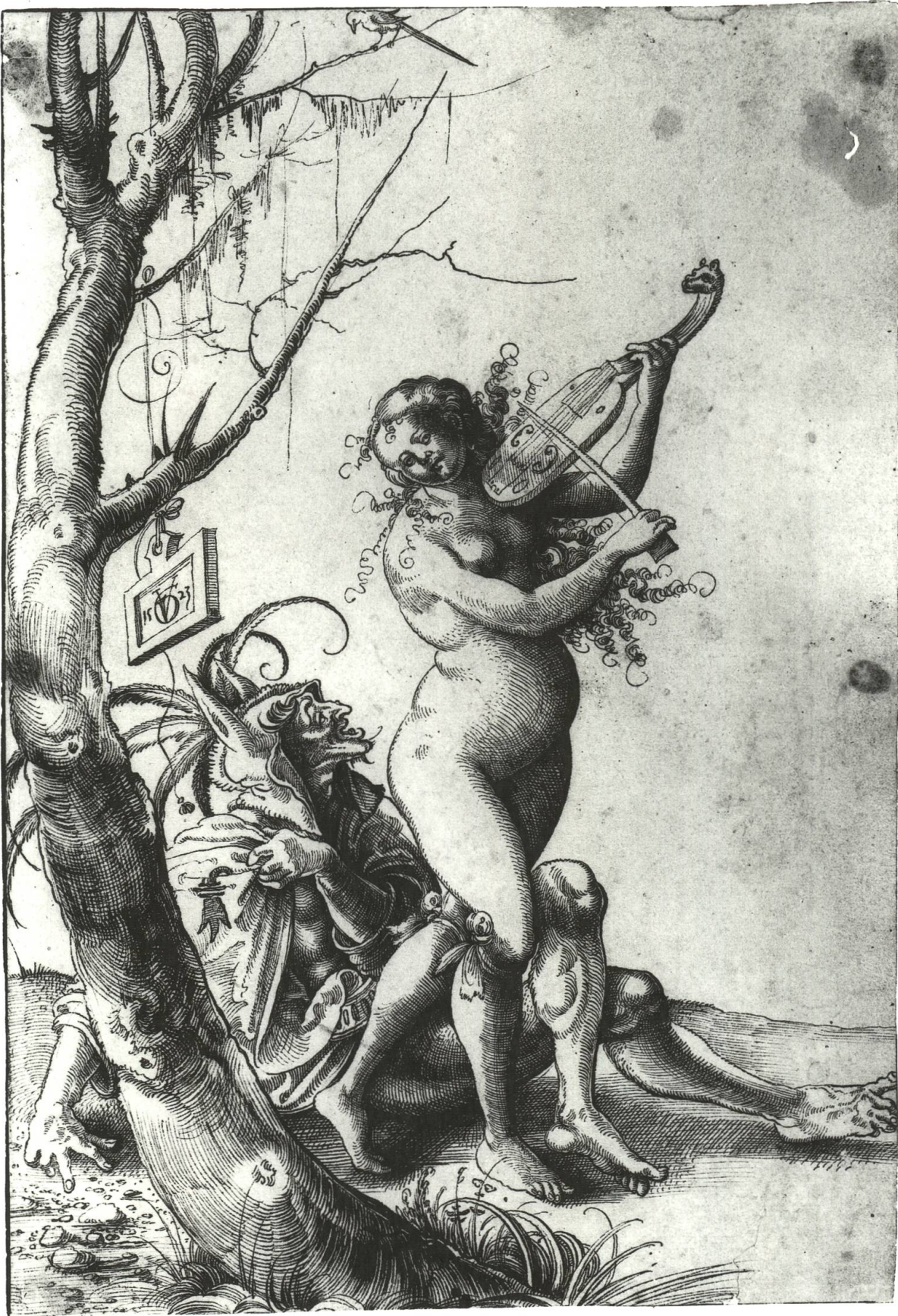
Abb. 12 Basler Narr und Fiedlerin.