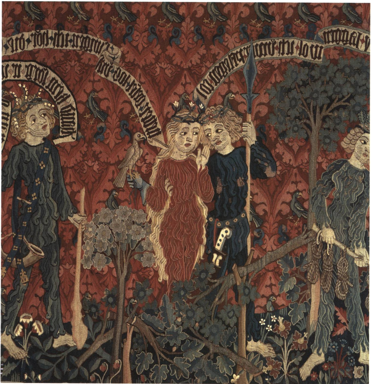
Abb. 16 Wirkteppich mit Wilden Leuten auf der Hirschjagd. Ausschnitt eines Basler Wirkteppichs.

Wie schon erwähnt, wurden die Figuren Gutzgyr und Weibel-Weib nicht an der eigentlichen Fasnacht herumgeführt, sondern erst an Mittfasten. Da die Fastensonntage seit dem Konzil von Benevent 1091 nicht mehr vom Fastengebot betroffen waren, scheint man den Mittfastensonntag (Laetare), als Halbzeitermin der Fastenzeit sozusagen, nochmals genutzt zu haben, um die Fasnacht ein letztes Mal aufleben zu lassen, wie das auch für Belgien noch heute bekannt ist 104 , und feierte dabei nochmals so ausgelassen wie an der Fasnacht. Da dieser Brauch zwar nicht zur eigentlichen Fasnacht gehörte, aber eindeutig mit ihr im Zusammenhang stand, soll er hier ebenfalls erwähnt werden. Ob dieser Brauch eventuell auch in der Stadt praktiziert wurde, ist nicht bekannt, was aber durchaus denkbar wäre, da auch Brauchtum vom Land in die Stadt getragen wurde.