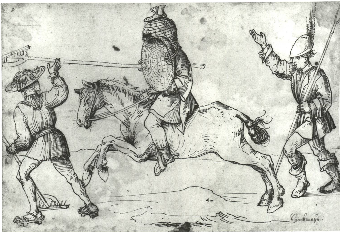
Abb. 28 Bauernturnier, das ritterliche Turnier parodierend.

Turniere sind in Basel seit der zweiten Hälfte des 13. Jahrhunderts belegt. Die Voraussetzungen für das ritterlich-höfische Leben, zu welchem unter anderem das Turnier gehörte, wurden durch verschiedene äussere Umstände geschaffen. Der Landadel liess sich vermehrt in der Stadt nieder, um dem Machtzentrum des Bischofssitzes näher zu sein, und brachte dadurch seine Lebensformen in die RheinStadt mit, namentlich die brauchwürdige Adelsfehde. Auch der Aufstieg des Achtburgerstandes in den Adel spielte eine Rolle. Dadurch waren die Grundlagen für ein ritterlich-höfisches Leben geschaffen. 207 Bei Festen im Mittelalter hatten verschiedenste Spiele und Wettkämpfe ihren festen Platz, und das Turnier gehörte bei bedeutenden Feierlichkeiten der adligen Kreise einfach dazu. 208 Es ist deshalb nicht weiter erstaunlich zu erfahren, dass auch an der Fasnacht ritterliche Turniere abgehalten wurden. Auch hier ist der Termin eher zufällig und kann historisch in irgendeiner Weise speziell mit der Fasnacht in Zusammenhang gebracht werden. Unter anderem waren der erste und zweite Fastensonntag (Invocavit und Reminiscere) beliebte Termine für Turniere. 209