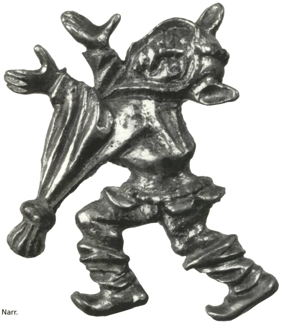
Abb. 13 Tanzender Narr.

für Gottesleugnertum und Sündhaftigkeit und wurde oft auch mit der Erbsünde gleichgesetzt. Vom Gedanken ausgehend, dass der Tod durch die Erbsünde, sprich die Narrheit des Menschen, in die Welt gekommen war, ergibt sich der Zusammenhang zwischen Narr und Tod. 81