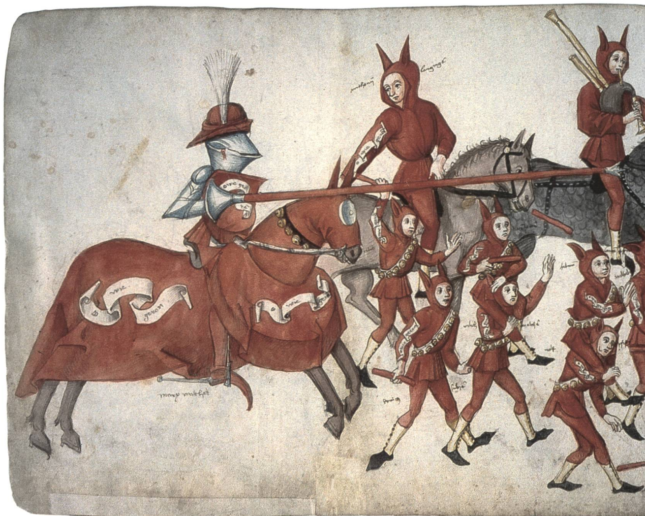
Abb. 31 Ein Turnier von 1480. Narren übernehmen die Aufgaben von Herold, Musikanten und Knappen.