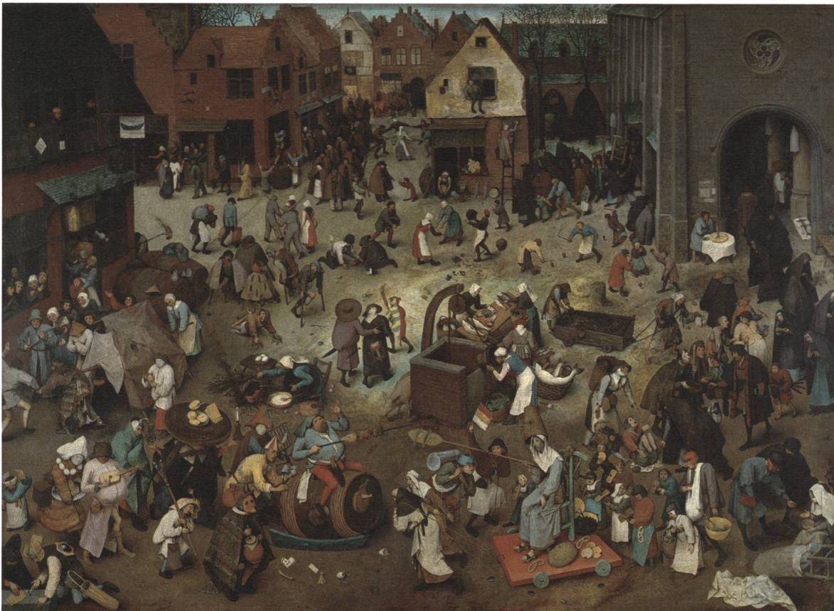
Abb. 30 Der Streit des Karnevals mit den Fasten (1559).

fand: «als man uff der Burg stach» («als man auf dem Münsterplatz ein Turnier abhielt») 213 . Während des Turnieres flogen plötzlich Speere in die Zuschauer und verursachten einen Tumult, der schliesslich in blutigen Auseinandersetzungen zwischen Bürgern und Edelleuten endete und mehrere Todesopfer forderte. In der Folge wurden zwölf Basler Bürger hingerichtet, und auf Betreiben von Herzog Leopold wurde die Reichsacht über die Stadt verhängt. 214