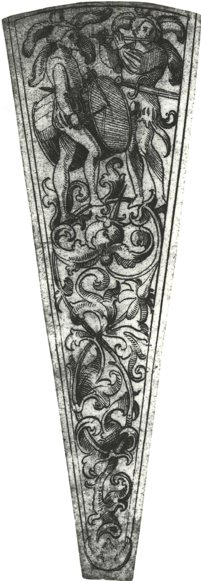
Abb. 21 Dolchscheide mit Trommler und Pfeifer von Urs Graf.