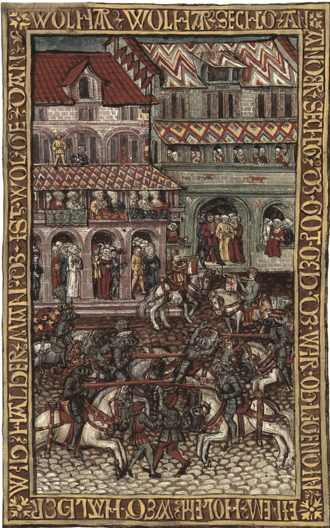
Abb. 5 Zur Faschnachtszeit abgehaltenes Turnier am Lehenhof der Habsburger zu Zofingen 1361.