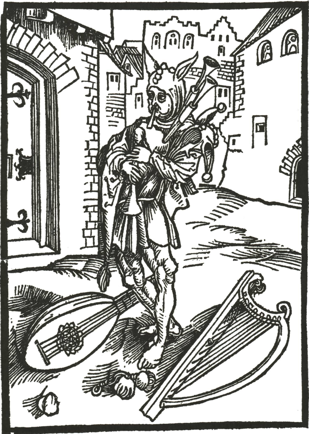
Abb. 7 Musizierender Narr in Narrenkappe mit Eselsohren.