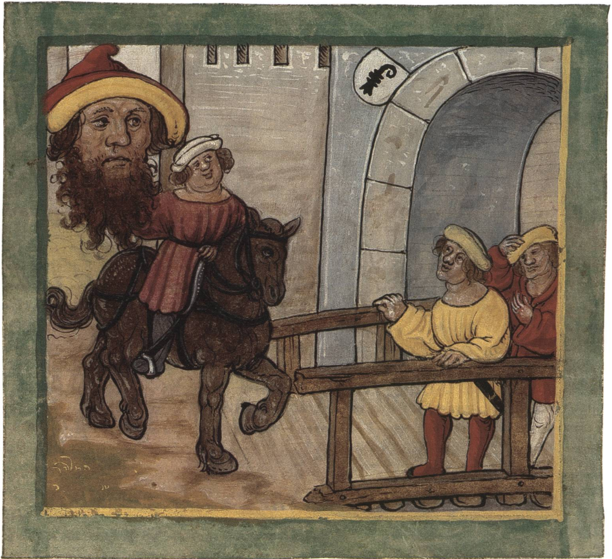
Abb. 1 Der Gesandte der Basler bringt die in Luzern geraubte Fritschimaske nach Basel (1507).

jährlich zum obengenannten Fasnachtstag [Schmutziger Donnerstag] auf der Gesellschaftstube zum Safran, zu der er eine besondere Beziehung gewonnen hatte, sehen, um an diesem Tag mit guten Gesellen sein Geld auszugeben. Daraus folgte, dass man anfangs, diesen Tag Fritschitag und auch die Gesellschaft nach ihm zu benennen. [...]. Und um das Gedächtnis dieser Gesellschaft zu wahren, wurde eine Stiftung gegründet und mit einem jährlichen Einkommen ausgestattet. Man verordnete, dass sich die Gesellschaft alljährlich an diesem Tag versammeln solle und aus ihrer Mitte einen auswähle, der begleitet von Spielleuten durch die ganze Stadt ziehen solle, um dabei jedem, der wolle – sei er reich oder arm, jung oder alt –, aus einem grossen, mit Wein gefüllten Kopf zu trinken zu geben. Der Kopf [Trinkgefäss] sollte immer wieder aufgefüllt werden, und die Gesellschaft musste die Kosten tragen.»)