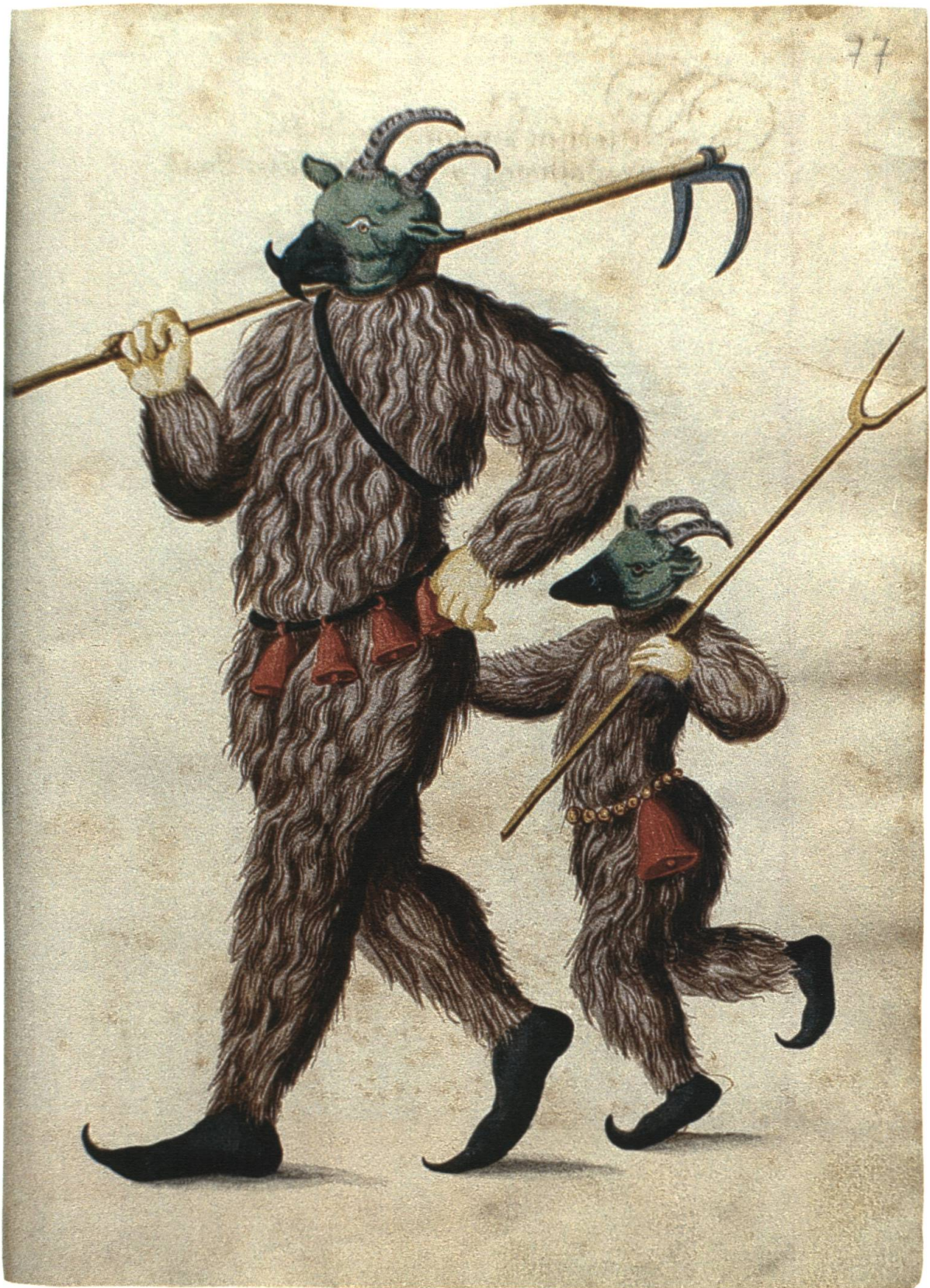
Abb. 8 Fasnachtsmaske in Ziegenbockverkleidung (16. Jh.).