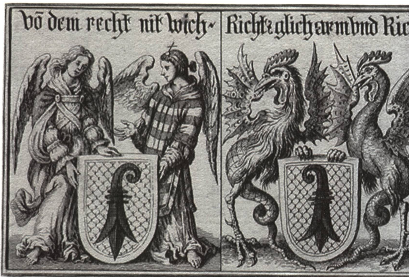
Abb. 4 Diverse Wappenhalter, unter anderem Wildleute, aus der Wurstisen Chronik.

Fasnacht 23 als «Endglied einer um ein Halbdutzend Jahrhundertläufe zurückreichenden Entwicklung, in welcher altheidnische Frühlingsgebräuche, germanisches und romanisches Wesen sich vermengten, religiösen Vorstellungen sich weltliche Fröhlichkeit zugesellte, alles gedrängt und gesteigert im Hinblick auf die bevorstehenden langen Fasten». 24 Mezger bestätigt, dass man nicht bestreite, dass «in dem Brauchtermin Fastnacht durchaus gewisse [...] Elemente älterer Feste enthalten sein können; im Gegenteil, dies liegt sogar nahe», dass es aber falsch für die Wissenschaft sei, eine Kontinuitätsprämisse für die Entwicklung von irgendwelchen vorchristlichen Kulturen bis zu unserer Fasnacht vorzusetzen. Er meint weiter, dass es jedoch mehr Sinn mache, die Fasnacht christlich zu deuten, da sie im Ablauf des Kirchenjahres ihren festen Platz habe. 25 Diese Theorie gilt heute als allgemein unbestritten und wurde von Hellmut Rosenfeld 1969 so zusammengefasst: Fasnacht ist kein «vorchristliches Frühlingsfest», sondern ein «auf der ganzen Linie [...] aus dem christlichen Jahresrhythmus neu erwachsenes Brauchtum». 26