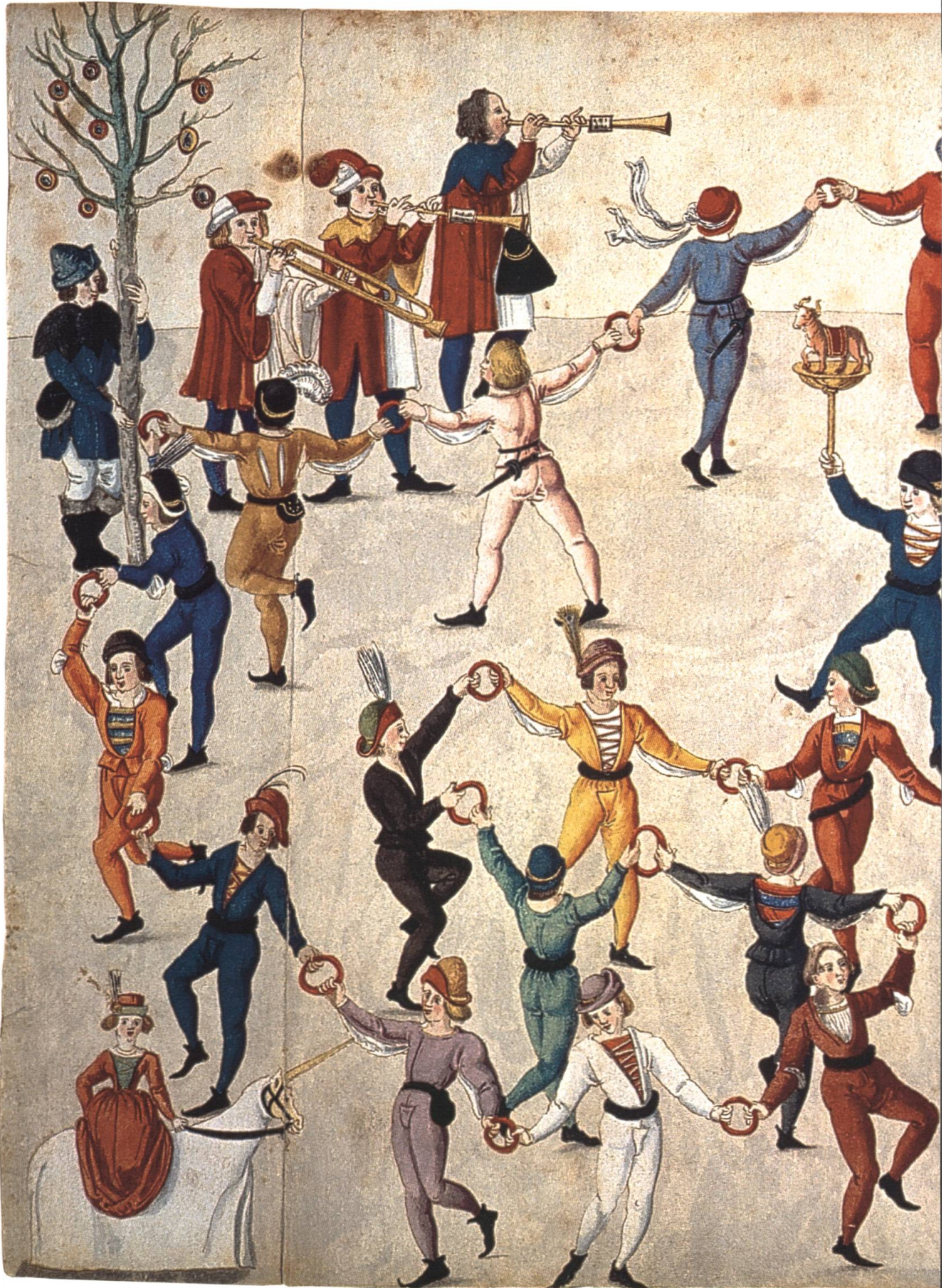
Abb. 2 Nürnberg Fasnachtsszene (16. Jh.). Tanz der Metzger.