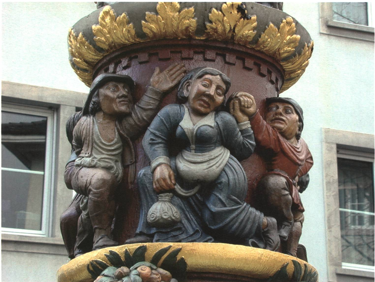
Abb. 6 Bauerntanz. Detail vom Holbeinbrunnen in der Spalenvorstadt (16. Jh.).

hunderts war die Fasnacht nichts weiter als ein gemeinsames Gelage, häufig mit Tänzen, Turnieren oder Wettspielen, das «den Charakter eines absolut unschuldigen Vergnügens ohne jegliche negativen Implikationen» besass. 32 Im 15. Jahrhundert setzte dann ein tiefgreifender Wandel in der Einstellung der Kirche zur Fasnacht ein. Die Fasnachtsfeier wurde von da an nicht mehr als isoliertes Geschehnis gesehen, sondern nur noch als Gegenstück zur Fastenzeit. Dadurch wurde die Fasnacht «als abschreckendes Beispiel für ein falsches, sündhaftes und gottfernes Dasein» im Gegensatz zur gottgefälligen Fastenzeit gesetzt. 33 Durch den Einstellungswandel der Kirche wandelte sich auch der Inhalt der Fasnacht. Sie entwickelte sich von der «ursprünglich unschuldig-naive[n] Vordergründigkeit» zu einem Fest mit «mehr und mehr hinter-sinnig-zeichenhafte[m] Charakter» 34 , der sich natürlich auch im Brauchtum niederschlug.