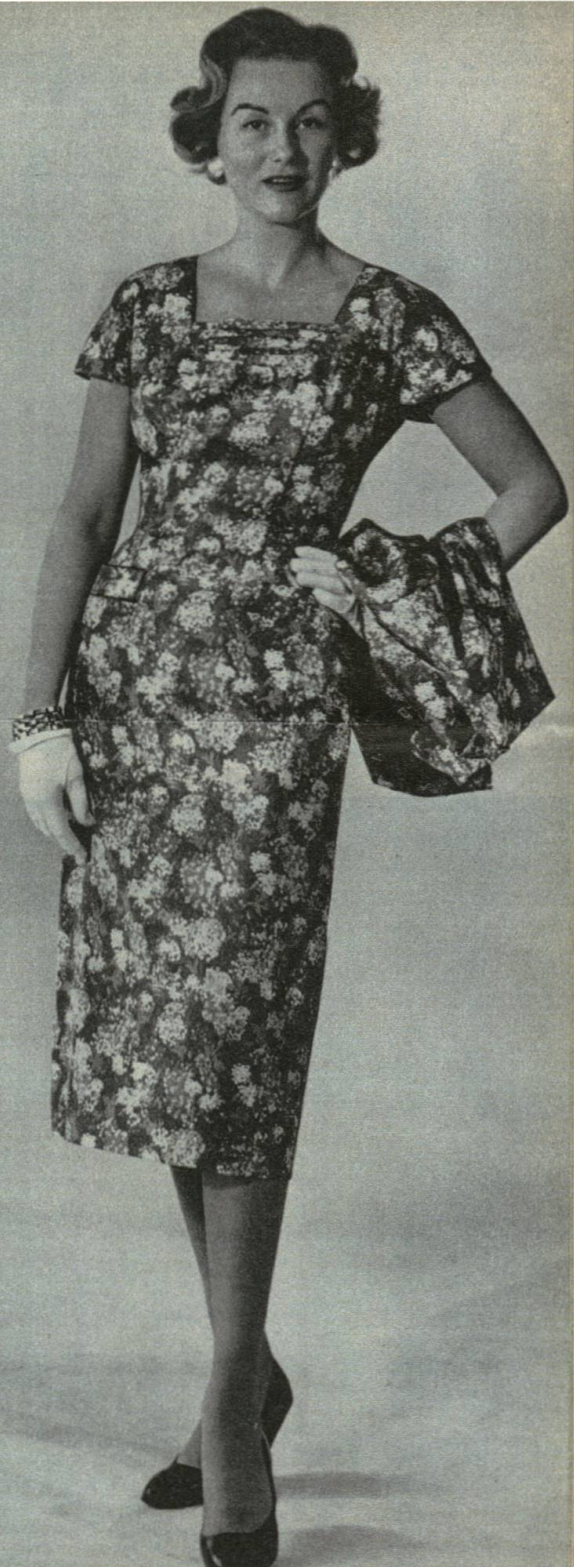
Abb. 72 Modebeitrag «4 Budgets für 4 Alter».