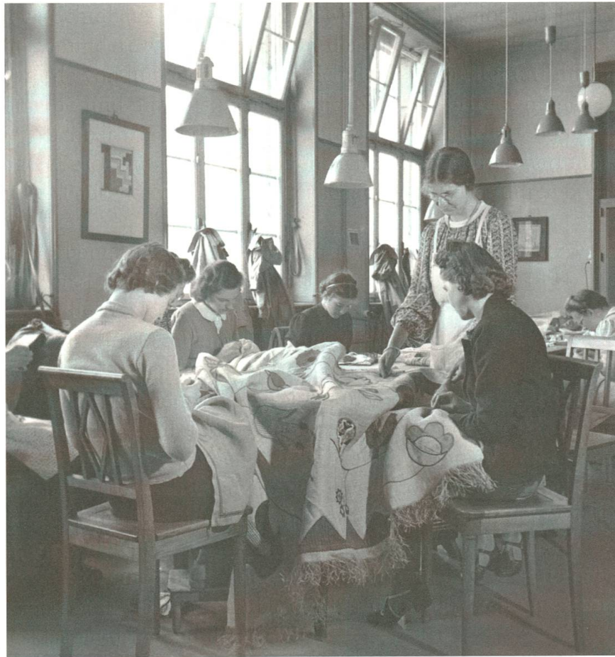
Abb. 12: Gehört Buntsticken als hauswirtschaftliches Fach an die FAS oder als kunstgewerbliches Fach an die AGS? Diese Frage war Auslöser eines 28 Jahre dauernden Streits zwischen den beiden Schulen.