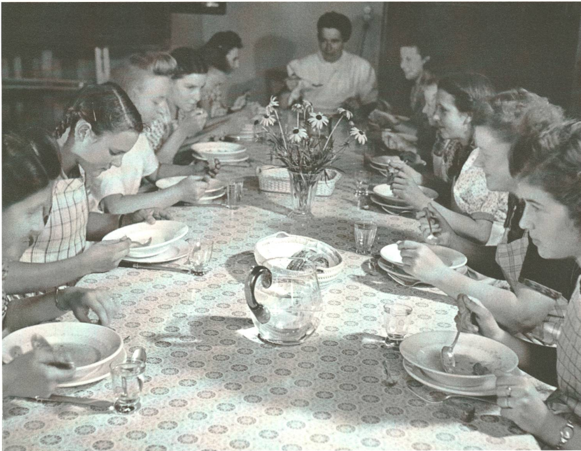
Abb. 11: Ein gemeinsames Mahl im Rahmen des Jubiläums 1929.

sei es nicht sinnvoll, Lehrtöchterklassen an Frauenarbeitsschulen zu eröffnen oder zu erweitern. Und zudem seien solche Einrichtungen eine Konkurrenz, die das um seine Existenz kämpfende Frauengewerbe schwer schädigen würde. 92 Die FAS wies eine Mitverantwortung für die Krise in gewissen Frauenberufen von sich und sah das Bedürfnis nach einer Lehrwerkstätte gegeben. Das Departement des Innern würde diese Meinung bestätigen. 93 Daraufhin versuchte die Basler Frauenzentrale zu vermitteln. Die Frauenzentrale war eine Dachorganisation von 18 bürgerlichen Frauenvereinen, existierte von 1916 bis 2006 und hatte ursprünglich zum Ziel, die Interessen der Frauen gegenüber den Behörden zu vertreten. 94 Doch auch durch die initiierte Besprechung mit dem Frauengewerbeverband liess sich die FAS nicht von ihrem Vorhaben abbringen. 95 Der Erziehungsrat bestätigte schliesslich seinen Beschluss vom März und erlaubte die probeweise Einführung. Nach ersten Erfahrungen solle definitiv entschieden werden. So startete schliesslich der Unterricht am 18. Oktober 1937. 96