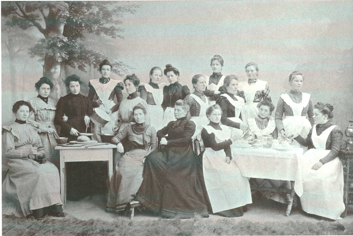
Abb. 5: Gruppenbild des 25. Kochkurses von Oktober 1900 bis März 1901. Man beachte die Inszenierung der Fotografie. Das Bild wurde offensichtlich in einem Fotostudio aufgenommen. Kochutensilien werden zur Schau gestellt. Die unterschiedlichen Blickrichtungen dürften vom Fotografen angeordnet sein.

Weg weiterzuführen. Das finanzielle Problem löste sich in der Folge dadurch, dass die Schülerinnen mit zunehmendem Fortschritt sparsamer kochen lernten.