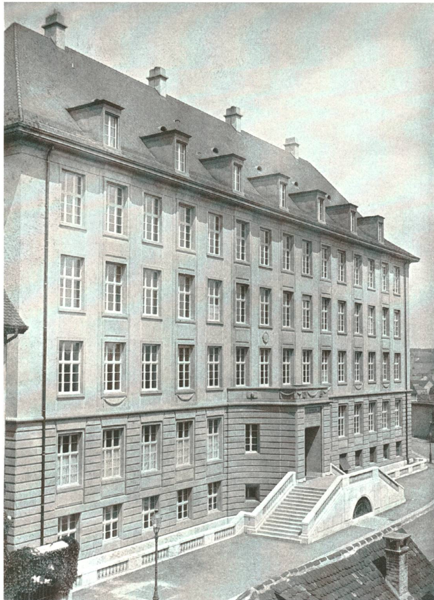
Abb. 6: Das Hauptgebäude an der Kohlenberggasse 10 wurde 1916, mitten im Ersten Weltkrieg, fertiggebaut. Architekt war Hans Bernoulli.

benutzte die FAS Räume im Isaak Iselin-Schulhaus. Gleichzeitig wurde zum ersten Mal konkret über ein eigenes, neues Schulhaus nachgedacht, denn die aktuelle Situation war auch im eidgenössischen Inspektionsbericht deutlich kritisiert worden: