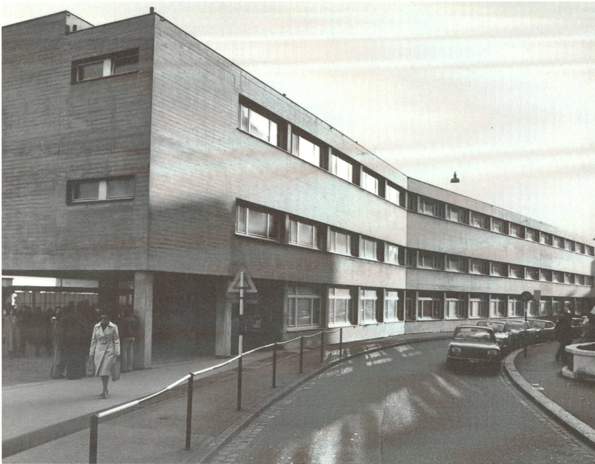
Abb. 14: «Aus der Tiefe des Steinenbachgässleins» – in den Jahren 1959 bis 1961 wurde das neue Schulhaus der FAS, der sogenannte Hangbau und heutiges Gebäude B, erstellt. Architekt war B. Weis.

richtet wurden, erhielten vorerst Räume an der Kohlenberggasse 4. 197 Erst 1951 wurde die Planung für ein neues Schulgebäude wiederaufgenommen. Von 1959 bis 1961 schliesslich «wuchs der Ergänzungsbau aus der Tiefe des Steinenbachgässleins empor» 198 , wie im Jahresbericht vermerkt ist. Die Bauzeit muss eine Belastungsprobe für die Schule gewesen sein. Wiederholt wird der nervenzermürende Baulärm beklagt. Überall und immer wieder habe es Staub und Schmutz gehabt. Zudem war 1960 während einer ausserordentlichen Kälteperiode die Heizung ausser Betrieb, wodurch sich die schwierigen Umstände noch zuspitzten: