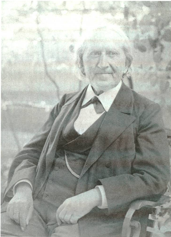
Abb. 1: Carl Schmid-Linder (1826–1911), Gründer und erster Vorsteher der FAS (1879–1904).