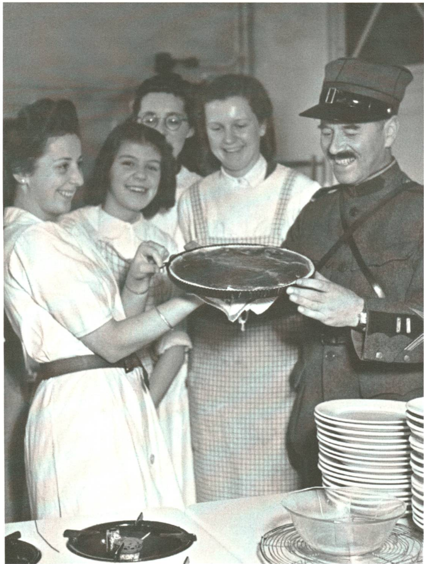
Abb. 13: Mit sichtbarer Freude wurde in Kursen der FAS für die Soldatenfürsorge genäht, geflickt und gebacken.

hernehme». 176 Die Tätigkeiten ausserhalb der gewohnten Aufgaben waren also nicht immer ganz unproblematisch.