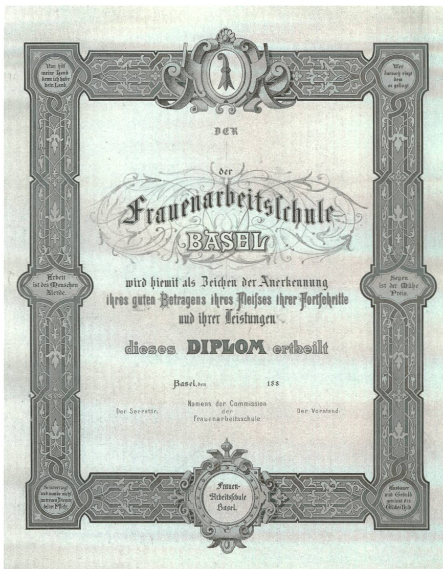
Abb. 3: Segen ist der Mühe Preis – Schülerinnen, die sich in drei Hauptkursen durch Fleiss, sehr gutes Betragen und gute Kenntnisse ausgezeichnet hatten, erhielten in den 1880er Jahren ein spezielles Diplom.