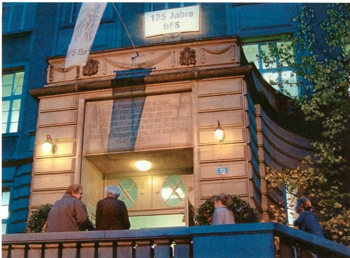
Abb. 17: 2004 feierte die Schule 125 Jahre BFS mit einem grossen Fest, der «BFS-Night».

vorkommt, ist zweifellos eine Anpassung an die Realität. Schliesslich stehen die traditionellen Frauenberufe beiden Geschlechtern offen, und es besuchen viele Männer die BFS Basel. Es macht aber auch den Anschein, als ob die Schule sich der Frauen im Namen hätte entledigen müssen, damit sich ihr Image ändern konnte und sie im Vergleich zu den anderen Berufsschulen als gleichwertig wahrgenommen wurde. Die Erfahrungen der neunziger Jahre, als der BFS das schlechte Image in Form der drohenden Schliessung vor Augen geführt wurde, dürften hier eine Rolle gespielt haben.