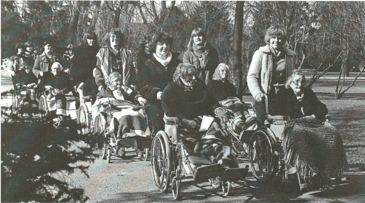
Abb. 15: Der anstelle von Strafen 1971/72 eingeführte Sozialdienst war für alle Seiten ein positives Erlebnis – Schülerinnen der Vorklassen spazieren mit Patienten und Patientinnen des Felix-Platter-Spitals im Kannenfeldpark.

weniger an die Regelung, danach häuften sich die Absenzen der Lehrlinge vor Weihnachten. 225