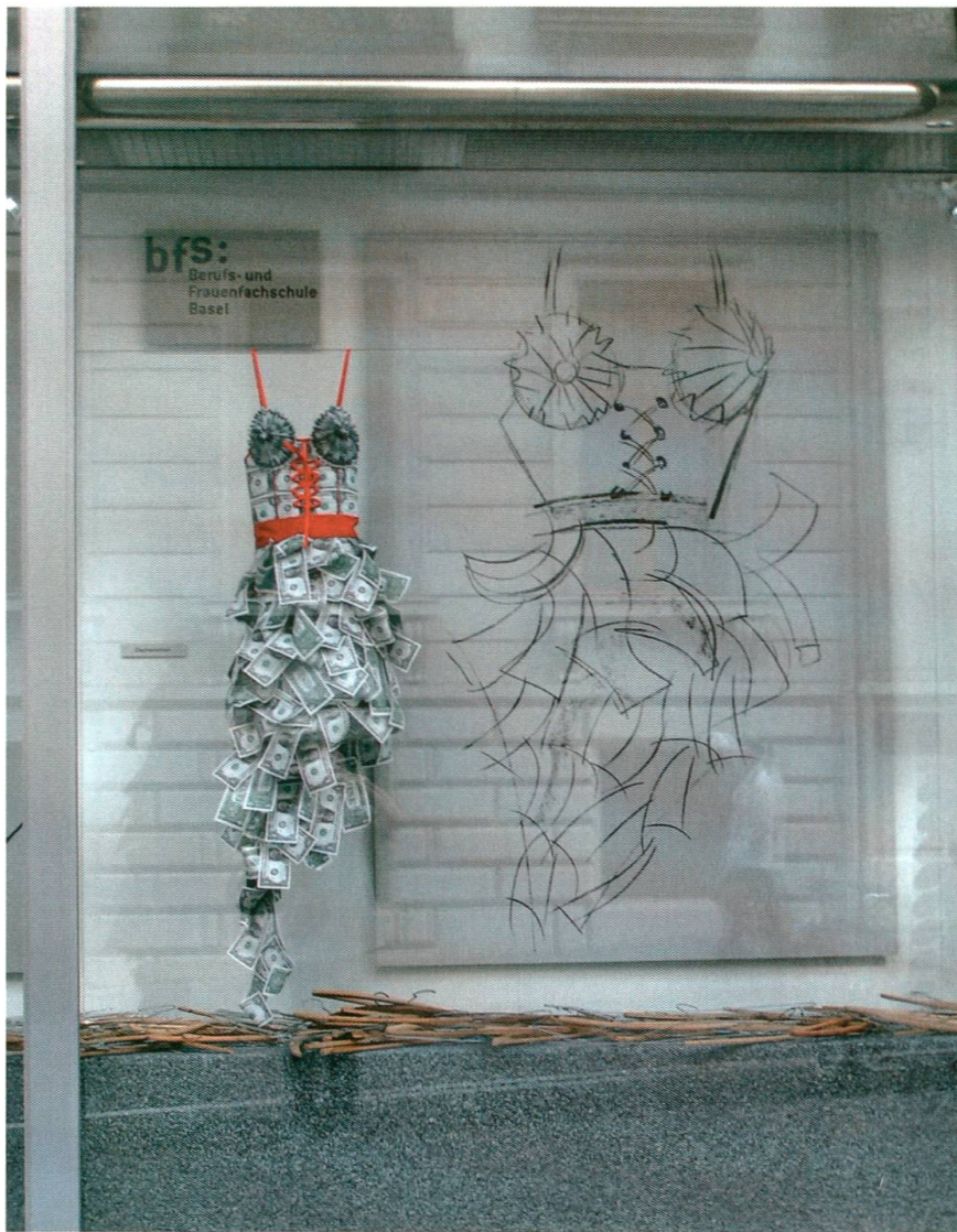
Abb. 16a, b: Im Jahre 2004 wurden an der Jubiläumsausstellung der BFS in den Vitrinen der Credit Suisse kreative Modelle gezeigt.

Gebäude und in der Innenstadt Basels. 283 Der Wunsch nach einem dritten Atelier war seit den 1970er Jahren mehrere Male geäußert worden, jeweils ohne Erfolg. 284 Im Schuljahr 2009/10 schliesslich fanden zum ersten Mal zwei Lehrgänge «Frühe sprachliche Förderung – Schwerpunkt Deutsch» für die Weiterbildung von Spielgruppenleiterinnen und -leitern sowie für Leitungspersonen von Tagesstrukturen statt. Dieses Angebot steht in Zusammenhang mit dem basel-städtischen Projekt «Mit ausreichenden Deutschkenntnissen in den Kindergarten». Dieses will den Schulerfolg und damit die Chance auf eine erfolgreiche berufliche Laufbahn verbessern, weshalb Kinder mit ungenügenden Deutschkenntnissen verpflichtet werden, eine Spielgruppe, ein Tagesheim oder eine Tagesfamilie mit integrierter Sprachförderung zu besuchen. 285