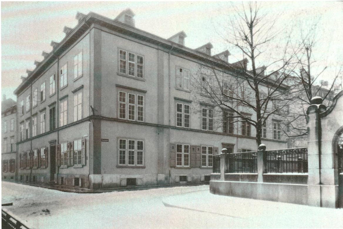
Abb. 2: In diesem Schulhaus an der Kanonengasse 4 fanden ab 1879 die ersten Kurse der FAS statt.

Gegründet wurde die FAS am 31. März 1879; der Unterricht begann mit viermonatigen Kursen in «Handnähen», «Glätten» sowie «Rechnen und Buchführung» am 21. August 1879 im Leonhardschulhaus, Ecke Kanonengasse–Kohlenberggasse. Die Kommission der FAS hatte beschlossen, «nicht die ganze Anstalt mit allen möglichen Kursen auf einmal in's Leben zu rufen, sondern sie ruhig sich entwickeln und nach Bedürfnis wachsen zu lassen». 10 So kamen nach und nach mehr Kurse dazu: im Dezember desselben Jahres «Maschinennähen» und «Putzmachen», in den folgenden fünf Jahren «Kleidermachen», «Flicken», «Weissticken», «Buntsticken», «Zeichnen» und «Wollfach». Die Kurse konnten nach Bedarf gewählt werden, einen vorgeschriebenen Ablauf gab es nicht. Die Schülerinnen konnten sogar Kurse nach eigenem Wunsch initiieren. Ab 1884 begann die Ausbildung von Arbeitslehrerinnen, die an Primar-, Sekundar- und Töchterschulen handarbeitliche Fächer unterrichteten. Diese Entwicklung führte zu einer stetig steigenden Schülerinnenzahl, bereits im ersten Jahr bestand Raumnot. Deswegen erhielt die FAS 1880 ihr eigenes Schulhaus in einem bisherigen Fabrikgebäude am Stapfelberg 7. 11