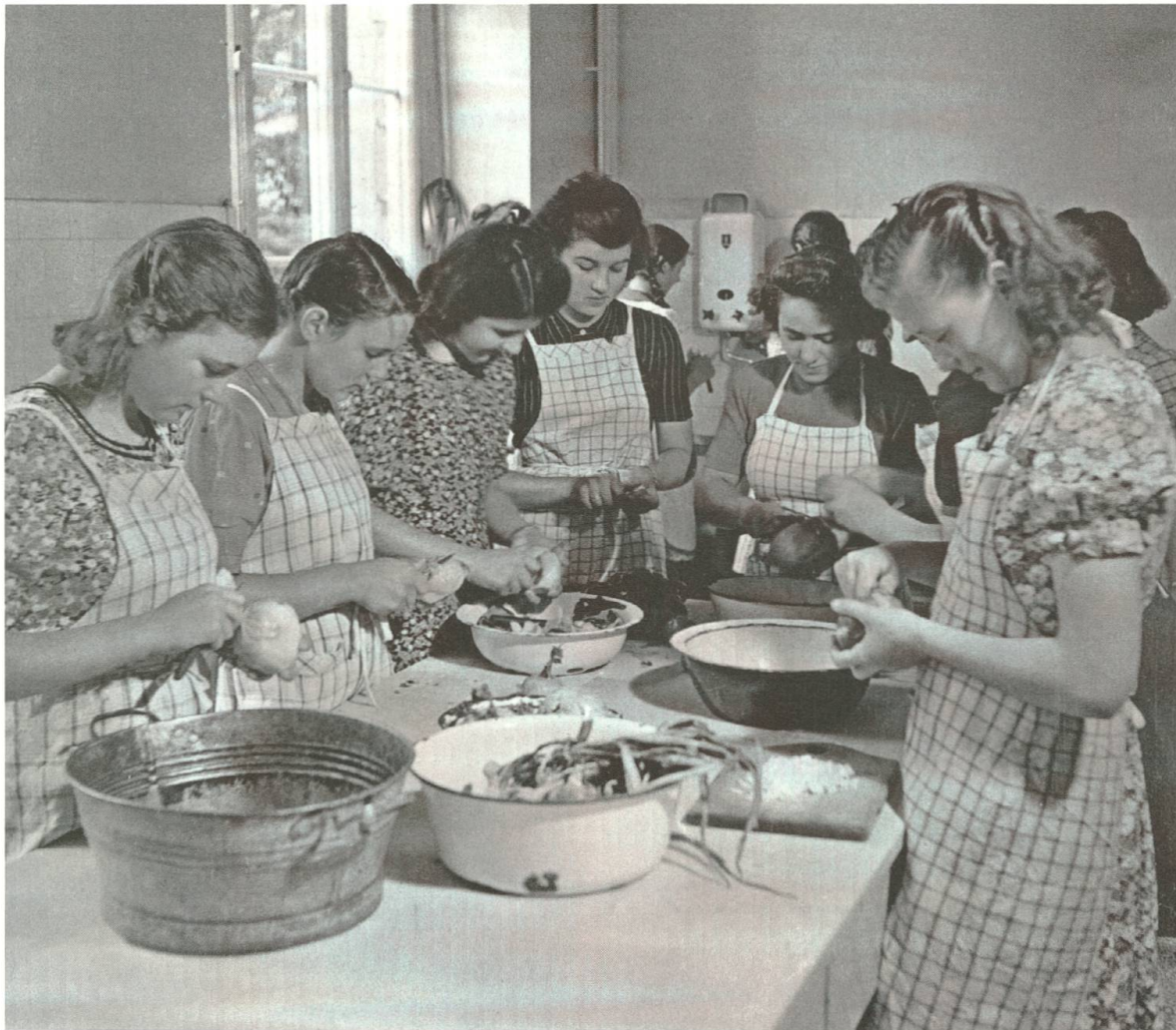
Abb. 10: In einem Kochkurs wird das Jubiläumssessen zubereitet.

funktioniere überhaupt nicht gut. Neutrale Geschäftsleute würden zwar den hohen Wert der Vorlehre anerkennen, das halbe Jahr werde jedoch von kaum einem Betrieb angerechnet. Deshalb werde auch die angestrebte Aufteilung der Lehre, bei der zwei Jahre an der Lehrwerkstätte der FAS und ein Jahr in einem Betrieb zu absolvieren wären, nicht funktionieren. Zuschriften von Vätern und auch der Vergleich mit anderen Städten würden die FAS ermutigen, erneut einen Antrag auf die Einführung einer Eliteklasse zu stellen. Und zwar solle aufgrund der Erfahrungen mit den Vorkursen die ganze Ausbildung an der FAS stattfinden. 90 Das Bedürfnis nach einer Lehrwerkstatt wurde von Seiten des Gewerbes zwar verneint, doch der Erziehungsrat beschloss, eine probeweise Einführung zu erlauben. 91