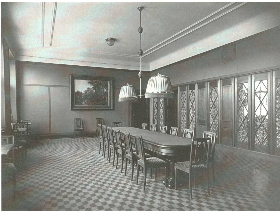
Abb. 8: Ein Bibliotheksraum im neu errichteten Hauptgebäude – heute befindet sich dort das Sekretariat der BFS Basel.

der Schweiz. Sie engagierte sich in verschiedenen gemeinnützigen Frauenvereinen und forderte von Bund und Kantonen finanzielle Unterstützung für die Mädchenfortbildung. Sie verfasste zudem mehrere beliebte und weit verbreitete Werke über die Haushaltsführung, zum Beispiel Wie Gritli haushalten lernt , und gründete die Zeitschrift Schweizer Frauenheim . 1896 wurde sie vom Bundesrat zur eidgenössischen Expertin für das gewerbliche und hauswirtschaftliche Bildungswesen ernannt; in dieser Funktion beaufsichtigte sie auch die subventionierten Mädchenfortbildungsschulen. 48 Über die Frauenarbeitsschule Basel äusserte sie sich Jahr für Jahr mit grossem Lob. Im Inspektionsbericht von 1897 beispielsweise gratulierte Coradi-Stahl der Stadt Basel zu ihrer Frauenarbeitsschule: