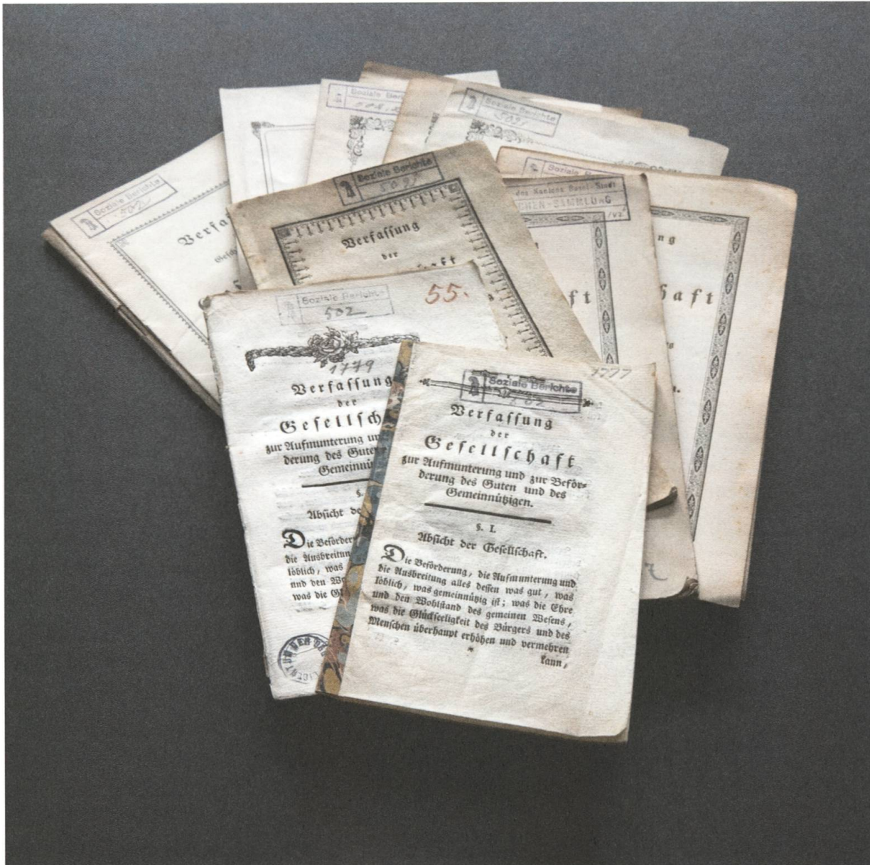
[28] Die Statuten der GGG von 1777 bis 1916. Vorne die ältesten, ganz hinten die jüngeren. Ebenfalls sichtbar sind auf dem ersten und zweiten Exemplar oben der Stempel der Drucksachensammlung des Staatsarchivs sowie unten auf dem zweiten Exemplar der von Rudolf Wackernagel entworfene Besitzstempel der GGG (vgl. Abb. 5, S. 25) und auf allen der Staub der Jahrhunderte.