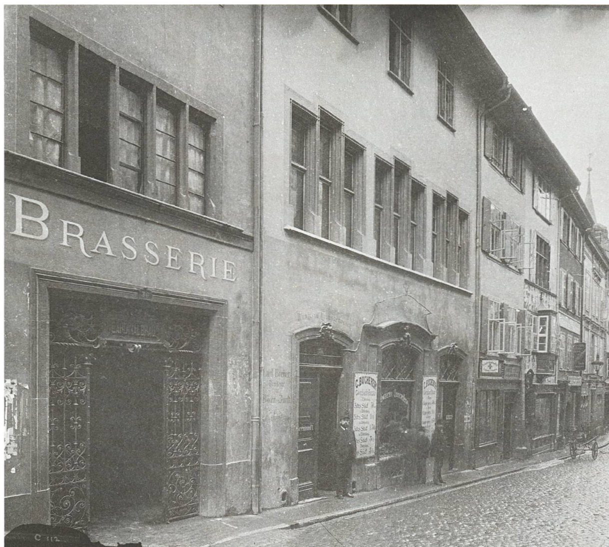
[33] In der Mitte das Zunfthaus zum Bären, Freie Strasse 34/36, in dem die GGG zwischen 1777 und 1787 ihre Vorstandssitzungen abhielt. Die Korrektur der Strasse 1893 führte zum Abriss des Hauses und zu einem Neubau.