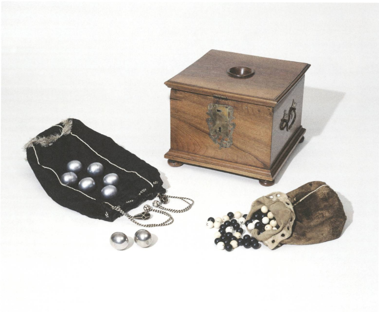
[18] Die Utensilien für das Losverfahren: Wahlkistchen, Beutel und Ballotkugeln. Der Standort des Tischchens, auf dem das Wahlzettelkistchen stand, und die beiden Tischchen, auf denen die Zettel beschrieben wurden, kann Abb. 19, einer Zeichnung aus dem «Statutarium» von 1795, entnommen werden.