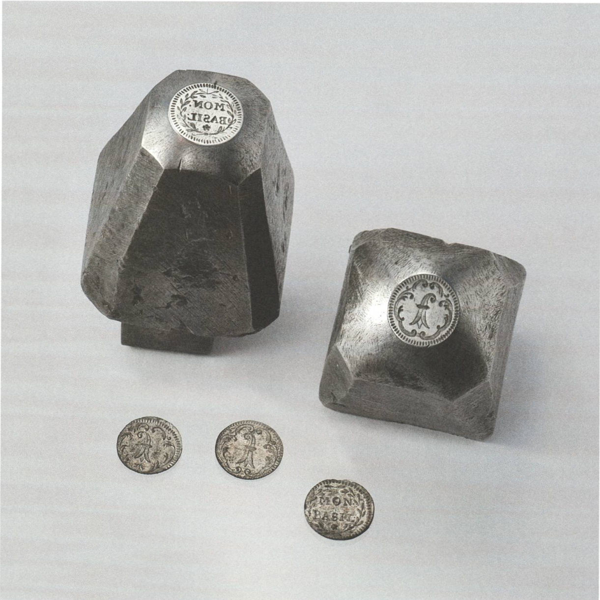
[25] Prägestempel und neue, erstmals zweiseitig geprägte Rappenstücke, geschlagen gemäss der von Isaak Isclin redigierten Verordnung von 1793.