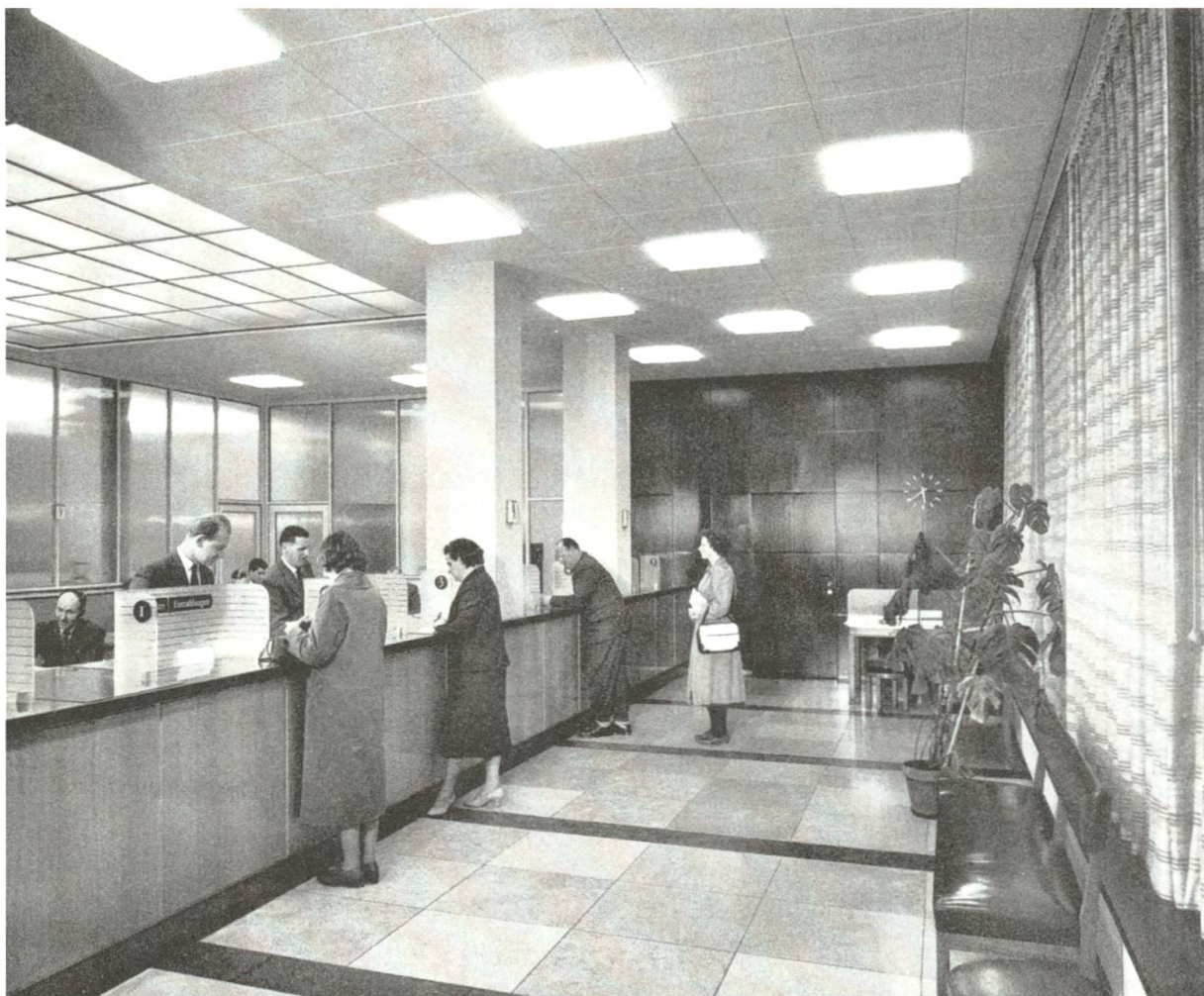
[14] Blick in die Schalterhalle des Eckhauses Steinberg 1/ Elisabethenstrasse, das die ZEK 1956 von der Patria erwarb.