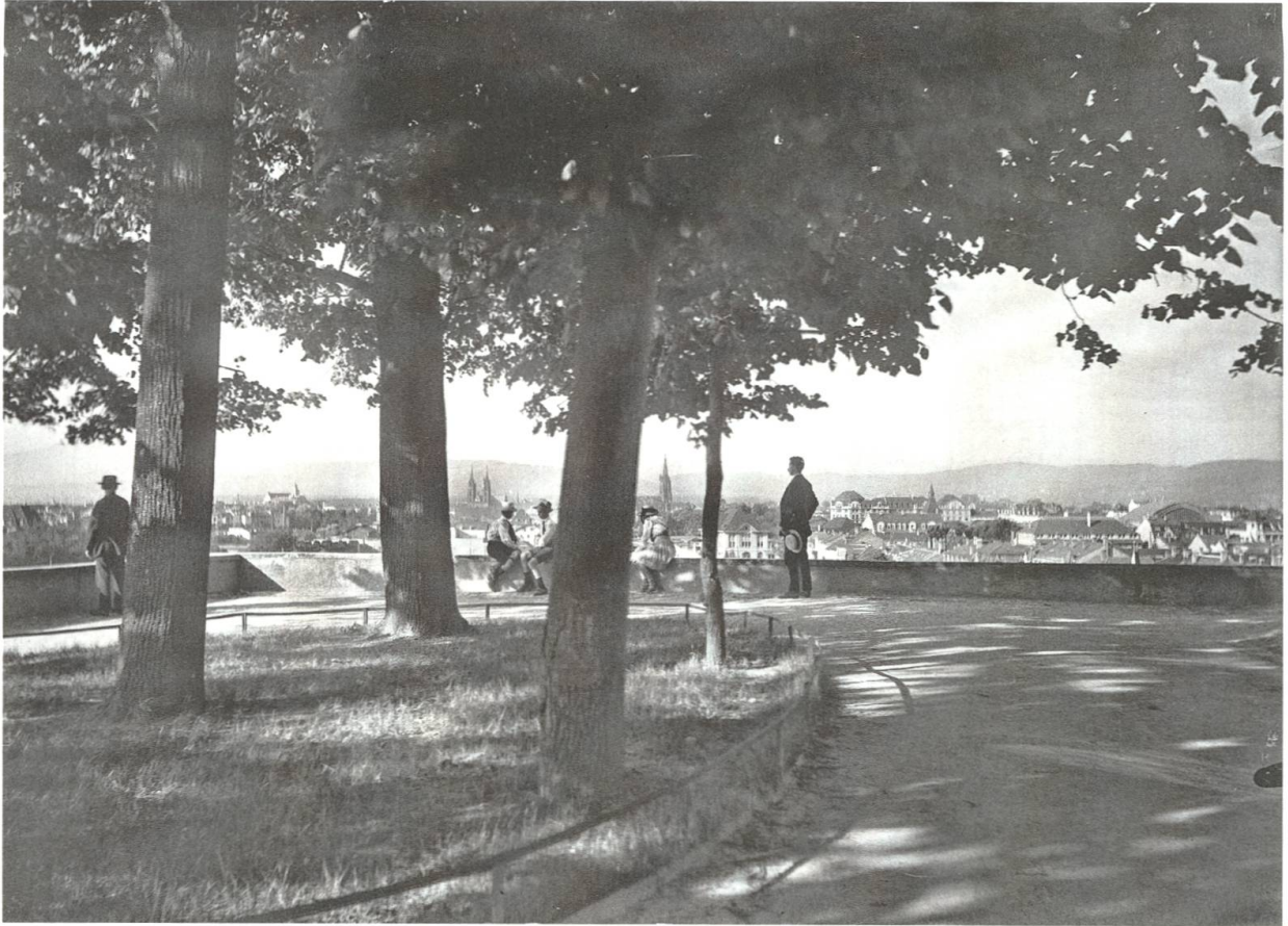
[17] Basel von St. Margrethen aus gesehen. Die GGG war in der ganzen Stadt verwurzelt.