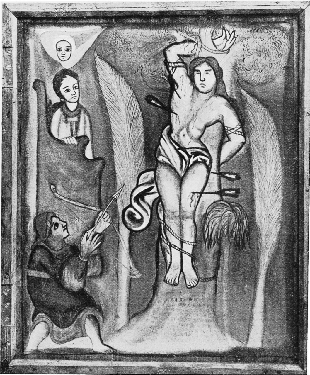
Der heilige Sebastian.

Ein eigenartiger Zug lässt sich darin erkennen, dass Heiligenfiguren und auch abessinische Leute im Kopf en face gemalt