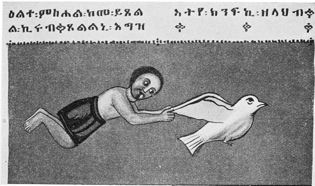
Die heilige Jungfrau befreit in Gestalt einer weissen Taube einen Gefangenen.

ist, wie z. B. der von Pfeilen der Feinde verwundete und leidende Sebastian. Die geschwärtzten Lider werden dann weggelassen. Aus dem beigegefügtten Bilde des heiligen Sebastian, das aus einer Kirche Abessiniens stammt, ersehen wir, dass auch auf die Zeichnung einige Sorgfalt verwendet wird. Selbst die Landschaft scheint besser berücksichtigt als dies gewöhnlich der Fall zu sein pflegt.