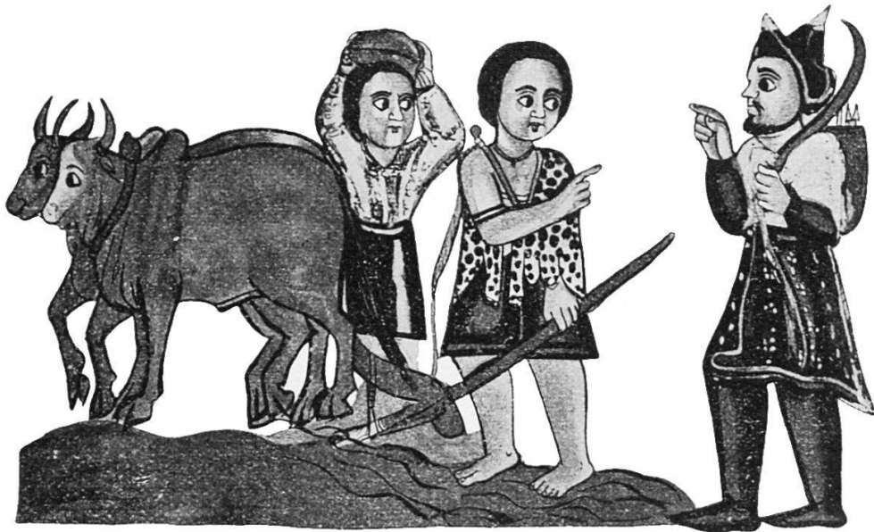
Abessinische Buckelrinder vor dem Pflug.

Zwar wird mit Bezug auf die Taube und das Pferd noch an der überkommenen Tradition festgehalten. Die Taube ist stets weiss und wenn z. B. Maria sich in eine weisse Taube verwandelt, um einen armen Gefangenen zu befreien und ihn durch die Lüfte zu tragen, so macht es dem abessinischen Künstler