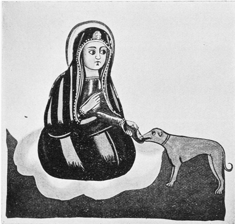
Die heilige Jungfrau, einen Hund tränkend.

werden, mögen sie im Übrigen eine Stellung einnehmen, wie sie wollen. Abessinische Soldaten z. B. kehren dem Beschauer immer das Gesicht zu. Dagegen gibt es auch Köpfe im Profil. So wird der Teufel immer im Profil gezeichnet, ebenso der Dieb, der Mörder, der Jude und der Neger; gleichzeitig ist Kinn und Nase um so spitzer, je unsympatischer der Charakter der dargestellten Persönlichkeit ist.