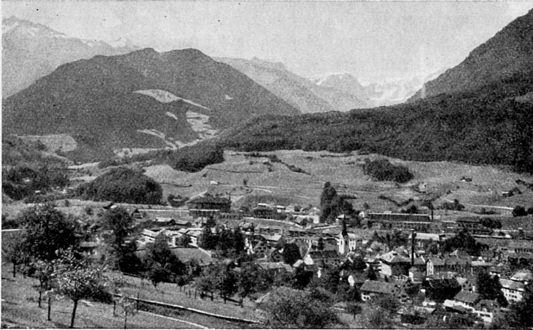
Abb. 2. Blick auf Ennenda. Im Mittelgrund die Bergsturmassen vom Glärnisch-Guppen, auf welchen östlich Sool liegt, hinter dem Wald rechts die Ortschaft Schwändi.

her, dämmte den tiefer liegenden Haslensee ab. Von unserm Standpunkt aus können wir die genannten Seen nicht sehen, dagegen einen ihrer unterirdischen Abflüsse, den mitten aus dem Abhang schäumend hervorbrechenden Rautibach. Der Klosterhügel und andere kleine Erhebungen in der Talebene um Näfels herum sind Relikte des ersten Bergsturzes.