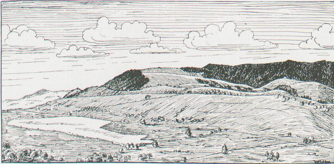
Abb. 1. Blick von der Laubegg auf Hüttner See und Hohen Ron.