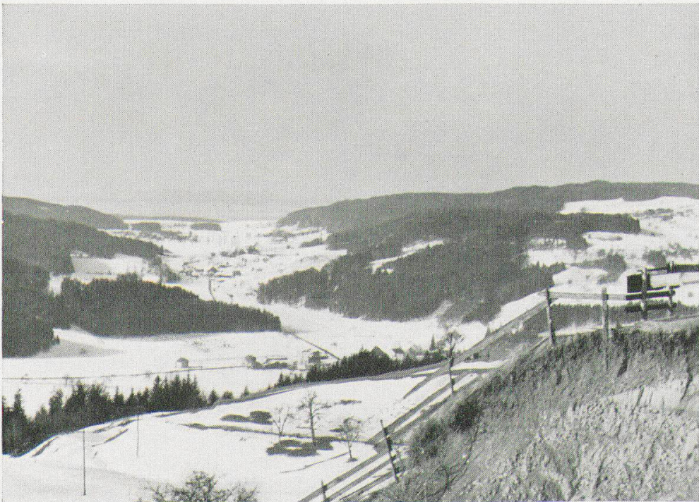
Abb. 2. Blick von Vorder-Eich (768 m ü. M.) ob Saland ins Trockenquertal von Hittnau. Rechts: Tannenbergl (821 m ü. M.), links: Zimberg (742 m ü. M.). In der Mulde liegen die Weiler Laubberg, Hasel, Schönau. Die Muldenpartie im Hintergrund (Unter-Hittnau) entwässert sich zum Pfäffiker See. Von dort drang zur Eiszeit ein Gletscherlappen ein. Schmelzwässer durchzogen den untern Teil der Mulde, in Richtung zur Töss. - „Biswind-Kanal!“ Februar 1940.