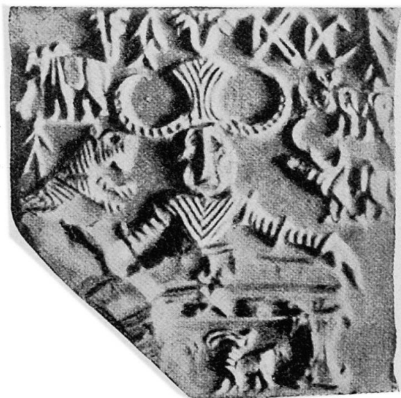
Abb. 7. Induskultur. Thronender Gott (Proto-Siva?), mit Ringen um den Hals. (Marshall, I, Tafel XII, 17.)

Eine Andeutung dafür, daß unser Gegenstand bzw. der Stier, mit dem er immer wieder in besonderer Weise verbunden erscheint, auch nach außen hin erkennbare Beziehungen zur Muttergöttin und zu ihrem Trabanten, dem «three-faced God» (Proto-Siva) hervortreten läßt, darf vielleicht in dem gleichen oder doch ganz ähnlichen Halsschmuck gesehen werden, der allen dreien, also dem «Einhorn»-Stier (Abb. 5), der Muttergöttin (Abb. 6), und dem Proto-Siva (Abb. 7), eigentümlich ist. Auf diese Tatsache hat seinerzeit schon J. MARSHALL hingewiesen 25 . Wir erinnern uns hier des Eisenringes, den der Gond-Panda zur Zeit der Novene um den Hals trägt, und zwar mit Rücksicht auf die Kali-Durga von Kâlighât bei Calcutta, die ebenfalls mit einem derartigen Ring ausgestattet sein soll.