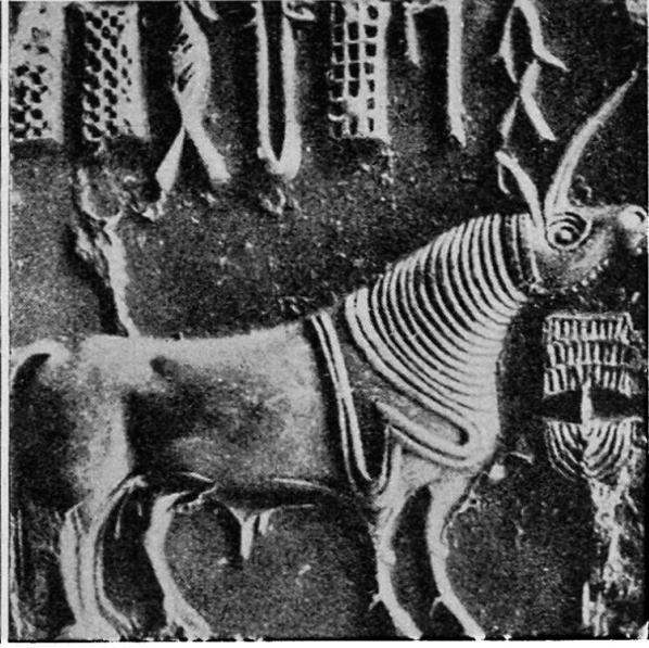
Abb. 5. Induskultur. Primigenius-Rind mit Ringen um den Hals. (Marshall, III, Tafel C III, 4)

Aber die Frage stellt sich, ob auch im Konkreten und Einzelnen Beziehungen zwischen der Kali-Durga-Novene, wie wir sie bei den Bhil und Gond kennenlernten, und der Induskultur festgestellt oder doch wahrscheinlich gemacht werden können. Ich glaube zeigen zu können, daß dieser Fall gegeben ist. Interessanterweise haben wir es dabei mit einem Gegenstand der Induskultur zu tun, der ihren Erforschern und Erklärern schon viel Kopfzerbrechen bereitet und eine gute Anzahl von wenig befriedigenden Theorien entlockt hat.