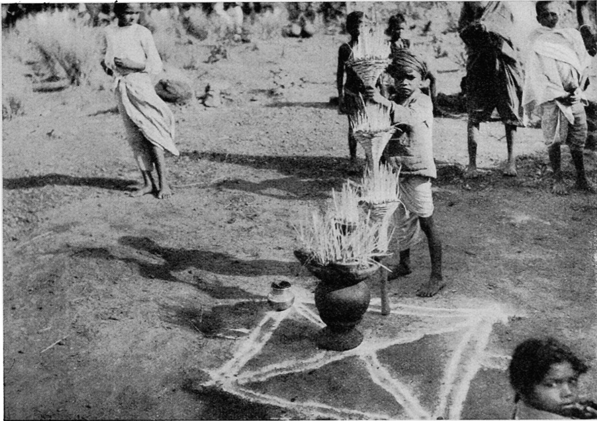
Abb. 1. Gond. Töpfe und Bambusständer werden auf das magische Viereck (Chauk) gestellt.

Ein anderer Teil gilt den «kleinen bösen Geistern», worunter allgemein die Seelen der Verstorbenen verstanden werden; man nennt sie Bhuts. Die zwölf restlichen Parteien verteilen sich auf sieben Götter und fünf Göttinnen. Die sieben Götter sind: Kasumor, Wagazo, Ghorazo, Nârhing, Manâto, Kalo Bheru, Dewro. Die Namen der fünf Göttinnen lauten: Sâwan Mata, Zami, Hunwara, Pâthwara, Kâlka 4 .