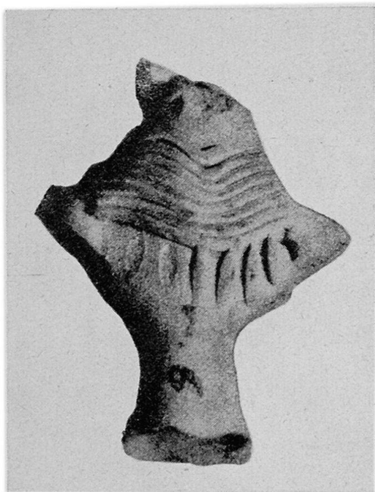
Abb. 6. Induskultur. Fragment der Darstellung eines weiblichen Idols (Muttergöttin?), mit Ringen um den Hals. (Marshall, I, Tafel XII, 8.)

Die weitere Frage, ob jene Gegenstände bei den Leuten der Induskultur auch eine profane Aufgabe zu erfüllen hatten, vermögen wir mit Sicherheit nicht zu beantworten. Daß die Gond für ihre Bambusständer eine praktische Verwertung nicht kennen, haben wir gesehen. Dieser Sachverhalt spricht wohl dafür, daß sie, wenn nicht den ganzen Ritus, so doch dieses Detail daraus einmal von irgendwoher übernommen haben. Ob dafür die Induskultur als direkte Quelle in Betracht käme, ist natürlich wenig wahrscheinlich. Aber an die Induskultur als indirekte Quelle zu denken, dürfte als gestattet erscheinen.