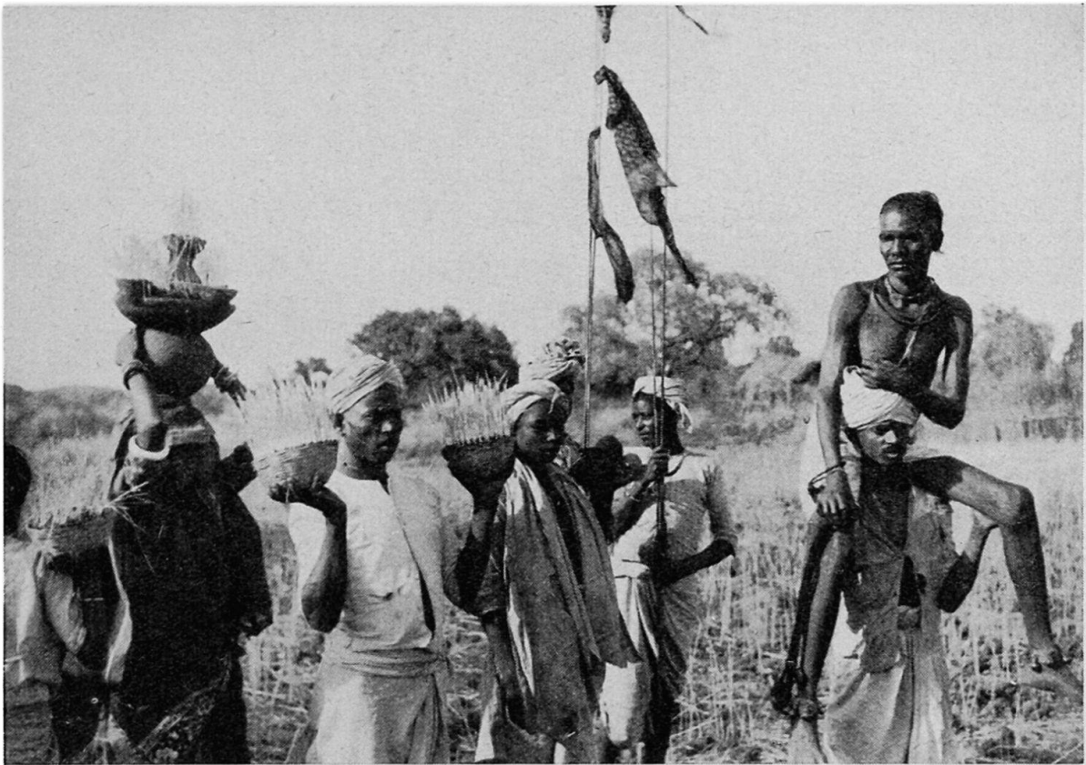
Abb. 2. Gond. Szene aus der zur Wasserstelle ziehenden Prozession.