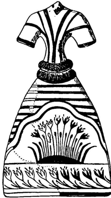
Abb. 8. Alt-Kreta (Knossos). Weibliche Gestalt (Muttergöttin?). Unten Pflanzen- und Blumenarrangement. (Nach C. Clemen, Religionsgeschichte Europas I, Heidelberg 1926, S. 102.)

Daß es auch sonst in der indischen Bevölkerung an Anzeichen für Verbindungen mit dem alten vorindogermanischen Orient nicht zu fehlen scheint, mag noch folgendes Beispiel zeigen. In dem Dorfe Aulia unweit Khandwa (Central Provinces) leben hauptsächlich Angehörige hinduistischer Ackerbaukasten (Kunbi, usw.). Hier werden bei Gelegenheit eines zu Ehren der Muttergöttin veranstalteten Fruchtbarkeitsfestes, wie mir von dem an Ort und Stelle weilenden Missionar K. SCHMIDT in dankenswerter Weise erzählt wurde, tischartige Gestelle umhergetragen, auf denen ziemlich roh geformte weibliche Figuren, etwas unter Lebensgröße, in stehender Haltung befestigt