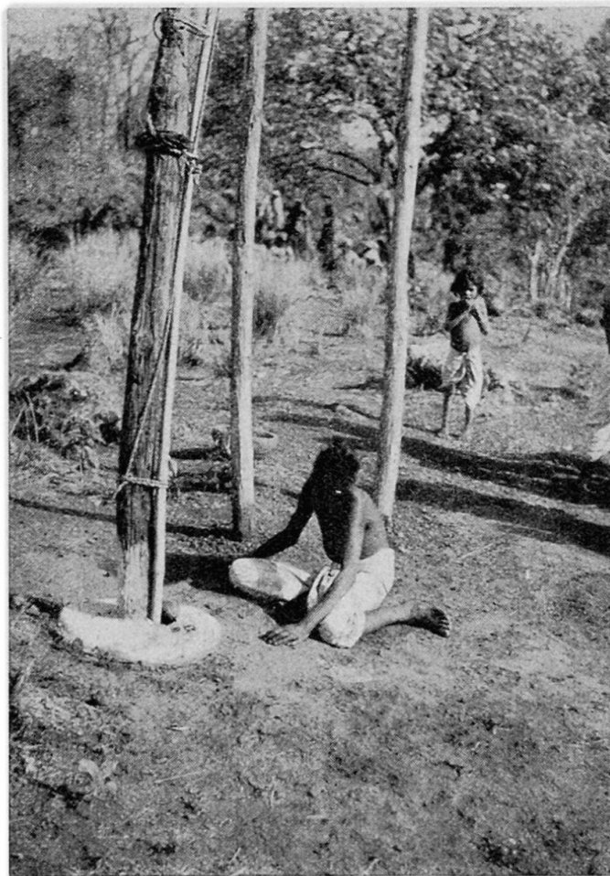
Abb. 3. Gond. Der Sohn des Zauberers liegt vor den Stangen, die die Matas repräsentieren.

Händen zur Verfügung. Auf einmal schwingt sich der Panda auf die Schultern eines kräftigen, noch jüngern Mannes. Er reitet darauf, wie auf einem Pferd (Abb. 2). Wie er später erzählte, habe ihm die Mata plötzlich eingegeben, auf den Rücken jenes Mannes hinaufzusteigen. Auf die Frage, was wohl geschehen wäre, wenn die Wahl eine schwächere Person getroffen hätte, antwortete er schnell und bestimmt, daß das gar nichts gemacht hätte; denn die Mata wäre dem in einem solchen Falle gewiß mit der notwendigen Kraft zu Hilfe gekommen. Jener Träger wird übrigens für seine Mühewaltung nach-