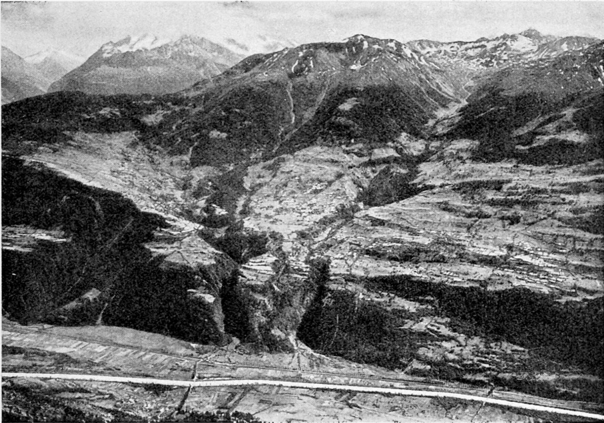
Abb. 1. Blick von der Lötschberg-Rampe nach Süden. Links Bürchen, über der Terrassenschulter der Moos-Alp die Mischabel-Balfrin-Gruppe. Zwischen dem Laub- und Mühlebach Unterbäch; Ginalstal und Schwarzhorn. Rechts Eischoll. Hell: Getreideäcker. Im Vordergrund das Rhonetal; Turtig gegenüber Raron.

Wie Moränen, erratische Blöcke und Gletscherschliffe zeigen, erfüllte der Gletscher der Würmeiszeit bei seinem höchsten Stande das Rhonetal bis zur Höhe von 2480 m. Er hat das Tal zum Trogtal mit weiter Sohle und steilen, in ziemlich gerader Flucht verlaufenden Wänden umgestaltet und hinterließ auf den Terrassen Grundmoräne und erratische Blöcke.