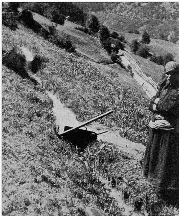
Abb. 4. In der aus dem Turtmantal kommenden Suone von Ergisch hat die Wächterin das Wasserbrett eingeschlagen und damit das Wasser auf die Wiese rechts abgeleitet.

Die Sägereien und die Mühlen werden durch überschlächtige Wasserräder betrieben. Die Schreinereien und der Bäcker von Unterbäch, der eine modern eingerichtete Backstube hat, benutzen elektrische Kraft. Das Roggenbrot, von dem täglich etwa 120 kg gebacken werden, wird ausschließlich aus Roggenmehl von Unterbäch hergestellt, das Mehl für das Weißbrot muß in gleicher Menge von Naters bezogen werden.