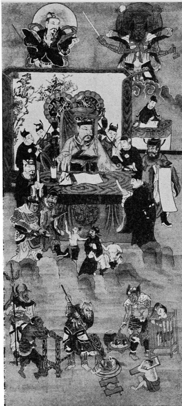
Abb. 1. Chinesisches Rollbild, farbig, 140 × 62 cm, mit Darstellung von Totengericht und Höllenstrafen. In der Mitte der an einem Tisch sitzende Schutzgott der Stadt, der «Vater der Mauern und Wallgräben», umgeben von seinen Trabanten. Rechts der Schutzpatron der Häscher und Polizisten, der auf einer Schreibtisch die Namen der Missetäter einträgt. Darunter die Sekretäre des Stadtgottes mit Buch und Pinsel in den Händen; sie bringen das Verhör, dem die abgeschiedenen Seelen unterzogen werden, zu Protokoll. Außer den Richtern und dem Zwergteufel, der die Missetäter vor das Höllengericht zu bringen hat, erkennen wir links unten die beiden Pfortner der Hölle, mit einem Dreizack bewaffnet. Beide haben menschliche Gestalt, aber der eine hat einen Pferdekopf (Ma-mien = Pferdegesicht), während der andere (Niu-tou = Rindkopf) einen Ochsenkopf trägt. Die verschiedenen Höllenstrafen sind sehr naturalistisch dargestellt.

Zu diesen Neuerwerbungen sei bemerkt, daß deren Ankauf nur durch den Erlös aus dem Verkauf der letzten Dubletten der afrikanischen Coraysammlung und durch Tausch in diesem Umfang möglich gewesen ist. Im übrigen mußten wir uns, da die Preise für Ethnographica im Vergleich zur Vorkriegszeit stark gestiegen sind und die uns dafür zur Verfügung stehenden Subsidien, die für die heutigen Verhältnisse sehr knapp bemessen sind und für den Ankauf der immer teurer werdenden Objekte nicht mehr ausreichen, darin leider äußerste Zurückhaltung auferlegen. Die Sammlung für Völkerkunde beteiligte sich mit 226 Objekten an der Aus-