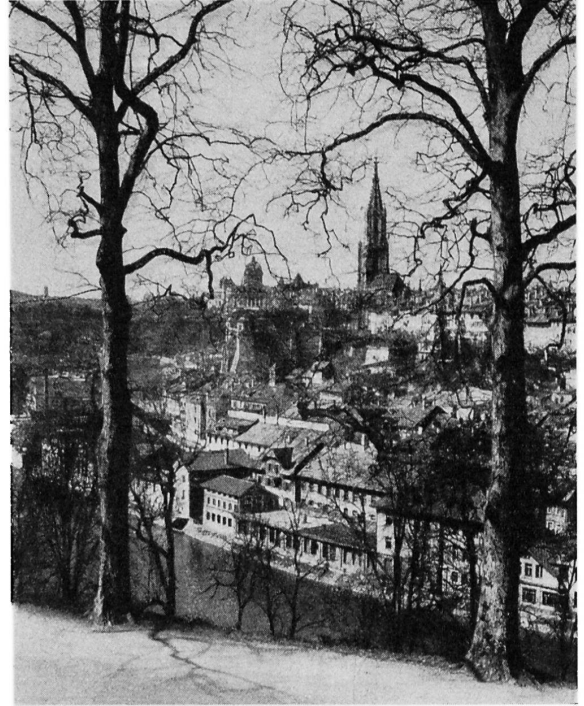
Bild 2. Ansicht von Bern vom gleichen Standort aus wie Bild 1, um 1940. Das Quartier Matte ist teilweise umgebaut, der Hang der Halbinsel mit weiteren Häusern besetzt, das Münster hat den vollständig ausgebauten Turm erhalten. Links ist die Kuppel des Bundeshauses.