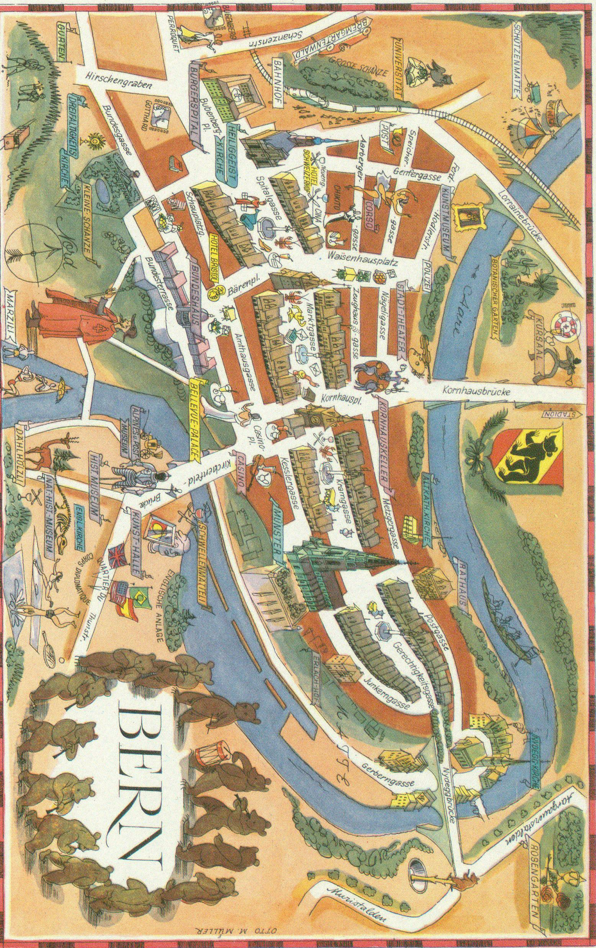
Illustration aus dem Reisewerk «Switzerland»