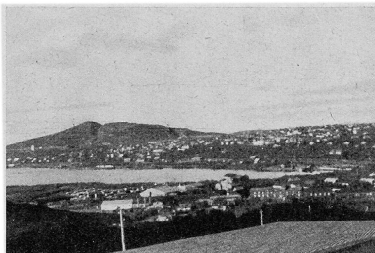
Abb. 5. Kiruna mit dem Luossavaara-Erzberg und dem Luossasee. Vorn die Gebäude der Grubenverwaltung. Am Bergeinschnitt die Erzabbaustellen.

keinesfalls abwegig ist, diese Landschaft als nicht mehr zu Schwedisch-Lappland gehörend zu betrachten. Obwohl diese Landschaft bei landschaftskundlicher Betrachtung nicht mehr ganz zur Einheit der lappländischen Wirtschaftslandschaft gehört, morphologisch aber doch noch als deren Ausläufer und abgrenzendes Randgebiet zu werten ist, sei sie nur kurz skizziert. Sie weist gegenüber der Wald- oder gar der Fjälllandschaft ganz andere Merkmale auf; im nördlichsten Teil wird sie von der Bergbau-, Industrie- und Verkehrslandschaft (Boden und Lulea) überdeckt. Die Landschaft zieht sich in 30—60 km Breite längs des Bottnischen Meerbusens hin. Das ebene Land, die geringen Niederschläge (meist unter 50 cm jährlicher Regenmenge), das mildere Klima dank der Meeresnähe und der gute Boden machen die Landschaft zu einem verhältnismäßig guten Ackerland. Weizenbau ist allerdings nicht mehr möglich, dafür Roggen-, Gerste-, Hafer-, Kartoffel- und Gemüsebau. Im Norden teilweise parallel, gegen Süden zu immer mehr divergierend, verläuft die Nordgrenze des Roggenbaues (siehe Karte). Die Renttierwirtschaft ist nur noch sporadisch vertreten und geht bis an die Küste nur in zwei Zonen (von Kallholmen bis südlich Umea und von Härnosand an südlich); Rindvieh und Pferde machen dem Ren den Platz streitig.