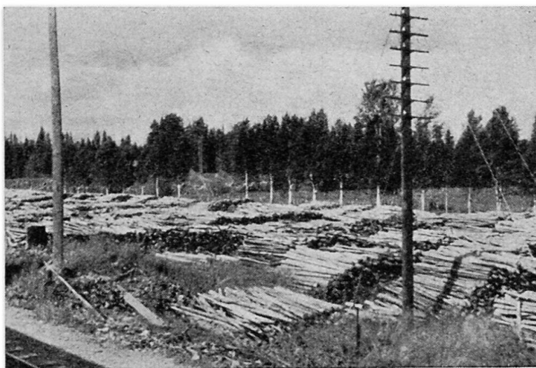
Abb. 4. Holzstapel an der Bahn Östersund—Strömsund in Nord-Jämtland. Auffallend sind die relativ dünnen Baumstämme.

das sozusagen an der Oberfläche liegt, konnte bis jetzt zur Hauptsache im Tagbau und nur wenig unter Tag gefördert werden. Neuerdings wurden nun auch viele Kilometer lange Stollen in den Berg getrieben, und man begann das Erz unterirdisch abzubauen. Die großen Kälteeinbrüche im Winter (bis zu -40^{\circ}\text{C} ), die vom September bis Mai während der Schneebedeckung, die furchtbare Mückenplage im Hochsommer, die großen Schnee- und Vereisungen im Winter, die