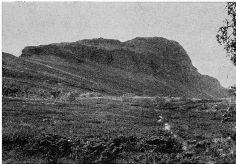
Abb. 1. Landschaft in Lule Lappmark bei Saetoluokta, zirka 670 m ü. M. Hier ungefähr liegt die Baumgrenze.

Die lichte Birkenwaldlandschaft bildet den Übergang von der Nadelwald- zur Fjälllandschaft und im Norden zur Tundrazone. Die Bodengrundlage ist noch dieselbe wie im Fjäll. Geschlossene Hochwaldbestände fehlen, und die Zwerg- oder Fjällbirken werden selten höher als 3—4 Meter, gegen Norden und nach der Höhe hin kaum mehr mannshoch, bis sie schließlich zu Sträuchern verkümmern (Bild 1). Stellenweise gedeihen noch Föhren und Espen, vor allem aber Heidelbeeren, Farne, Moose und Flechten. Auffallend ist, wie die Birken- und Föhrenstämme infolge Ungunst der Natur verkrüppeln und nur ganz selten schöne, gerade Stämme liefern. Das winterfeuchte, subarktische Klima, die Bodengrundlage und die verkehrungünstige Lage machen aus Lappland geradezu ein klassisches Waldland, und daher nimmt auch die Nadel- und Mischwaldlandschaft den größten Raum ein. Lappland ist insofern verkehrungünstig, als die zahlreichen Moore und Flüsse, die alle quer zur Längsausdehnung des Landes verlaufen, in ihrem Lauf Seen und Stromschnellen bilden und so die Süd-nordpassagen sehr erschweren. Dazu sind die Flüsse nicht einmal schiffbar, und selbst die Flößerei ist nur stellenweise, vornehmlich am Unterlauf, möglich. Im Winter gefrieren alle Flüsse und bieten dann auf diese Art Verkehrswege. Die größten und die schönsten Waldlandschaften Lapplands sind die Lappmarken