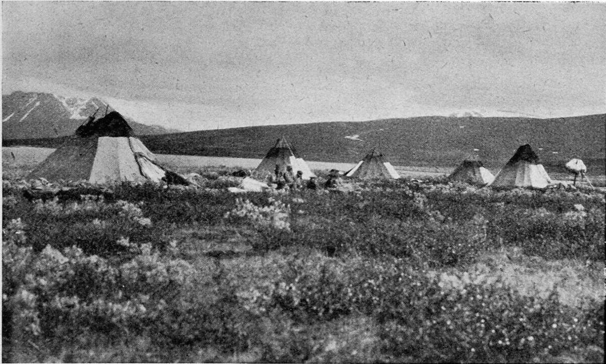
Abb. 3. Jokkmokk-Lappen in einem Sommerlager im Fjäll. (Käufliche Postkarte)

Das Holz wird für alle möglichen Zwecke verwendet, der weitaus größte Teil in der schwedischen Holzverarbeitungsindustrie als Papier-, Zünd-, Bau- und Grubenholz und ein weiterer großer Teil in den Köhlereien zu Holzkohle, deren die Schweden für ihre Eisenindustrie sehr viel bedürfen. In der Birkenwaldzone kann aber nicht einmal mehr Bauholz gewonnen werden; denn die Stämme sind zu klein und zu knorrig 4 . Bretter können unmöglich mehr daraus geschnitten werden, und es lassen sich aus den Fjällbirken höchstens noch Stangen zimmern für die Koten und Zelte der Lappen. In Vaisaluokta, einer der einsamsten und abgelegensten Lappensiedlungen in Lule Lappmark, dient ein einziges schmales, wahrscheinlich vom Sägewerk in Suorva bezogenes Brett von 20 cm Breite und 2 m Länge dem Motorboot als Landungssteg — aus den vorhandenen Birken der Umgebung hätte sich kein geeigneter Balken zimmern lassen!