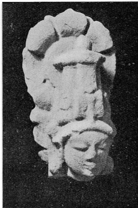
Abb. 3. Kopf einer weiblichen Gottheit aus Südindien. Sandstein. 30×17 cm.

Die Geographisch-Ethnographische Gesellschaft überwies der Sammlung für Völkerkunde den gewohnten Beitrag von Fr. 500.—, der an dieser Stelle bestens verdankt sei. A. STEINMANN