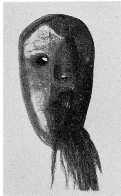
Abb. 2. Schwarze Holzmaske der Araukaner (Südamerika). 29 × 17 cm.

Durch die vom Kanton Zürich der Sammlung zugebilligte Erhöhung des Staatskredits sowie der von der Stadt Zürich ebenfalls erfolgten Erhöhung des jährlichen Beitrages war es möglich, trotz der erheblichen Verteuerung der Ethnographica, einige empfindliche Lücken im Ausstellungsgut durch Ankauf zu schließen. So konnte der angestrebte, durch mindestens einen charakteristischen Vertreter veranschaulichte Gesamtüberblick über die Phasen der Entwicklung der chinesischen Keramik vervollständigt und die kleine Sammlung von Objekten aus der hindujavanischen Epoche der indonesischen Kultur ergänzt werden. Ferner trugen verschiedene Leihgaben zur Vervollständigung und Abrundung der bis anhin recht dürftigen Bestände aus der Kultur südamerikanischer Indianerstämme wesentlich bei.