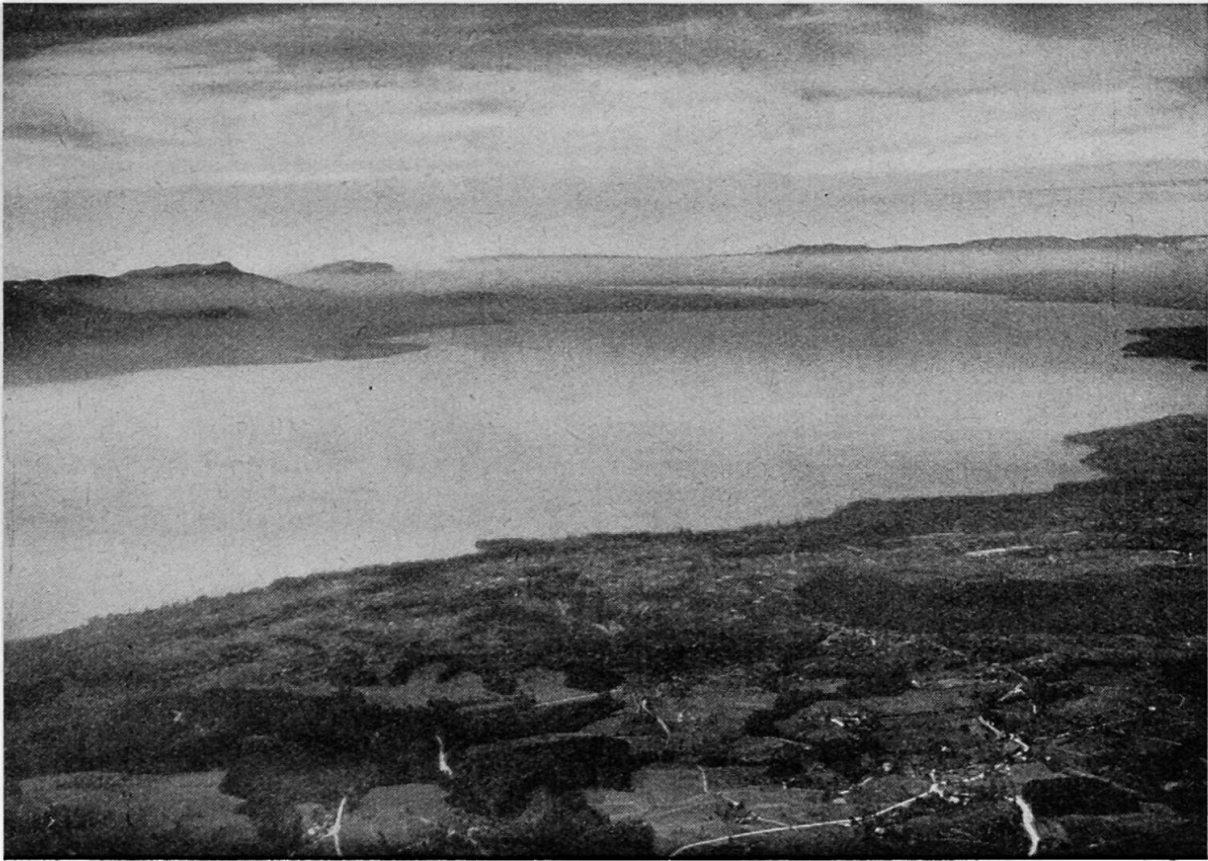
Le Léman vu des environs de Lausanne.