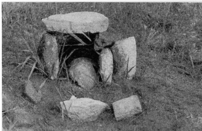
Fig. 2. Tumulus à placenta partiellement détruit par les pluies, situé derrière une maison de Mulenge.

Pendant trois jours notre safari continue, toujours sur les pistes du bétail. Ce pays montagneux est d'un grand charme et il nous réserve des surprises à chaque tournant du chemin: on passe par des monts et des vallées, par des forêts et des marais; on descend aux sources de l'Elila qu'on traverse à gué; on monte de nouveau à côté de chutes d'eau qui tombent des rochers, et on arrive dans une forêt de bambous habitée par des gorilles de montagne. Cette région n'est visitée que de temps en temps par quelques chasseurs Babembe, proches parents des Warega du Maniema et très friands de viande de