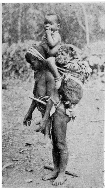
Abb. 2. Bambuti-Pygmäin beim Sammeln.

Das Wirtschaften der Pygmäen ist das freibeuterische Sammeln und Jagen, mit dem sich folgerichtig eine ausschließlich nomadisierende Lebensweise verbindet, im ganzen ihre eigene Schöpfung unter dem Zwange der übermächtigen, gewalttätigen Umwelt. Zwangsläufig verteilt sich die Gesamtheit der afrikanischen Pygmäen als mehrere selbständige Volksstämme über die breitgezogene tropische Hyläa, und ein jedes dieser Völker — fern davon, eine geschlossene Einheit zu bilden — steht da als eine beträchtliche Anzahl kleiner Horden, die ohne gegenseitige Verbindung lose nebeneinanderleben. Solch eine Horde gibt sich als Zusammenschluß einiger Familien zu erkennen, welche letztere sich gegenseitig verwandt fühlen und einander unterstützen; einem besonderen Häuptling oder autoritativen Führer unterstehen sie nicht. Ebensowenig wird das gesamte Pygmäenvolk von einer alle Einzelhorden zusammenfassenden Autoritätsperson mit irgendwelcher Machtbefugnis geleitet oder regiert.