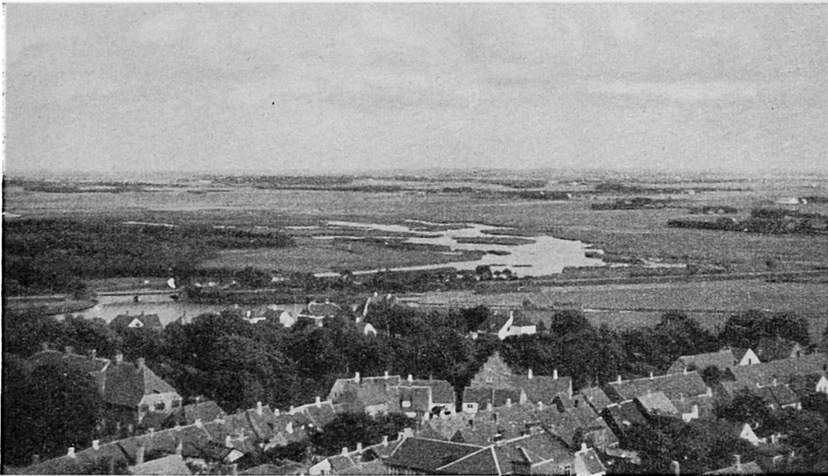
Blick vom Turm des Doms von Ribe, Richtung Nordsee. Natürliches Weideland mit Höfen und Weilern im Rückstaugebiet des Salzwassers.

finden. Die bäuerlichen Kleinbetriebe konnten ohne große Spesen, Zwischenhandelsverluste und Marktrisiken nur dann eine Veredlung aufziehen, wenn der Ein- und Verkauf zusammengelegt und die produzierten Qualitäten standardisiert wurden. Tatsächlich sind das dänische Frischei, die dänische Markenbutter und die dänische Schweinehälfte so normalisiert, daß man sie in Kopenhagen, in London und auf anderen Weltmärkten schon vor dem ersten Weltkrieg ungesehen nach Qualitätsbezeichnung kaufte und verkaufte. Neben der allgemein genossenschaftlich organisierten Verarbeitung der Milch in Betrieben, die meistens über 10000 Liter Tagesleistung haben, wird durch einen verzweigten Berater- und Konsulentendienst erreicht, daß die Fütterung der Kühe und Schweine so gleichmäßig ist, daß man gleichmäßige Produkte erzielt. Die Genossenschaftsmolkereien erfassen 90 % der Milch, die überhaupt von Molkereien bearbeitet wird; sie exportieren 47 % der dänischen Butter, 84 % der Schweine, 25 % der Eier und 39 % des Rindfleisches. Ebenso haben sie 67 % der eingeführten Futtermittel abgesetzt. Die Belehrung über den Wert und die Eigenschaften der Futtermittel und über die veränderte Wirtschaftslage ermöglichen allgemein eine gleichmäßige, die Nährstoffe richtig ausnützende Fütterung und eine Anpassung an den Markt, die sonst nie möglich wäre.