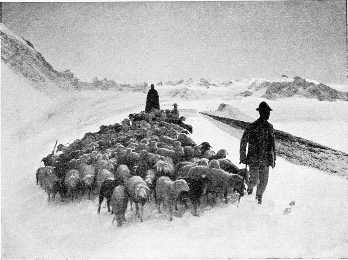
Vom Schneesturm überrascht. Wanderherde auf dem Casanna-Grat (Parsenn)

keinen Einfluß, wenn das Vlies wenigstens 2 bis 8 cm lang ist. Im strengen Winter 1950/51 haben verschiedene Herden ihre Wanderungen nie unterbrochen und die Tiere nahmen keinen nennenswerten Schaden. Doch sind in der Regel die Schafe in vorgeschriebene Stallungen unterzubringen und mit Heu zu füttern, bis die Wanderung fortgesetzt werden kann.