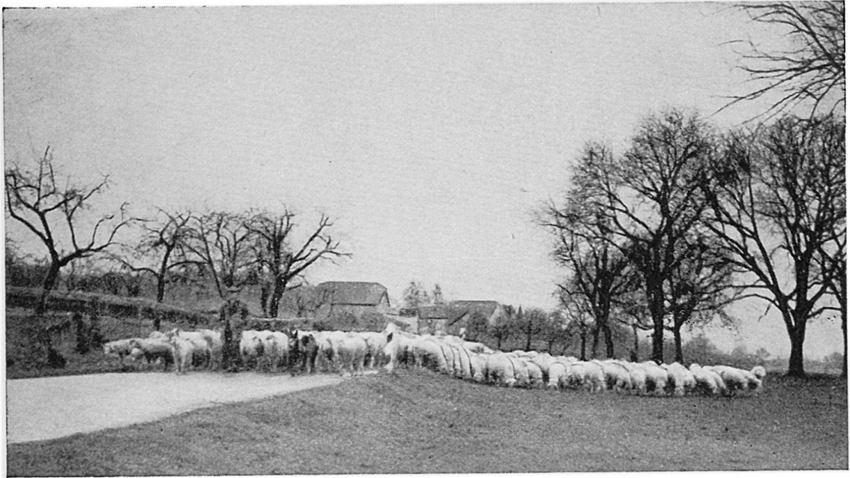
Luzerner Wanderschafherde bei Lausanne

Jeder Herdenbesitzer geht mit seinen Herden immer ungefähr dieselben Wege. Einige Herden kommen regelmäßig im Frühling auf ihre Ausgangspunkte zurück und werden auf gepachteten Alpweiden und auf den Sport- und Flugplätzen des Mittellandes gesömmert (d. h. nur die Zuchttiere und diejenigen Schafe, meistens junge Tiere, welche im Winter nicht abgestoßen wurden). Andere Herden werden im Herbst so zusammengestellt, daß keine Zuchttiere dabei sind, so daß alle Schafe während der Winterwanderung abgestoßen werden können. Die Herden wandern auf verschiedenen, getrennten Routen durchs Mittelland, einige werden eine Strecke weit mit der Bahn transportiert, andere wandern ein paar hundert Kilometer, andere dagegen relativ wenig weit. Auf Grund meiner Erhebungen bei allen Herdenbesitzern lassen sich etwa folgende Ausgangspunkte und Wanderrouten festhalten: