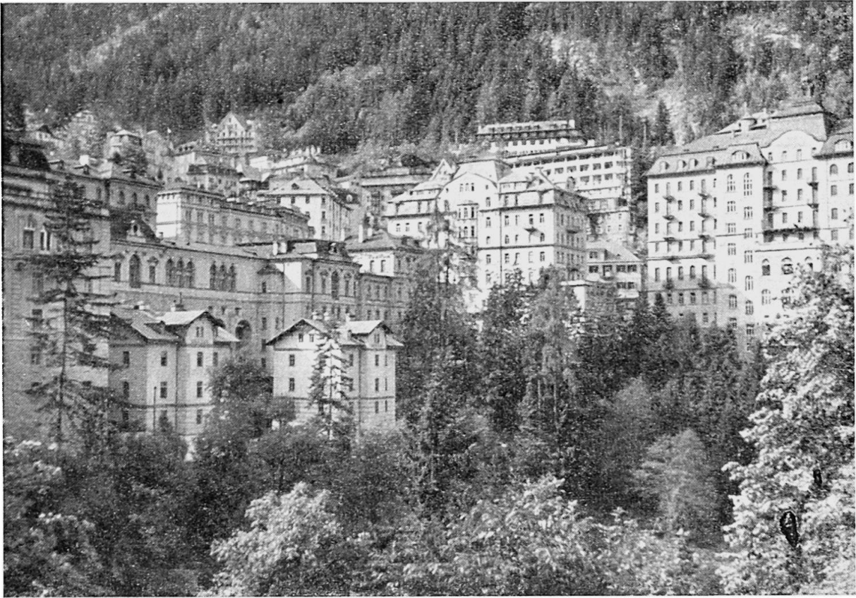
Hotelstadt Bad Gastein. Blick gegen die westliche Talflanke am Stubnerkogel (2248 m)

Von Bruck an der Großglocknerroute nach dem Verkehrsknoten Schwarzach—St. Veit an der Tauernlinie (Salzburg—Villach) fließt die Salzach durch ein schluchtartiges Tal. Nach der Spitzkehre in Schwarzach rollt der Zug durch das Tal der Gasteiner Ache den aus Granit und kristallinen Schiefen gefügten Tauern entgegen, welche dem Aar- und Gotthardmassiv vergleichbar das Zentralgebirge der Ostalpen bildet. Der 1906 bis 1909 erbaute, 8,5 km lange Tunnel durchsticht auf rund 1200 m Höhe die östliche Gruppe der Hohen Tauern (Ankogel 3246 m). Die Südrampe erinnert an die Lötschbergstrecke Goppenstein—Brig. Dem linken Hang des engen Mölltales entlang erreicht der Schienenstrang endlich bei Spittal den Talgrund, die breite Talsohle der am Ostfuß der Dolomiten entspringenden Drau. Bei Villach tritt der stattliche Fluß in eines der für die Ostalpen typischen Tertiärbecken ein: die Kernlandschaft von Kärnten. Gegen Süden wird das vom einstigen Draugletscher geprägte, seenreiche Becken durch die imposante Grenzmauer der Karawanken abgeschlossen. Bei einbrechender Nacht manövierte eine Dampflokomotive den Extrazug von Villach nach Velden am Wörthersee, wo die Reisegesellschaft im prächtigen Schloßhotel Unterkunft fand.