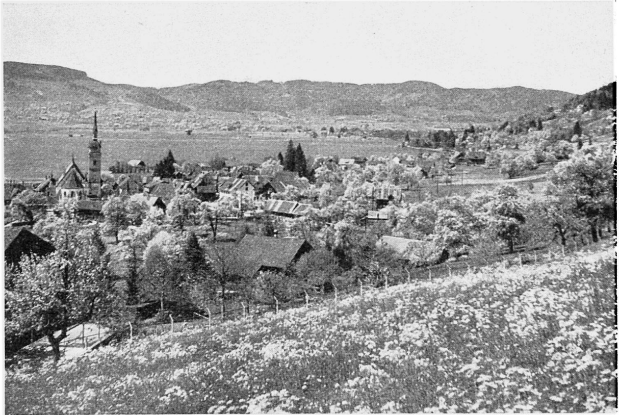
Abb. 1 Hochtal von Ägeri , Blick über Oberägeri und den Ägerisee auf den Zugerberg (Hintergrund)

und Ton in diese grobe Situation einfügen. Die Schulpraxis zeigte, daß eine solche Karte zur Einführung in das Verständnis der Landschaft, zum Kartenlesen, sich schlecht eignet, und Kartenleseübungen auch mit größeren Schülern mit ihr ergaben klägliche Resultate. Die Kartenkommission zur Erstellung einer neuen Schülerkarte verweilte daher nicht lange bei der Frage, ob für die Unterstufe eine primitivere Darstellung als für die obere Klassen und den Touristen zu wählen sei. Immerhin entstand eine interessante Diskussion über dieses Thema, ein Thema, das auch andernorts bei der Neuschaffung von Schülerkarten aufgerollt zu werden verdient.