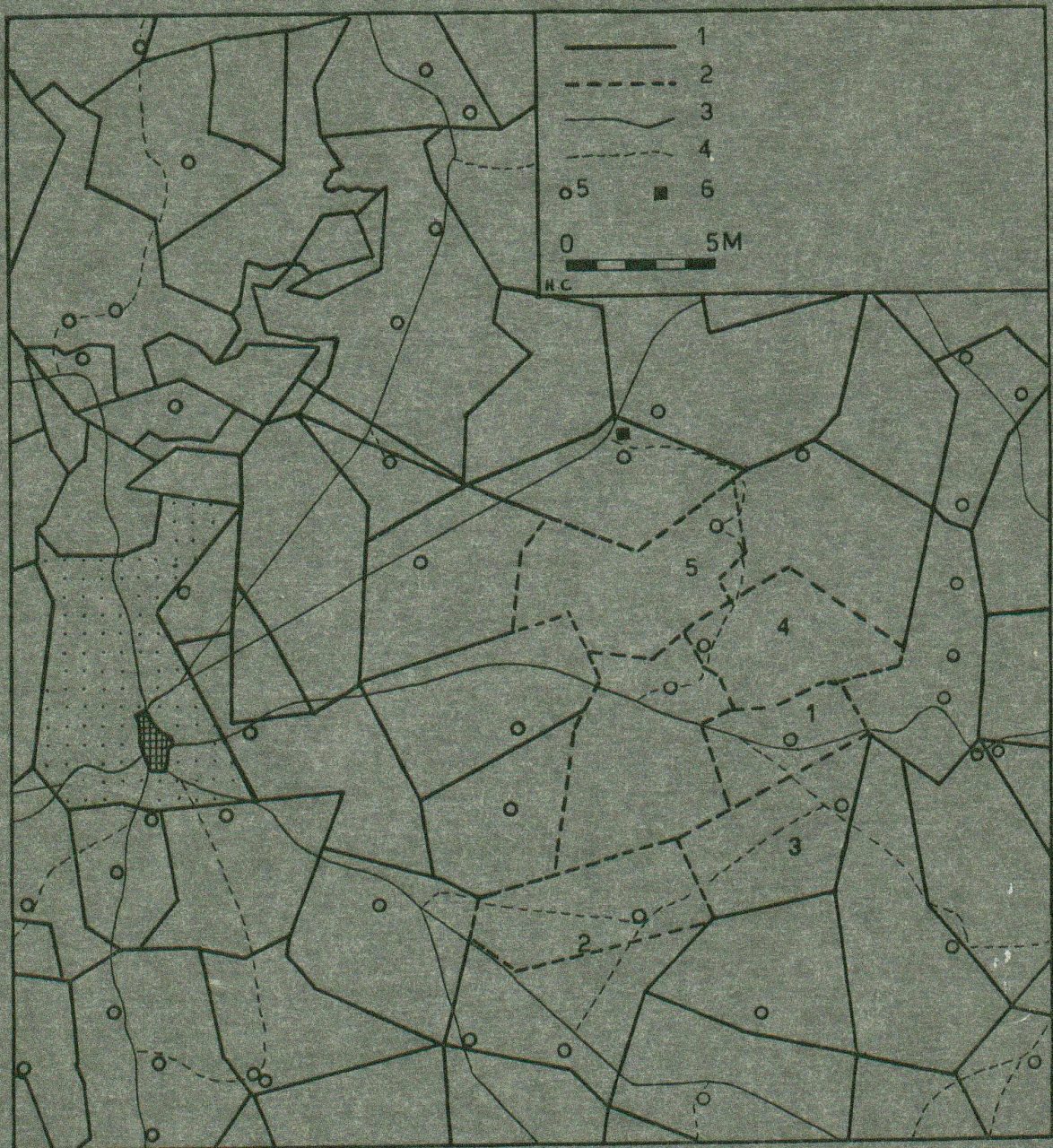
Fig. 12 Betriebliche Struktur der Agrarlandschaft von Beaufort West. 1 = Farmgrenzen nach älterer Grundbuchkarte, 2 = heutige Grenzen von untersuchten Farmen, 3 = Straßen, 4 = Fahrwege, 5 = Farmgebäude (nach topogr. Karte 1:250 000), 6 = Allesladen.